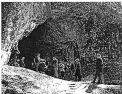
A tanulmányút résztvevői az Istállóskői-barlangnál

2004. április 16—18. között a Társulat Régészeti Munkabizottságának és a Társulat Titkárságának közös szervezésében 3 napos tanulmányútra került sor a Bükk ősrégészeti szempontból jelentős barlangjainak bejárására, kapcsolódva a februárban és márciusban a Szemlő-hegyi-barlang vetítőtermében megtartott 4 előadáshoz. A tanulmányúton 32 fő vett részt. A mostoha időjárási körülmények (szombaton egész napos eső), valamint a lillafüredi parkolóban feltört két autó okozta kellemetlenségektől eltekintve a tanulmányút a résztvevők egyhangú megállapítása alapján rendkívül jól sikerült. Valamennyien egyetértettek abban, hogy a Társulat egyik jövőbeni feladata hasonló színvonalú és szakmai ismereteket nyújtó kirándulások szervezése.