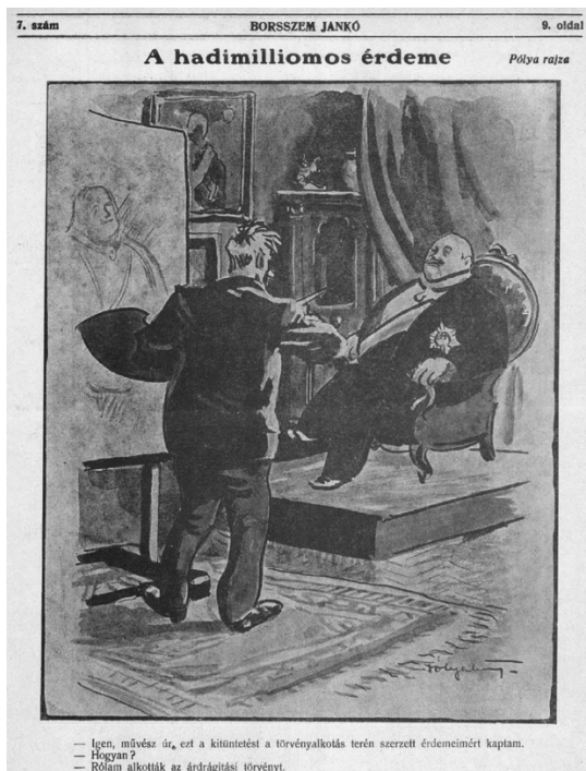
2. kép. Egy háborús „árdrágító” karikatúrája a Borsszem Jankó ból

A hadiszállítók látványos gyarapodása nem számított szokatlannak – a történelem korábbi háborúi nagyban hozzájárultak a Fuggerek, Rotschildok és más bankárok gazdagodásához. 17 Az I. világháborúban azonban sokkal több erőforrást kellett mozgósítani, mint a korábbi konfliktusok során, és ezzel nőtt a beszállítók, tehát a nyereségre esélyesek köre is. Meglepő módon a világháború kitöréséhez vezető 1914-es „júliusi válság” során még senki nem foglalkozott a háború finanszírozásának kérdésével, holott már 1912-ben részletes háborús törvényt fogadott el a képviselőház: még meglepőbb azonban, hogy a háború elhúzódása után sem adóztatta meg a busás vállalati nyereségeket sem Ausztria, sem Magyarország, sem a Német Birodalom, annak ellenére, hogy erre épp ellenségeik, mindenekelőtt Franciaország szolgáltattott példát. 18