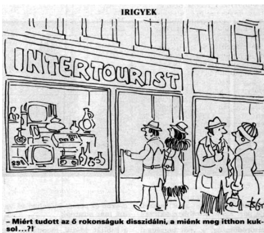
1. kép. Vásárlók az Intertourist üzlete előtt

A legtöbben e három nagyvállalat valutáért árusító boltjaira emlékeznek, és ezeket említi a legtöbb forrás is, ám már egy 1977-es olvasói levél is szóvá tette, hogy egy valutás boltokról szóló cikkben csak az Inter- és Konsumturist boltokat és az IKKA-t említették, s kimaradtak az Utastourist-bolthálózat üzletei. 37