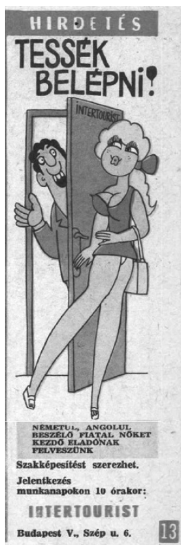
4. kép. Intertourist állás-hirdetés karikatúrá