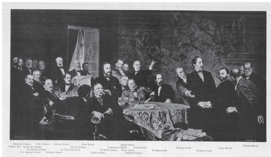
1. kép. Benczúr Gyula: Az Első Magyar Általános Biztosító Társaság alapítóinak első alakuló közgyűlése, 1857. július 15. (Forrás: Vasárnapi Ujság, 1883. április 1.)

Jellinek Mór (1824–1883) és a magyar gazdaság modernizációja*