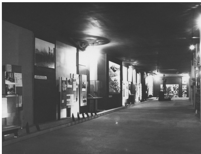
3. kép. Az 1965-ben megnyílt auschwitzi magyar kiállítás részlete tablókkal © Państwowe Muzeum Auschwitz–Birkenau (Neg. Nr. 14107)

erőszakkal nyitott. Ez a döntés azon az értelmezésen alapult, amely a Horty-rendszert „fasiszta típusú diktatúrának” tekintette, amely – ahogy egyesek érveltek – „szükségyszerűen” vezetett Auschwitzhoz. 33