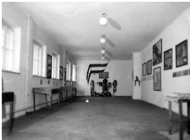
1. kép. Az 1960-ban megnyílt auschwitzi magyar kiállítás részlete (Neg. Nr. 6314)

amelyek alapján kép alkotható a bemutatás módjáról (1–2. kép), sőt egyes tartalmi elemek is kivehetők: így a Petőfi-szobornál tartott 1942-es antifasiszta megmozdulásnak, a vidéki deportálásoknak, a Szálasi-féle hatalomátvételnek, a budapesti „nagy” gettó felállításának és a budapesti tömegsírok feltárásának a képei. 26 A kiállítás koncepciójáról azonban nehéz közelebbit mondani, amíg a forgatókönyv elő nem kerül. 27