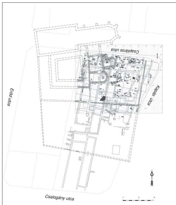
6. kép. A középkori karmelita kolostor ásatási felmérése a rendház, a temető és a kert részletével

(Geodézia: Viemann Zsolt, Alibán András)