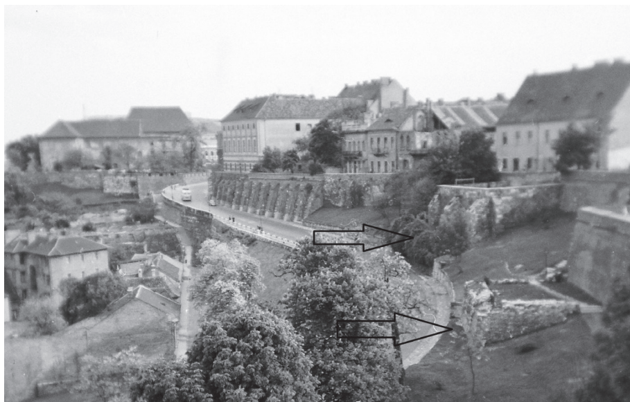
2. kép. Pomariumok falai a Hunyadi János úton, 1959

Legnagyobb meglepetésünkre ezek közül kettő még ma is áll a keleti várfal mellett, a Hunyadi János út mentén (2. kép).