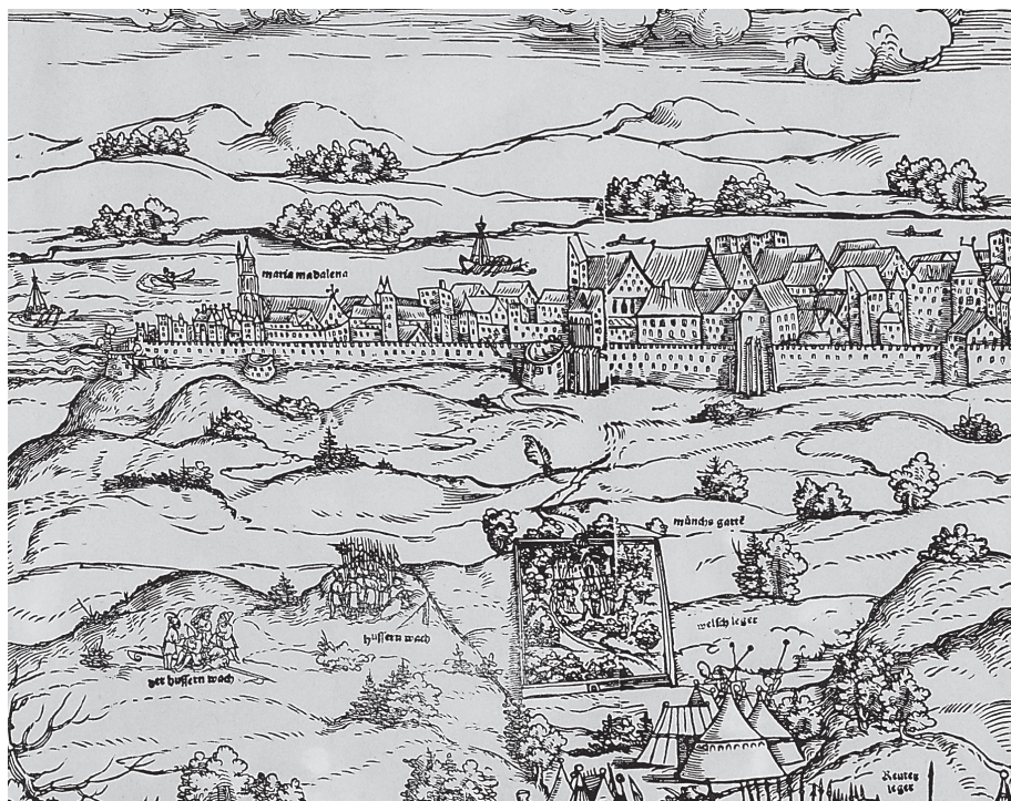
4. kép. Majorság ábrázolása Erhard Schön rézmetszetén (1541) (BTM Kiscelli Múzeum, Metszettár)

mutatnak. Úgy tűnik, hogy a kertet a törökkor végéig használták, mert még 1684-ben is rendezettnek látszik, sőt egy rajzon ezt a területet kis kastélynak („ein kleines Schloss”) nevezték. 1686-ban a közeli török temető már teljesen körülvette a kertet, a ház teteje leégett, a kéménykürtő csonkán állt. 65 Az épületet és a kertfalakat a város visszafoglalása után nyom nélkül elbontották, ezért helyét ma nehezen lehet meghatározni. Csak annyi tűnik biztosnak, hogy a széles marhahajtó út (fehérvári nagyút, ma Alkotás utca) keleti oldalán állt, a Kis Svábhegy és a Várhegy közötti területen.