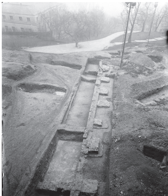
5. kép. Majorság kökerítése a domonkosok alatti várlejtőn

a kerengővel övezett belső udvarok voltak, amelyek közepén a legtöbb esetben egy díszes kávájú kút mélyült a földre. A viridarium okban színes szirmú virágok, kis-méretű fák, nyírt sövények és keskeny ösvények szolgálták a lelki kikapcsolódást. Mivel a kolostorok önellátó közösségekként működtek, szükségük volt kisebb-nagyobb zöldsüges- ( solarium ) és gyümölcsöskertre ( pomarium ), amelyben a szerzetesek és a szolgálok egyaránt dolgozhattak. Tomori Pál például maga kapálta a babot az esztergomi kolostor veteményeskertjében. 72 A betegápoló rendek és az ispotályt is működtető kolostorok szerzeteseinek fontos „munkaeszközei” lehettek a gyógynövények, amelyeket saját falaikon belül is tudtak termesztetni a gyógynövényes kertben ( herbarium ). A következőkben csak azt a néhány budai kolostort említjük, amelyek kertjeiről írott vagy régészeti adat maradt fenn. 73