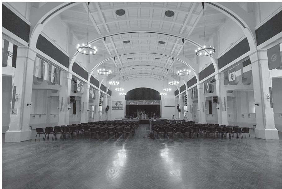
5. kép. A díszterem. (Balogh Marcell 2017)

Az örökség hordozóit tekintve fontos megemlíteni a Biblia Szól Egyház szerepét. A gyülekezet 1999-ben vásárolta meg a teremépületet, amelyet a Rhema Szolgáltató Kft.-n keresztül üzemeltet. 80 A körülbelül 250 fős kisegyház korábban itt tartotta fenn a Kharisz Általános Iskolát, a teremépület földszinti kisterme jelenleg is tornaszobaként funkcionál. Az istentiszteletek az emeleti nagyterem színpadán hangzanak el, a hívek pedig mobil széksorokon foglalnak helyet a nézőtéren. A jelenlegi szabályozás szerint a helyiség 800 fő befogadására alkalmas, a karzaton a gyülekezet könyvtára található (5. kép).