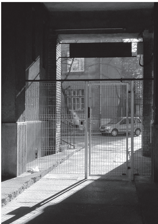
6. kép. Rácsos kapu az egyik gyalogos bejáratnál

A holisztikus védelem ezen következményei mellett külön szeretnék kitérni a teremépület négy festményének problémájára. A képek, amelyek a vállalat társüzemeit ábrázolják, az eredeti berendezéshez tartoztak, és jelenleg is a kamarateremben található. 89 A Népművelési Minisztérium Múzeumi Főosztálya 1954-ben műszaki emlék kategóriába sorolta a festményeket, 90 amelyek ugyan megőrzésre kerültek, de láthatóságukat tulajdonosuk nem tudja biztosítani, kettő közülük ma is gipszkarton fal takarásában van. 91 Bár az intézményes védelem itt is korlátozottan tud érvényesülni, a Nyizsnyij Tagil Kartában is megjelenő visszafordíthatóság elve azonban érvényesül, hiszen a festmények eredeti helyükön találhatóak.