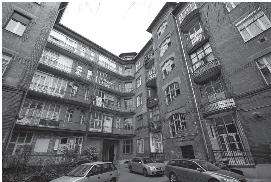
3. kép. Az eltérő beépítések a belső udvarról (Balogh Marcell 2017)