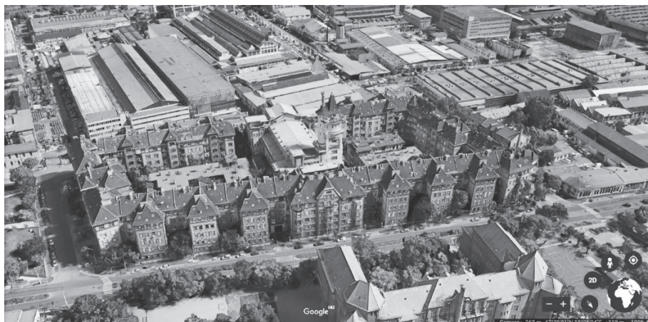
1. kép. A kolónia felülnézetből, mögötte az egykori gyártelep, 2019

örökség fogalma mind a tudomány és a politika, mind a hétköznapi szóhasználatában. 2 A műemléki szemléletet azonban ez sem szorította ki teljesen, több szempontból egymás mellett éltek tovább, bár az örökségdiskurzus sokkal nagyobb területet fogott és fog át. A bővülés egyrészt térbeli volt, hiszen egyre szélesebb környezetre kezdtek el figyelni egy-egy műemlék kapcsán, mígnem egész városrészek, tájak váltak védetté, kulturális és társadalmi vonatkozásaikkal együtt. 3 Másrészt az időbeliség is tágabb értelmezési teret nyert: egyre „fiatalabb” értékek kaphattak helyet a védettségi listákon. Az épített környezet mellé pedig felsorakoztak mindazok a szellemi tartalmak is, amelyek a múlt egy-egy darabját a maguk valóságában tudják megragadni. Az örökségfogalom berobbant a köztudatba, mindez pedig együtt járt a múlthoz való viszony megváltozásával is.