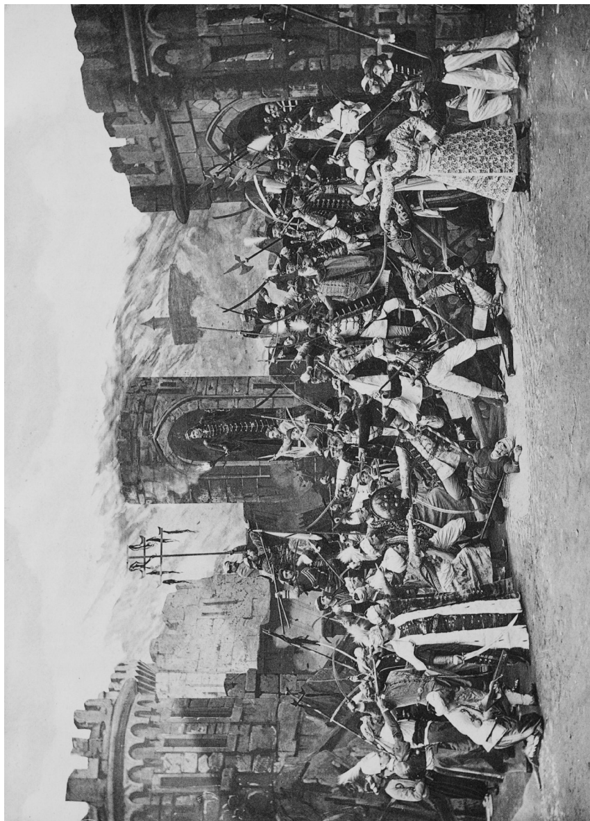
2. kép. Zrínyi kirohánása (Hégyesy 1892)