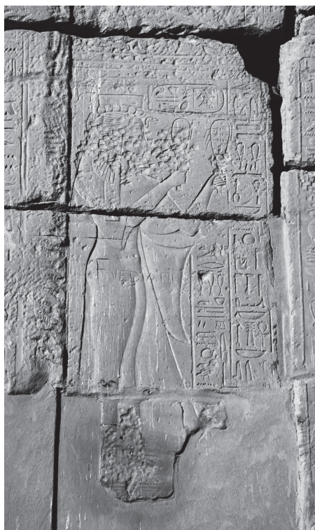
1. kép. Henuttaui ábrázolása a karnaki Honszu-templom pülönjának nyugati tornyán, második regiszter.