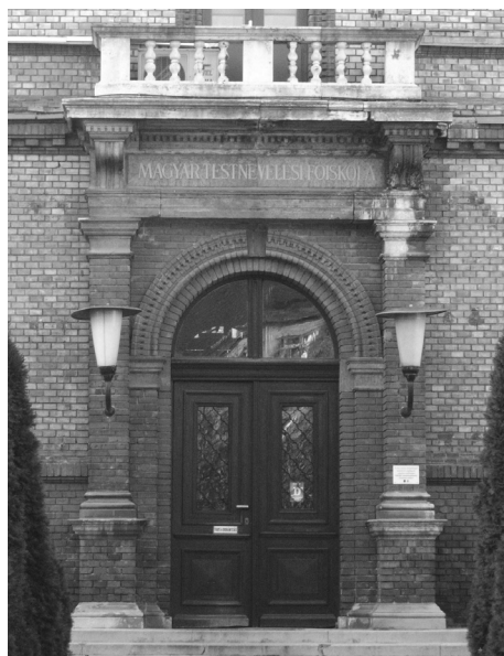
Az 1884-ben emelt egykori Pedagógium, később Polgári Iskolai Tanárképző Intézet épületének Győri úti főbejárata. Ebben az épületben kezdte meg működését 1925 őszén a Testnevelési Főiskola

Másként fogalmazva, intézményi történeti hatásvizsgálat keretében arra a kérdésre keressük a választ, hogy honnan rekrutálódott a TF diáksága? A forrásadottságok miatt elsősorban az intézménybe való belépés csoport- vagy státussajátos mechanizmusait, az