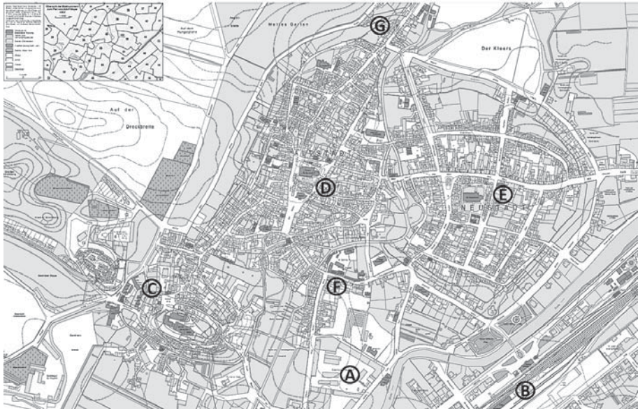
b) Quedlinburg 1902-ben (részlet)