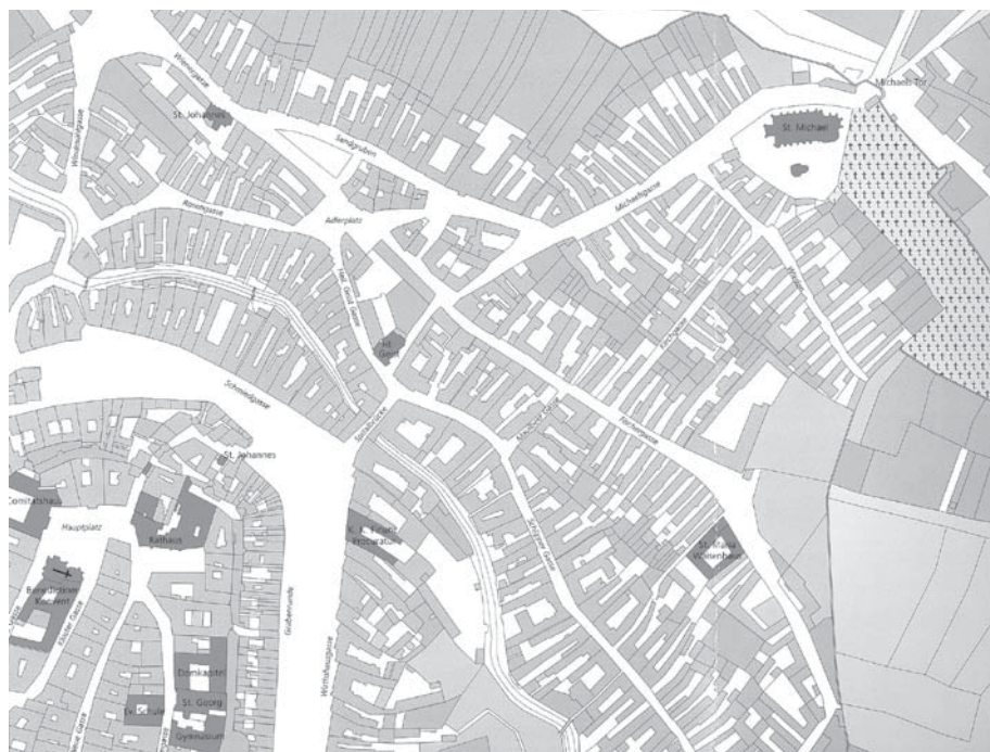
a) Sopron/Ódenburg 1856-ban (részlet) A Magyar Várostörténeti Atlasz 1. kiadványából (Sopron, A.1 tábla)