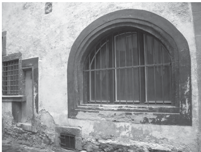
Egy középkori budai kalmárbolt ablaka – Anna utca 2.

A piactéren további szakboltok várták a vevőket. Ahogyan korábban már utaltunk rá, a városházával szemközt, a tér keleti házainak (a mai Tárnok utca keleti oldalának) földszintjein a 15. században patikák működtek. 35 Elhelyezkedésük miatt (a plébánia közelségében) a lelki gyógyulást keresők számára a testi gyógyulás lehetőségét is könnyen elérhetővé tették. A patikák sorában ( in serie apothecariorum ) álló házak valójában egyszerű városi polgárházak voltak, melyeknek földszinti bolthelyiségeit gyógyszerkészítő műhelynek és árusítóhelynek használták. E földszinti épületrészek a városi házak és a boltok jellegzetességeit egyaránt magukon hordozták: kapualjukban díszes ülőfülkék álltak, utcai homlokzatukon azonban árukiadó boltablak és kisméretű ajtó nyílt. 36 Nincs rá adatunk, hogy a patikába bemehetett-e a vásárló, vagy itt is csak az ablakon keresztül kaphatta meg a kért készítményt, ám lehetséges, hogy mindkét eset előfordult. A 16. század elejéről egy kalandos történet maradt ránk: amikor egy csetepaté során egy férfi a piactérről az egyik patikába menekült, a bent dolgozók elreztelték az ajtót, így a férfi megmenekült az őt üldöző fegyveresek elől. 37 A forrásokból azt is tudjuk, hogy egyedül