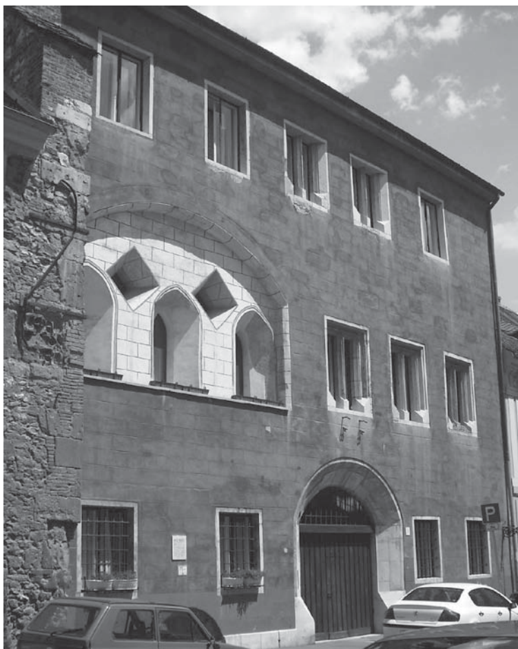
Egy középkori budai városi palota – Úri utca 31.