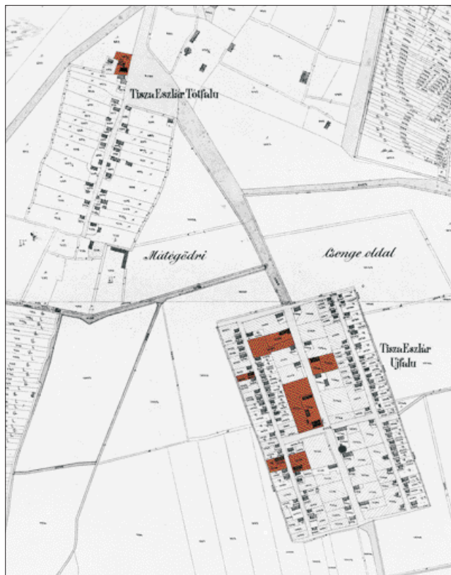
3. térkép Tiszaeszlár- Tótfalu és Újfalu zsidó telekbirtokosai (1870)