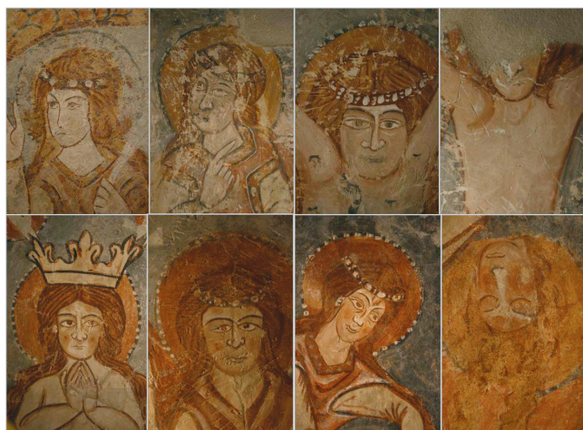
15. kép. Antiochiai Szent Margit arca a falkép különböző jelenetein.