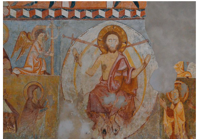
19. kép. Utolsó ítélet: az ítéletet osztó Krisztus.

az orron és a szemöldök fölötti részen kívül a nyakon, valamint a száj és orr közötti részen is. Az utolsó jeleneten a levágott fejen az egész orr, a szemöldök fölötti részt is összekapcsolva, fehér. Ezen az arcon is két vörös folt van a homlokon (15. kép).