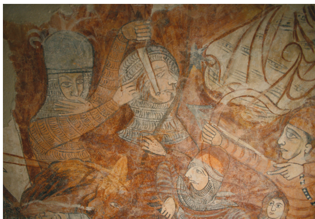
5. kép. Szent László legenda: katonák harca.

Erre kerültek feketével a körvonalak, végül pedig az orron és a homlokon a szemöldök felett, fehérrel a csúcshétyek. Ennek feltehetően az lehet az oka, hogy e jelenetnél a vörös háttérrel könnyebb volt elfedni világos okkeres fedőfestékkel, mint fehérrel, ami alól átlátszott volna a vörös intenzív színe. A fehér csúcshétyek sokszor csak nagyon lazúrosan jelennek meg. A lovak testszínét körkörös szürke és fehér foltokból alakították ki. Az utolsó rétegek sok helyen lemez-szerűen leváltak a felületről pl. az arcok, kezek, vagy lovak részletei, ez arra enged következtetni, hogy megfestésükkor a vakolat eléggé száraz lehetett (5-8. kép).