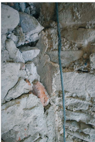
24. kép. A torony támpillérenek takarásában lévő falkép-töredék. (Kiss Lóránd felvétele).