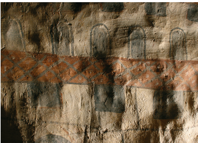
2. kép. Szent László legenda: a váradi vár, súrlófényben készült felvétel.

Az északi oldalon ábrázolt alakok arcának festése eltérést mutat az eddig bemutatottakéhoz képest. Az Ütközet jelenetén az arcok alárajza szintén vörös, alapszínük azonban nem fehér vagy rózsaszín, hanem világos okker.