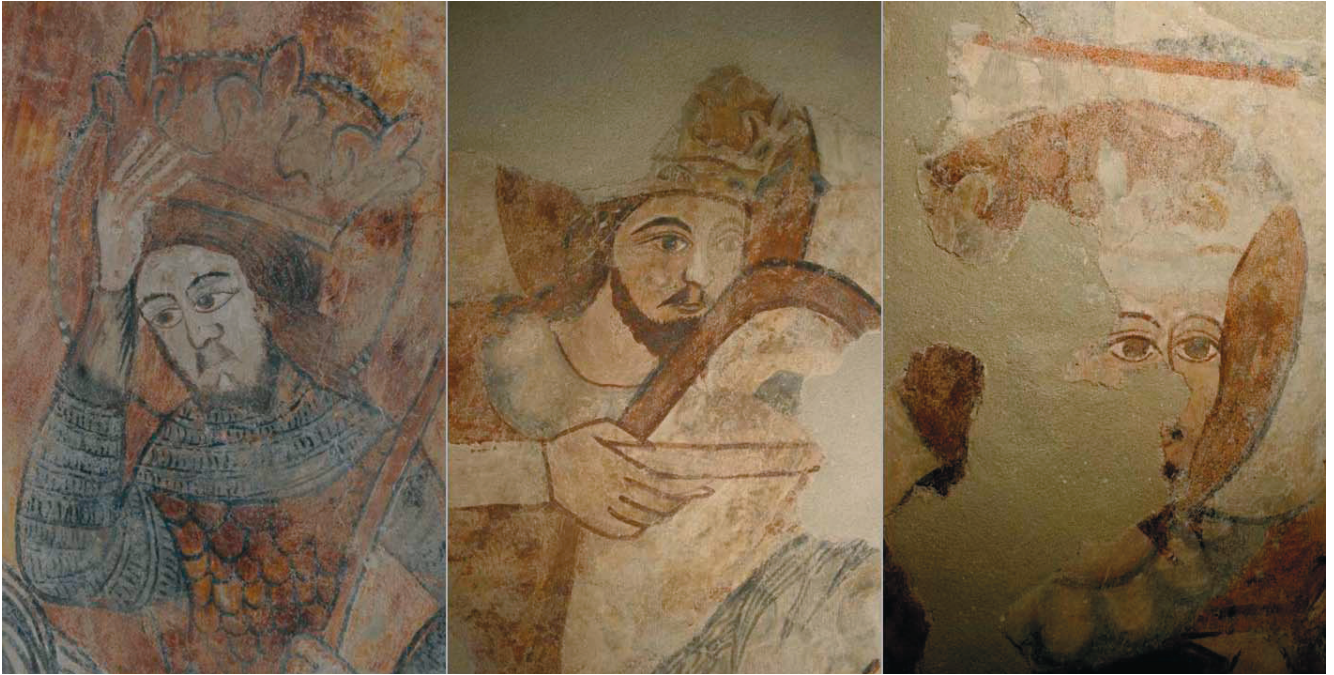
9. kép. Szent László legenda: Szent László arca a falfestmény különböző jelenetein.

az érzetet keltik, mintha csak egymásra helyezték volna őket. Az első jeleneten a vár minden ablaka, minden tornya teljesen szemből látható. A másodikon a látóhatárt a vörös és a szürke szín találkozása jelzi. A többi jeleneten töredékességük miatt a háttérből csak vörös, vagy világos krémszín látható. A Párviadal háttérébe fákat is festettek, de ezek inkább csak díszletszerűek. Az arcokat világos színnel kifestették, majd egy hangsúlyosabbal jelölték az arcélet, a szemeket, a szájat, az orrot és a haj hullámoságát. Ugyan egy-egy arcon megjelenik a domború részen a csúcspont, némelyiken erőteljesebben, másokon kevésbé, de ennek ellenére összehatásukban síkszerűek. A ruházatnál szintén egy alapszintet használtak, mellyel kitöltötték a kívánt formát, majd vörössel vagy feketével meghúzták a redők vonalait, esetleg mintával díszítették azokat. Ezek a részek sem plasztikus hatásúak.