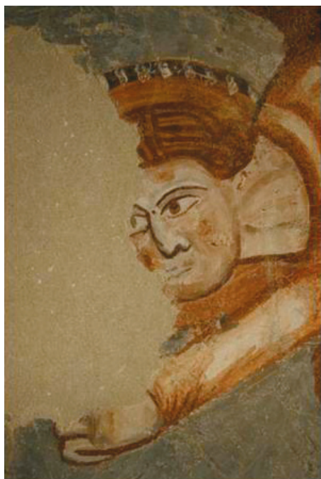
13. kép. Antiochiai Szent Margit legendája: angyal arca.

A vakolat felületét előkészítették a festésre, simították, de nem törekedtek eltüntetni a falazat egyenetlenségeit. A képmezőket, az alakok formáit, a glóriákat itt sem karcolták bele a vakolatba. Nem igyekeztek a határvonalat nyomtalanul elsimítani a két egymás feletti regiszter találkozásánál.