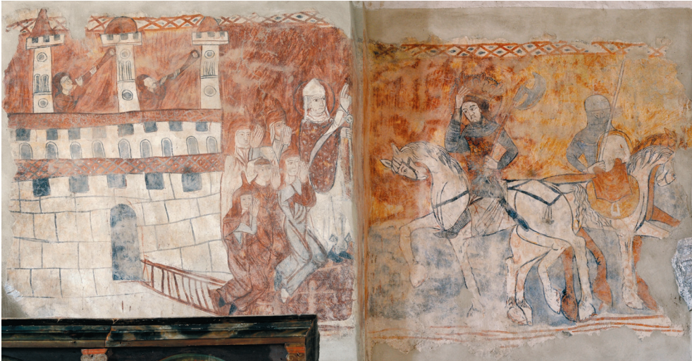
1. kép. Szent László legenda: indítójelenet. Nyugati oldal.

A közvetlenül mellette húzódóé, mely szintén a nyugati oldalon van, 200×200 cm (1. kép). Az északi oldalon végigfutó falkép-töredékek legmagasabb pontja nem maradt meg az ablakig. Az ablak jobboldalán, a Párviadal jelenetét keretező fenti díszítősáv felső szélé megegyezik a nyugati falon lévő falképek magasságával.