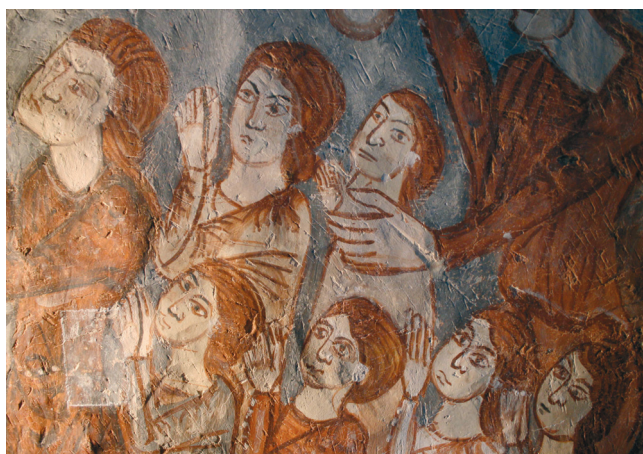
14. kép. Antiochiai Szent Margit legendája: imádkozó, megtért hívék.

Az utolsó felvakolt szakasz két jelenetén Szent Margit arcát két különböző kéz festhette, és eltérést mutat az előtte lévő részekben megjelenítettekhez képest is. Míg a részletgazdagon kivitelezett arcok jellemzői az arcon és a homlokon a két foltként megjelenő arcpír és a színárnyalatok közötti finom átmenet, addig ez egy alapszínnel kifestett arc, melynek két oldalán két piros folt látható, a homlok összeráncolt, haragos ábrázatú. A csúcsfény megjelenik