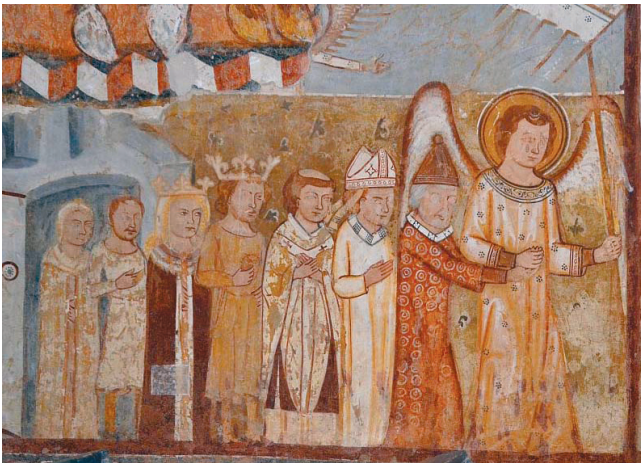
17. kép. Utolsó ítélet: az üdvözültek menete