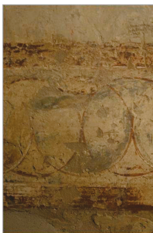
22. kép. Utolsó ítélet: a regiszter alsó, záró díszítősávja. Retusálás előtti állapot.

hanem az arcuk megjelenítése is különböző. Jézus, az angyalok és az apostolok arca a legkidolgozottabb.