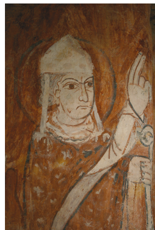
3. kép. Szent László legenda: a sereget megáldó püspök.