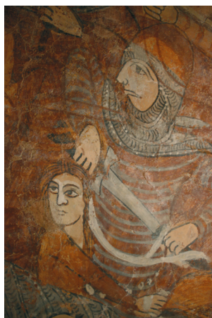
6. kép. Szent László legenda: a kun és az elrabolt leány.

ülnek egymáshoz. Glóriájának körvonalát szabadkézzel húzták meg. A nyugati oldalon Szent László vörös sodronyíngben jelenik meg a lován és nem visel palástot a hátán. Az északi oldalon az ablak két oldalán lévő jeleneteken vörös palásttal láthatjuk, melynek gallérját, valamint belsejét fehér-szürke mintás szőrme borítja.