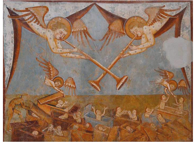
18. kép. Utolsó ítélet: feltámadás.