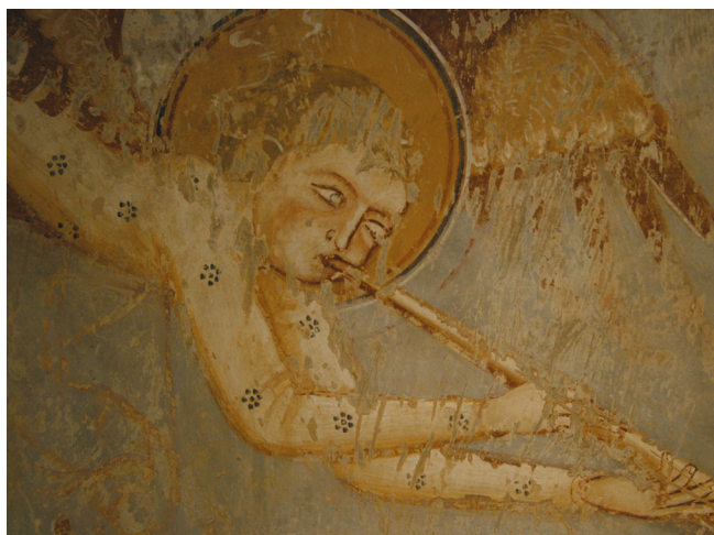
20. kép. Utolsó ítélet: harsonát fújó angyal. Retusálás előtti állapot.

A sérült arcokon helyenként előtűnik a háttér szürkéje, nem hagyták ki azokat a területeket, ahová a figurák kerültek, hanem egységesen kifestették szürkével az egész hátteret, függetlenül attól, hogy korábban már felvázolták a kompozíciót. Az alakok részletei sok helyen lemezesen elváltak a felülettől. A sírokat felnyitó angyalok haja és szárnyaik hosszú tollai szinte teljesen lekoptak (20. kép). Ezeket festették meg a legutoljára. Ez arra enged következtetni, hogy már itt is száraz lehetett a vakolat, amikor az utolsó részeket kidolgozásra kerültek. Az angyalok fejét körülvevő okkersárga glórián kiemelkedően jelentkező az arcok világos színei, a megkopott haj csak nyomokban észlelhető.