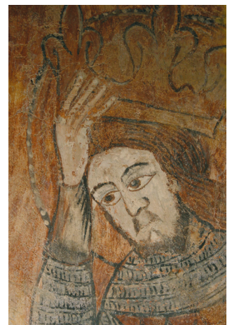
4. kép. Szent László arca.