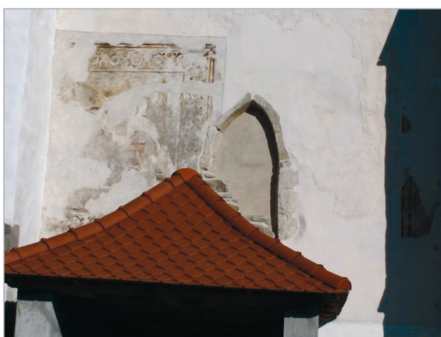
23. kép. A déli bejárat felett feltárt falkép-töredékek. (Mednyánszky Zsolt felvétele).

Az Utolsó ítélet angyalainak és szentjeinek glóriái minden jeleneten egyformák. Kivételt képez az ítélő Krisztus balján térdeplő Szent Jánosé és a mellette álló szárnyas angyalé. Az összes dicsfény megformálásakor körzőt használtak, de a fejek töredékessége miatt annak leszűrési helye már nem található meg. A körvonalak nincsenek belekarcolva a vakolatba, tehát nem hegyes végű körzőt, hanem egy körzőre erősített ecsetet használtak. A két említetten kívül, a következőképpen festették a glóriákat: okkersárga színnel kitöltötték a megrajzolt dicsfény felületét, majd három különböző színű csíkkal körberajzolták. A fejhez a legközelebb álló sötétvörös, a középső fekete, a legkülső pedig fehér. Krisztus glóriájában sötétvörös kereszt is látható. Ezekkel ellentétben János dicsfénye sokkal árnyaltabb, olyan mintha egymásra festett dupla glóriája lenne (21. kép). A glória alapszíne itt is okkersárga. A kör külső peremétől befelé haladva egy fekete és egy sötétvörös körvonal látható. Ezeket egy fehér csík követi, melyből kis világos sugarak nyúlnak a kör széle felé. Innen az arc felé közeledve a glória alapszíne a sötétvörösből a világos okkersárga felé halad.