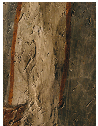
10-12. kép. Antiochiai Szent Margit legendája: állványszint, súrlófényben készült felvétel.