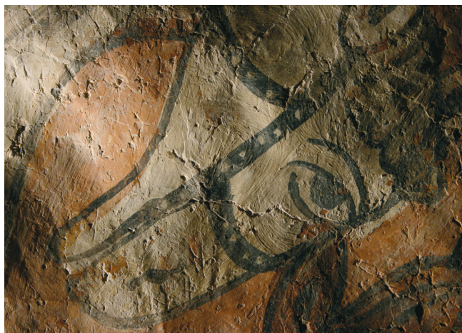
8. kép. Szent László legenda: lófej, súrlófényben készült felvétel.

A térhatás érzékeltetésére nem törekedtek. Az imádkozó alakok, álló vagy viaskodó lovak, harcoló katonák ugyan egymás mögött jelennek meg, de inkább azt