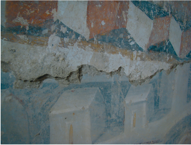
16. kép. Utolsó ítélet: indító jelenet: az alsó és a felső regiszter festett vakolatának találkozása.