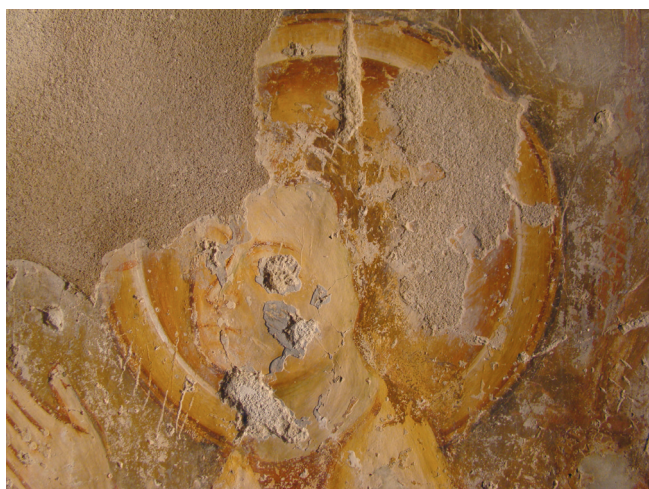
21. kép. Utolsó ítélet: Szent János arca.

Az alakok méretbeli különbsége rangsorolásukra utal. Már a falkép-sort indító jeleneten találkozunk ezzel az ábrázolásmóddal. Az üdvözülteket vezető szárnyas angyal a legnagyobb, őt egyre kisebb alakok követik. Az Utolsó ítélet középpontjába a falkép-szalag teljes magasságát elfoglaló Krisztus került. A figuráknak nemcsak a mérete