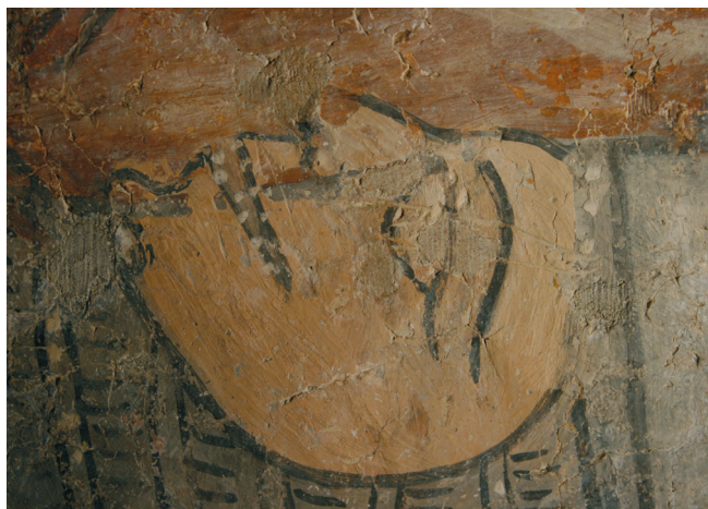
7. kép. Szent László legenda: harcos arca.

Az ablak túloldalán lévő töredékeken Szent László arcát szintén más kéz hozta létre. Koronája kopottsága és töredékessége ellenére díszessége, arca kidolgozottsága jól látható, viszont karakterében más, szemei közelebb