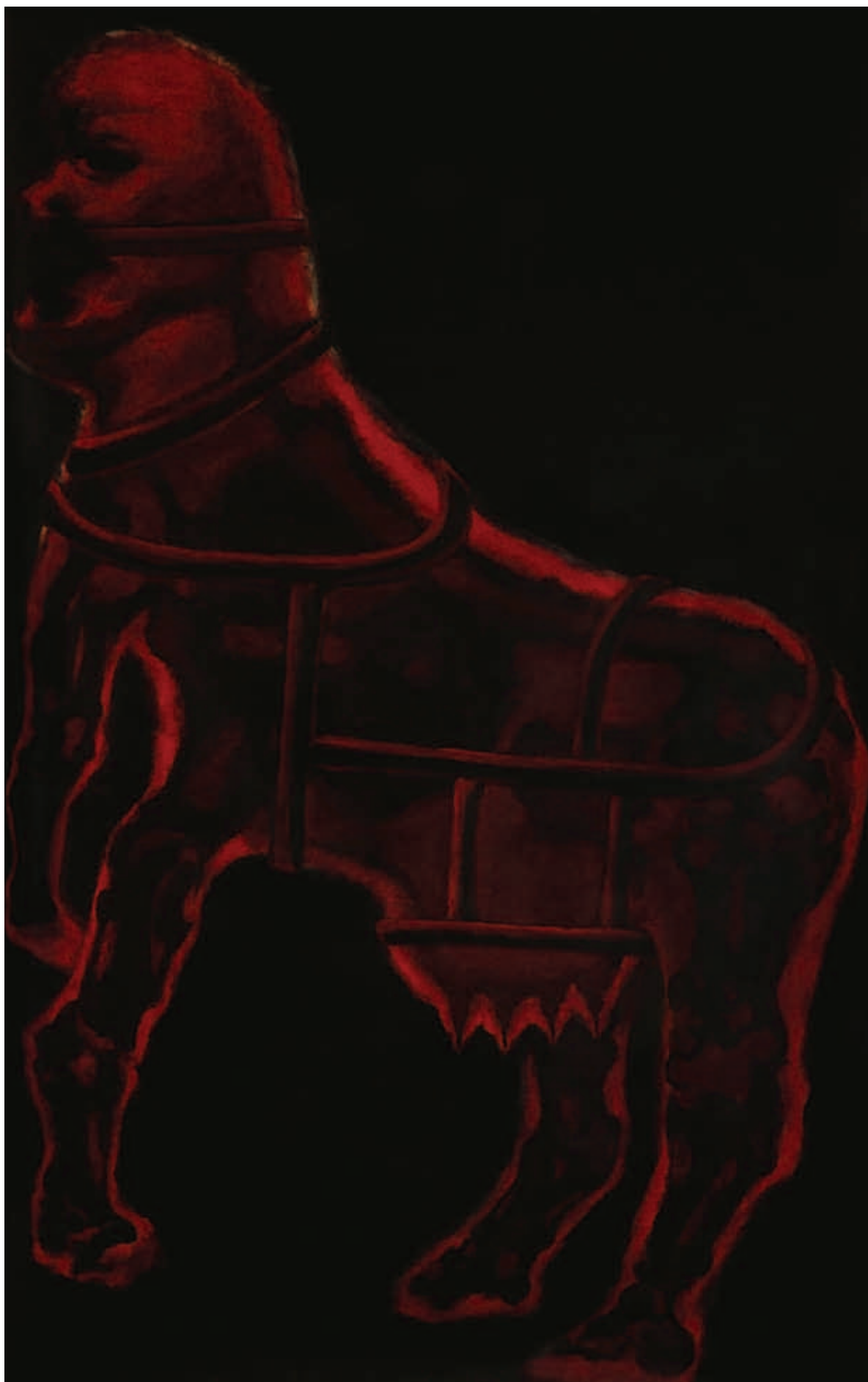
GAÁL JÓZSEF, Vezeklések kora, 2019