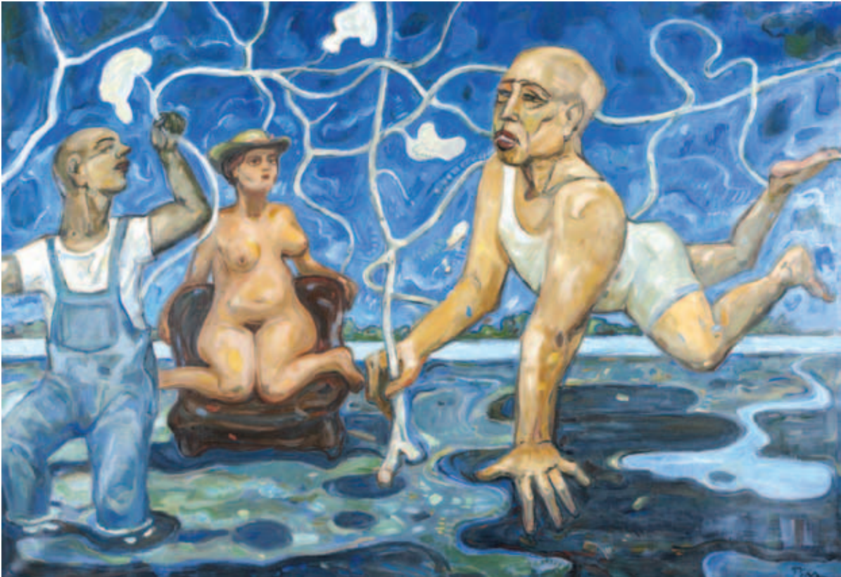
NAGY ÁRPÁD PIKA, Ingovány, 2019 (Munkajutalom)