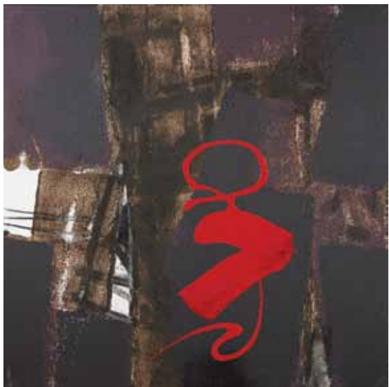
PUHA FERENC, Cím nélkül 1–9 és 11–12, 2017; Cím nélkül 10, 2016