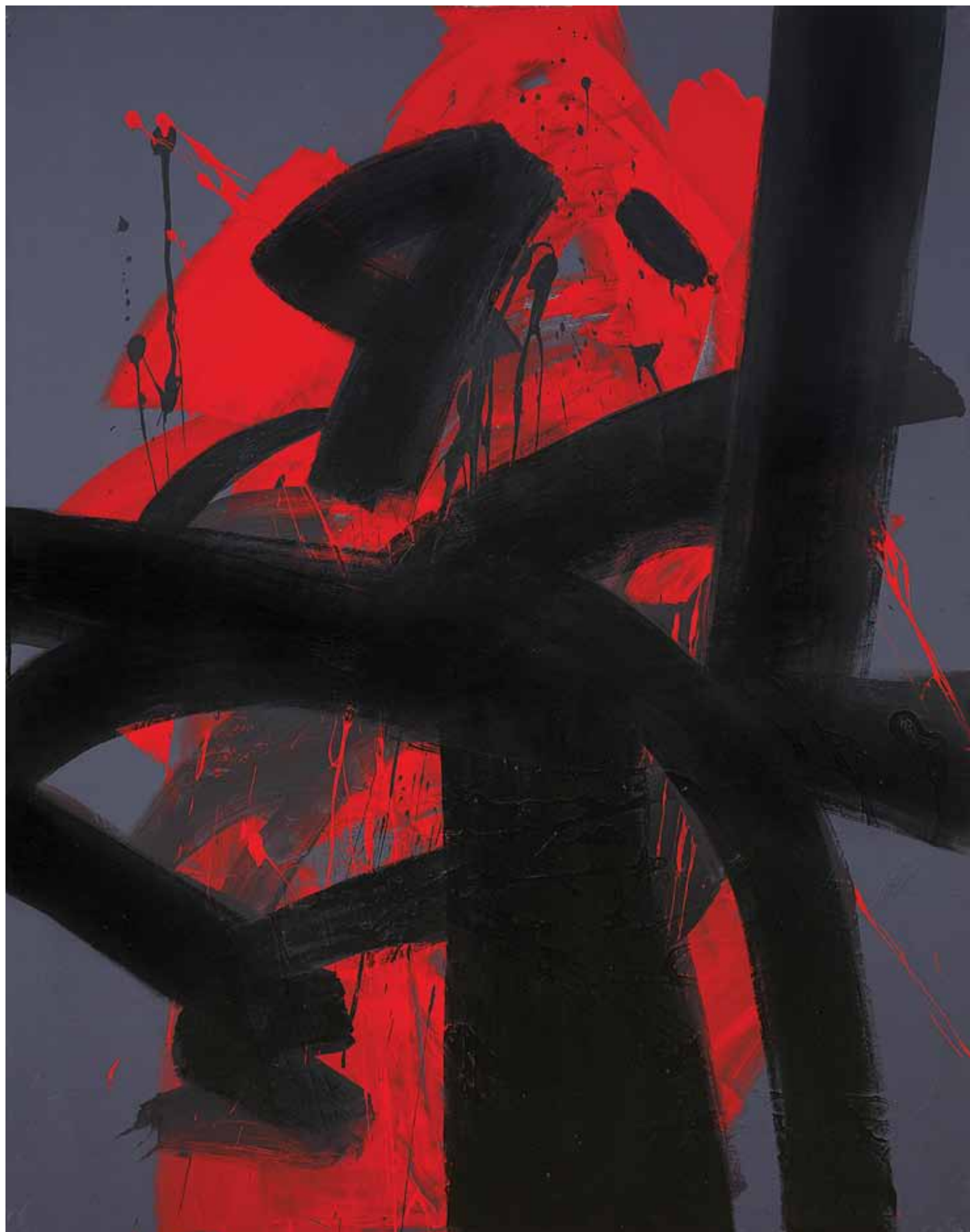
PUHA FERENC, Cím nélkül, 2017