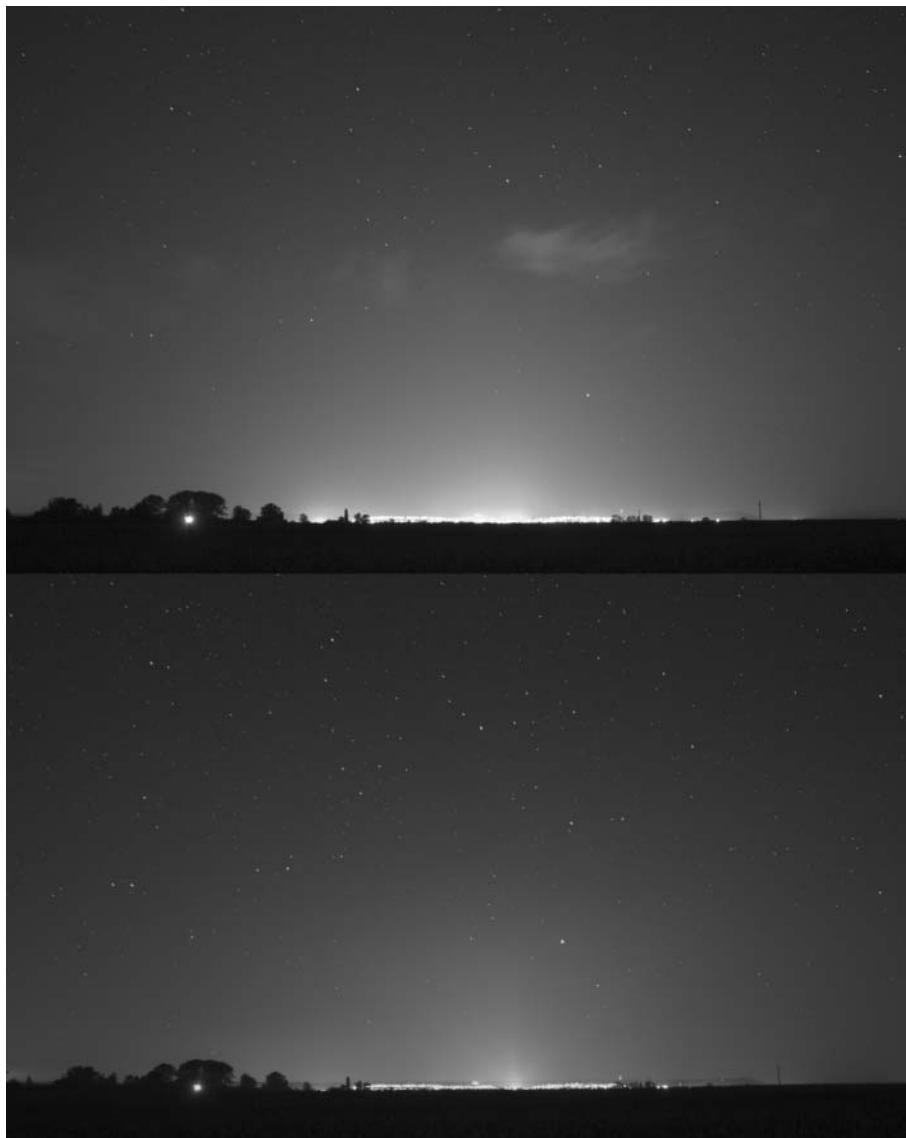
2. ábra. Szekszárd fénykupolája a világítási rekonstrukció előtt (föül) és után (alul).

et tartalmazó, de teljesen ernyőzött lámpatestekkel elérhető, hogy az égbolt szkotopos látványa ne romoljon. A számítások szerint, a fönti feltételek mellett a nátriumlámpa 6%-nyi horizont fölé irányuló fényáramát tudjuk éppen kompenzálni a jól megvalósított, teljesen ernyőzött LED-es berendezéssel, ha a fényforrás színhőmérséklete 4400 K. Ebben az esetben nem változik az égbolt éjszakai látásnak megfelelő látványa. Alacsonyabb színhőmérséklet esetén pedig javulás érhető el. Ez lenne az igazi cél!