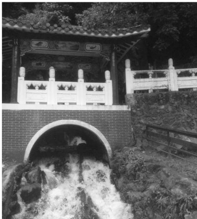
4. ábra. Templom a Taroko Nemzeti Parkban.