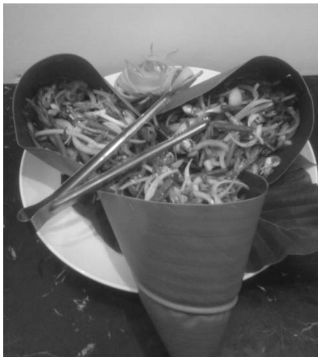
5. ábra. Egy a rengeteg tajvani ételkülönlegesség közül.

Korea a szoliton viselkedését vizsgáló kutatásukat mutatta be, Szingapúr a „hallható” fény nevű feladatra kapott eredményeit prezentálta. A svájci csapat pedig a méz csurgatásakor létrejövő mozgásokat vizsgálta.