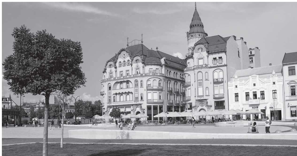
Nagyvárad, Fekete Sas palota

A TDM képzéseinek egy része már lezárult, más részük ezután kezdődik. A legnagyobb probléma azokkal van, amelyeket nem tudtak lezárni. „Mondok egy példát. Képeztünk szakácsokat, akik befejezték az elméleti részt, aztán áttértek online-ra, de nem tudtak konyhára menni gyakorolni. A képző cégek főszékhelyen nehezebben találnak olyan éttermet, amelyik gyakornokot fogad, mert most nincs ideje a főszakácsnak a zöldfülű tanítására. Nyilván vannak olyanok is, akik már ismerik