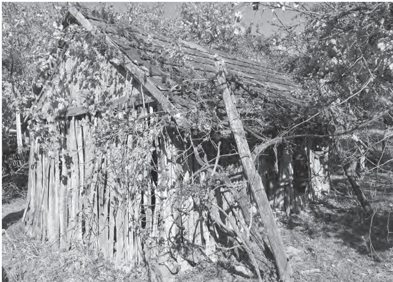
Egy ma is álló, roskatag gazdasági épület a lakatlan faluban