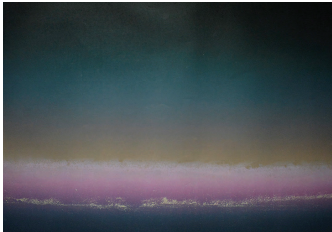
Ég 3, 2016, linó, írisznyomás