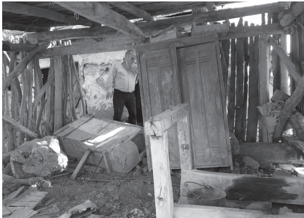
A négy éve lakatlan porta egy részlete

Amikor aziránt érdeklődöm, hogyan érezte magát azután, miután nem kellett mennie többet a kínlódjfalvi iskolába, hiányzott-e a falu, felcsillanó szemmel, széles mosollyal válaszol: „Az az időszak a legjobb része volt az életemnek! Nem lehet felmérni az akkori gyerekek szeretetét, tiszteletét a tanító nénijük iránt, nem lehet összehasonlítani azzal, ahogyan a mostaniak viselkednek... A kínlódjfalvi felnőtteket is kedveltem, nagyon békés emberek voltak, a nyolc év alatt, amíg közöttük forogódtam, egyetlen összetűzésre sem emlékszem. Nagy ivászatok, része-