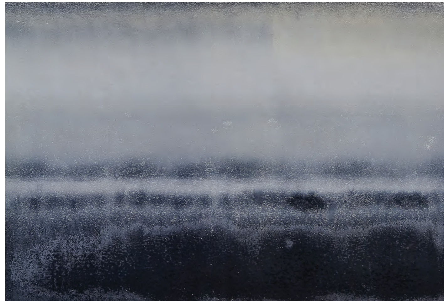
A köd impressziója, 2015, lino, írisznyomás