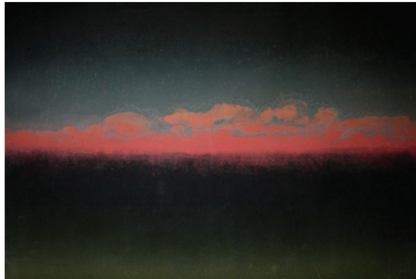
Ég 5, 2016, linó, írisznyomás