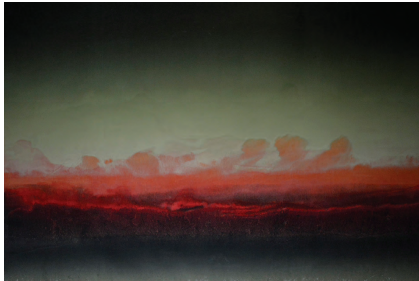
Ég 1, 2016, linó, írisznyomás, monotípiá