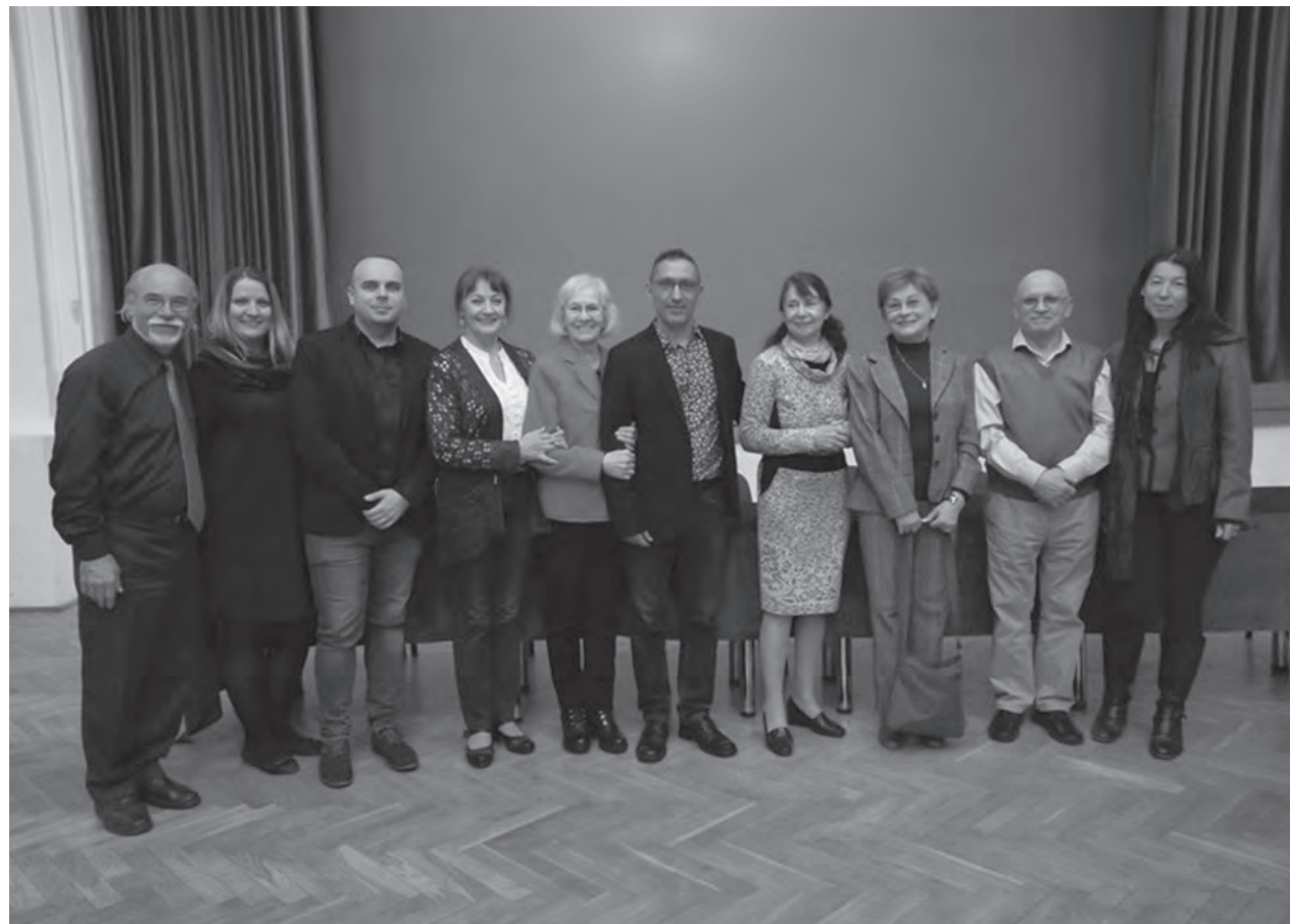
Filmvetítés után barátokkal, pályatársakkal, filmkészítőikkel