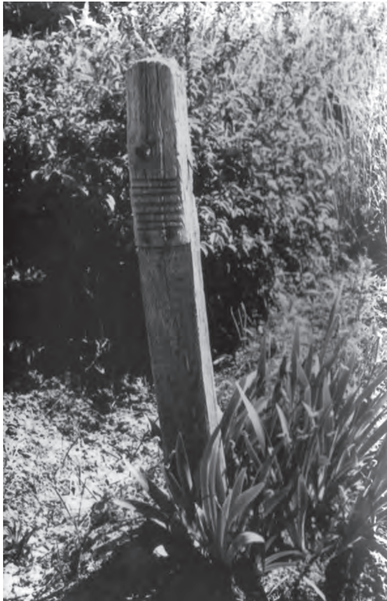
Fejfa a temetőben

Az első házba nyitunk. Három gyermek hancúrozik a tapasztott földön, a két nagyobbik felöltözve, a másfél éves körüli mezítláb, ócska kinőtt inge a derekát sem takarja el. A ház egyik sarkában nagy búbos kemence, rajta limlom,