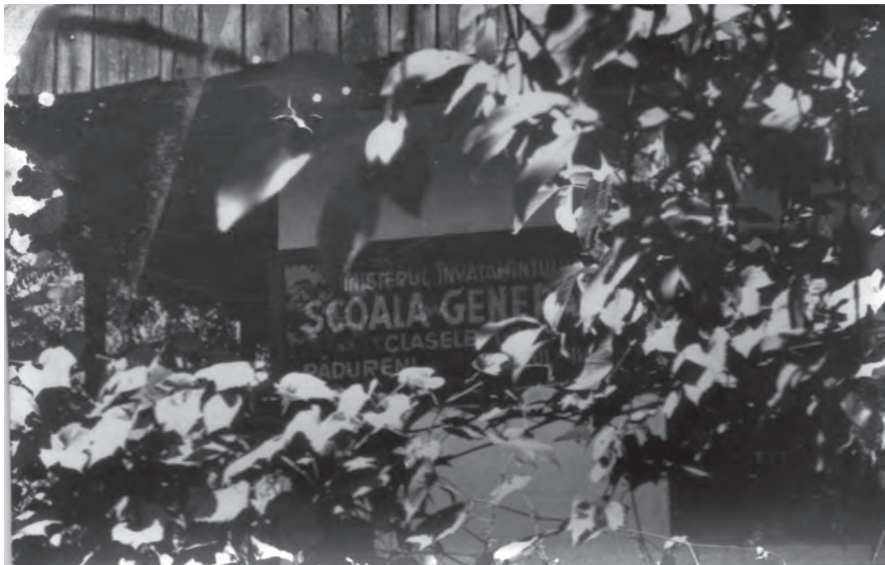
A ház, amelyben az elemi iskola működött