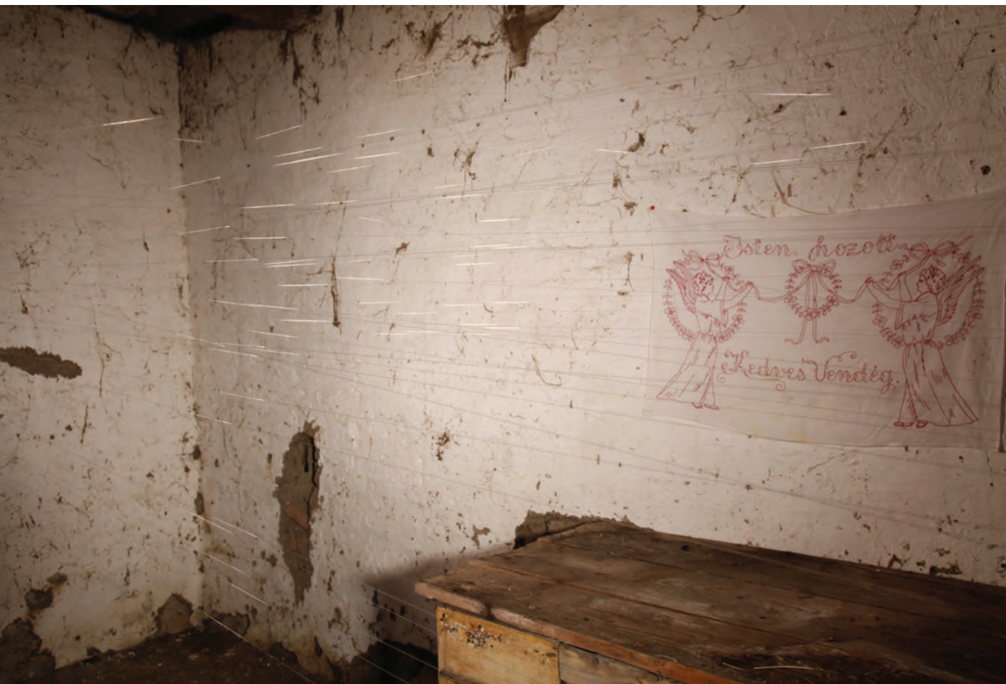
Isten hozott kedves vendég, 2016, installáció, Mezőszemere