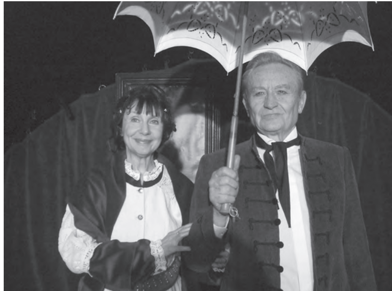
Jelenet a Széchenyi-előadásból

Mérföldkő és csodás megvalósítás volt a Kiss Stúdió Színház életében Az ember tragédiájának színrevitele. A nagylélegzetű Madách-művet Varga Vilmos 2000-ben rendezte. Rendhagyó módon nyolc szereplővel vitte színre. A premier az