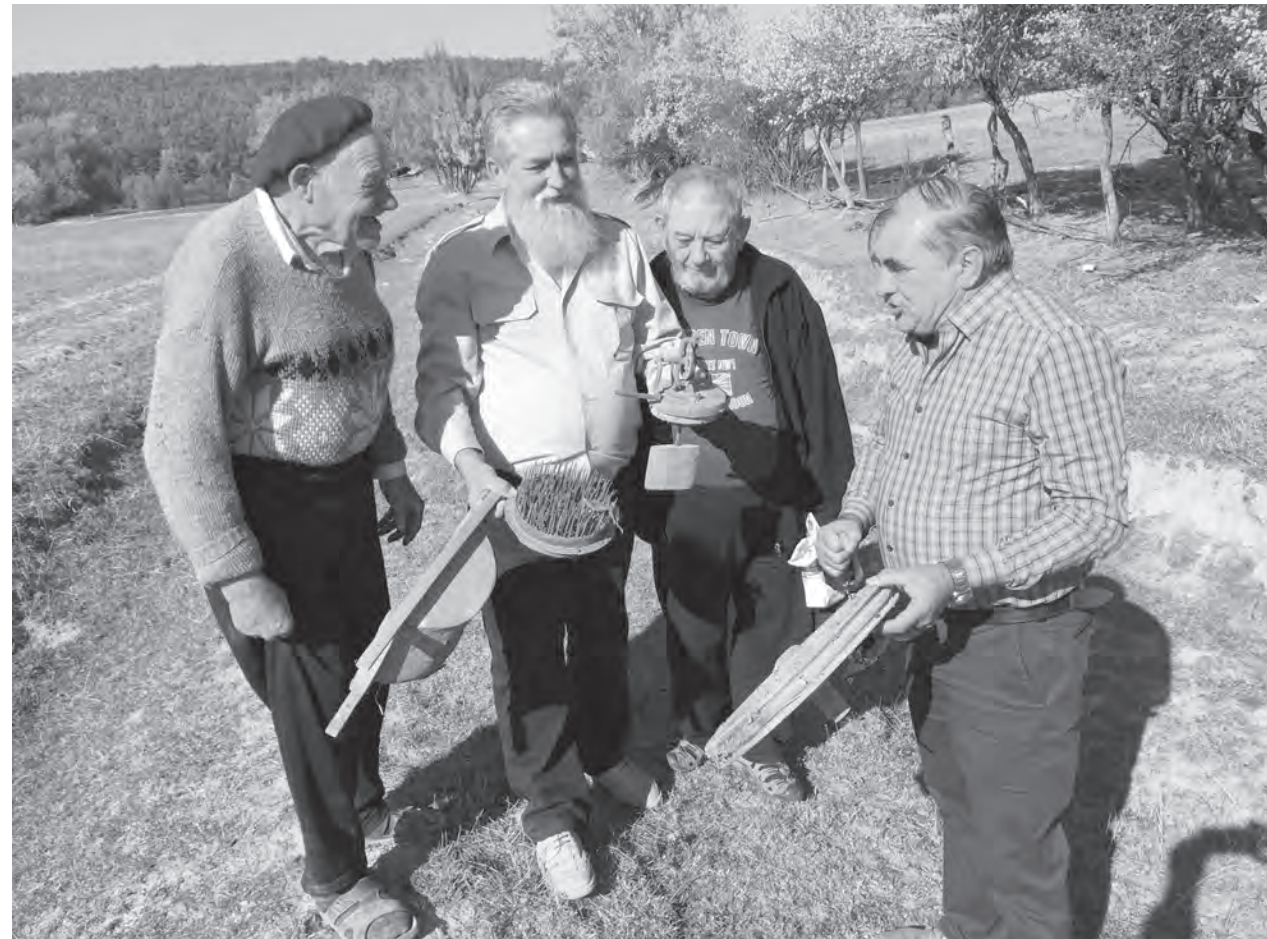
2018. őszi ottjártunk idején néhány régi eszköz is előkerült

– 1922-ben költöztünk ide, akkor már az erdő itt egy jó helyen ki volt irtva. Az erdőt 1910 körül kezdték irtani. De sokan elszakadtak a falutól. Elmentek innen. Mondták, hogy ők bizony nem kínlódnak itt egész életükben. Jól is tettek. Én kérem, mit értem vele, hogy annyit dolgoztam? Nézze, hogy nézek ki! Több mint tíz éve munkaképtelen vagyok. Hátgerincsorvadásom van. Gondolja csak meg, biz-