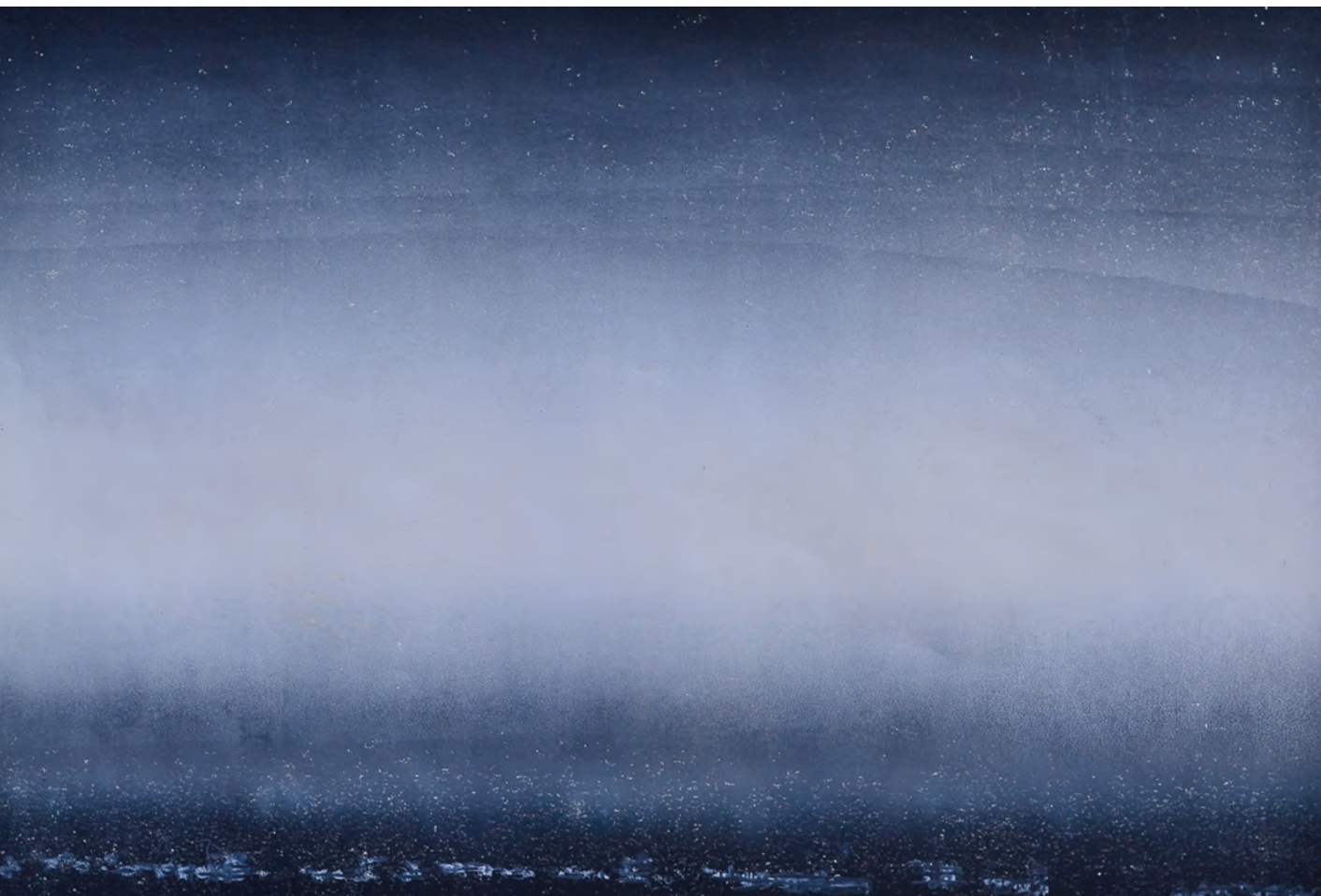
Sötétség délben, 2016, linó, írisznyomás, 60 × 90 cm