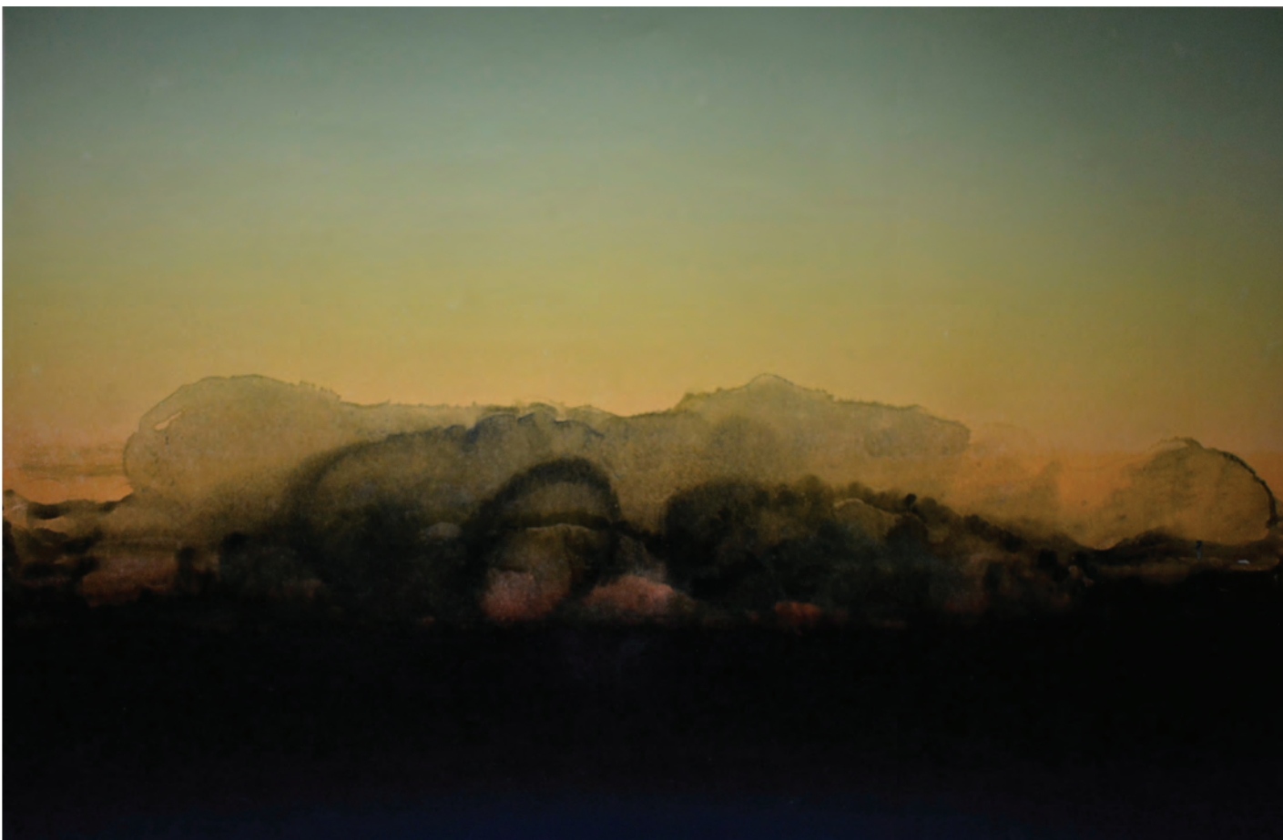
Ég 2, 2016, linó, írisznyomás