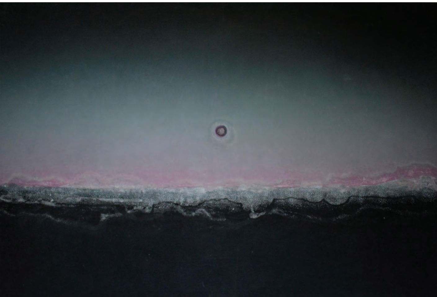
Ég 4, 2016, linó, írisznyomás