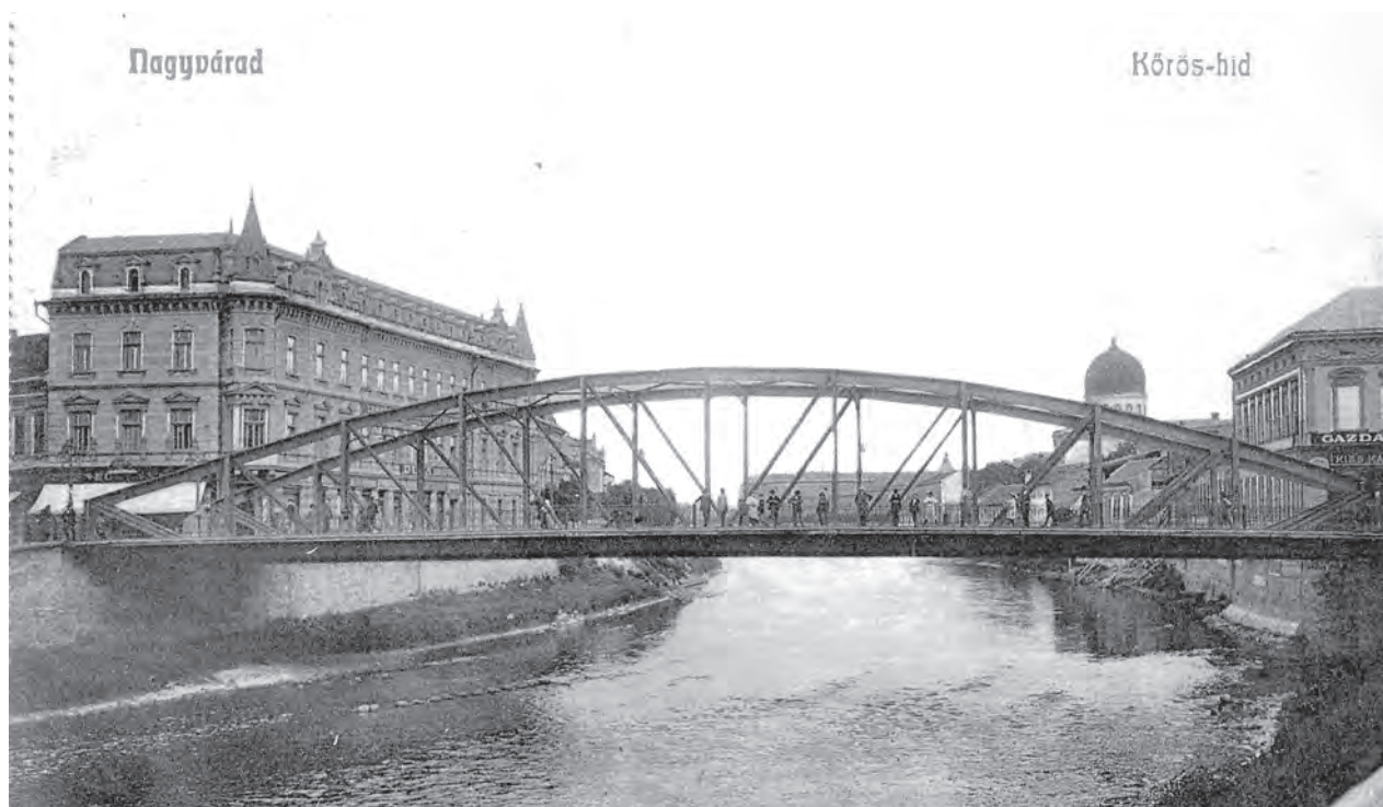
Az 1893-ban átadott vashíd

1944. október 12-én a visszavonuló német alakulatok felrobbantották a hidat, miután agyonlőtték a híd védelmére kirendelt 12 idős váradi népfelkelő honvédet, akik megtagadták a híd megsemmisítését.