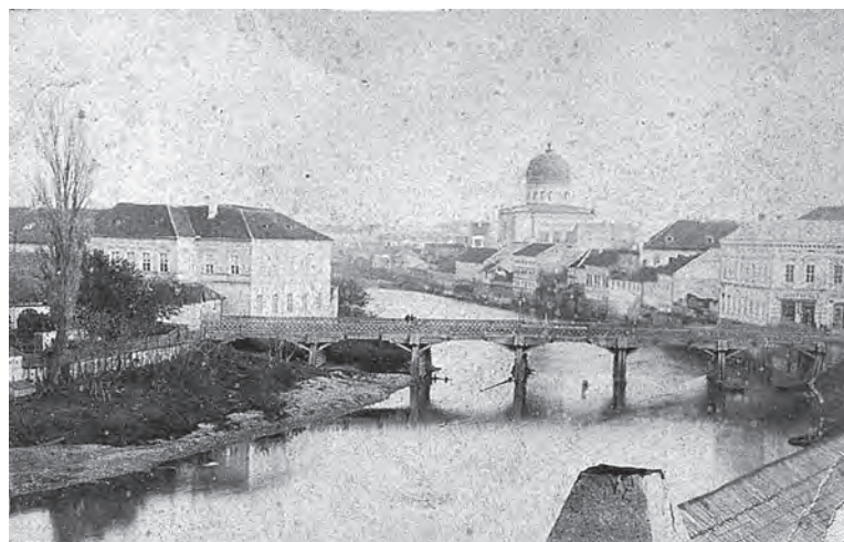
Így nézett ki a vashidat megelőző utolsó fahíd

Az egykori Kispiacot (a későbbi Szent László, mai Unirii teret) Olaszival összekötő első hidat Csáky Miklós püspök verette. A hídverés pontos időpontja nem ismeretes, de valamikor 1737–1747 között történhetett, Csáky püspöksége idején. „E híd egy új közlekedési utat nyitott, mely Újváros főterét Olaszin keresztül ennek északi kapujával a legrovi-