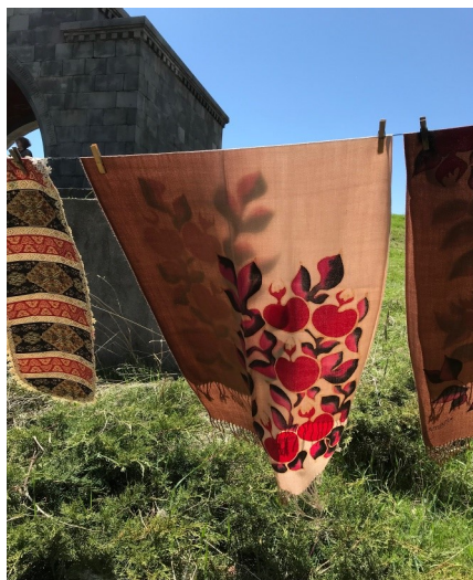
Gránátalmás kendő a divat

Szívszorító volt a Genocidium Múzeumban tett látogatásunk. Fényképek, újságcikkek, más korabeli dokumentumok mutatják be a többszöri, különösen a legkegyetlenebb, 1915-ös, másfél millió ember halálát okozó népirtást. A török hatalom végleg el akarta pusztítani az örményeket. A vallásához hű, keresztény Örményország iszlám vallású országok gyűrűjében állandó fenyegetettségben élt az erősebb, hódító hatalmaknak kiszolgáltatva. 1990-ben kikiáltotta függetlenségét, ma önálló, épülő ország, és hazáját szerető, hagyományaira büszke népe nyitott szívvel várja és fogadja az érdeklődő látogatókat.