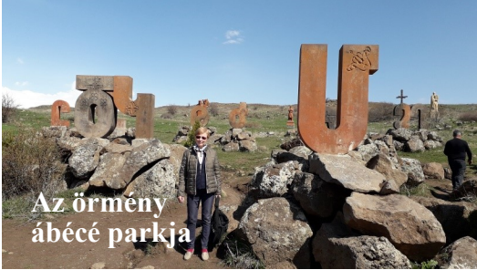
Az örmény ábécé parkja

Az örmény ábécé számokat is jelent. Misztótfalusi Kis Miklós betűi. Az örmény ábécé emlékhelye. Konyakos hordók az Ararat gyárban. Megkoszorúztuk a második világháborús magyar-örmény emlékművet.