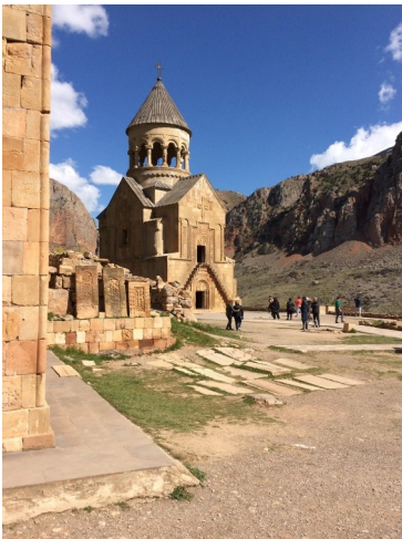
Fent: Az újraépített pogánykori szentély