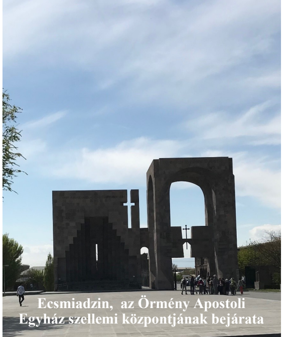
Ecsmiadzin, az Örmény Apostoli Egyház szellemi központjának bejárata