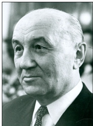
28. kép Ilku Pál (1912–1973) művelődésügyi miniszter (1958–1973)