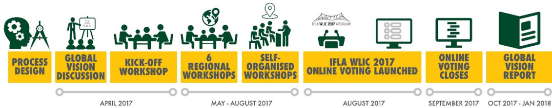
1. ábra Global Vision Roadmap I. 27