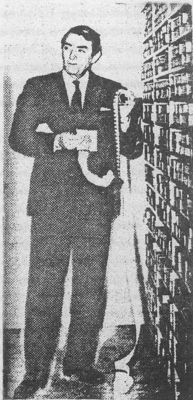
...és Gregory Peck mint konzultáns a Kongresszusi Könyvtárban

A szerzői jogi iroda beszámolója többek között a szerzői jogi törvény befejezés előtt álló reviziójának várható következményeivel foglalkozik.