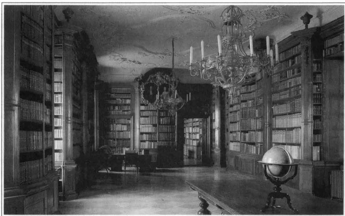
A Collegium Theresianum nagy olvasóterme

Amint a polcra kerültek a könyvek, megindult, és egy év alatt be is fejeződött katalogizálásuk. A könyvtár nyilvános volt, vasárnap, kedden és csütörtökön látgathatták az olvasók, de a tanárok igénybe vehették más napokon is. Mária Terézia 1749. augusztus 4-én meglátogatta a Teréziánumot, és megtekintette a