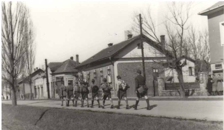
Miskolci cserkészek 1939-ben.