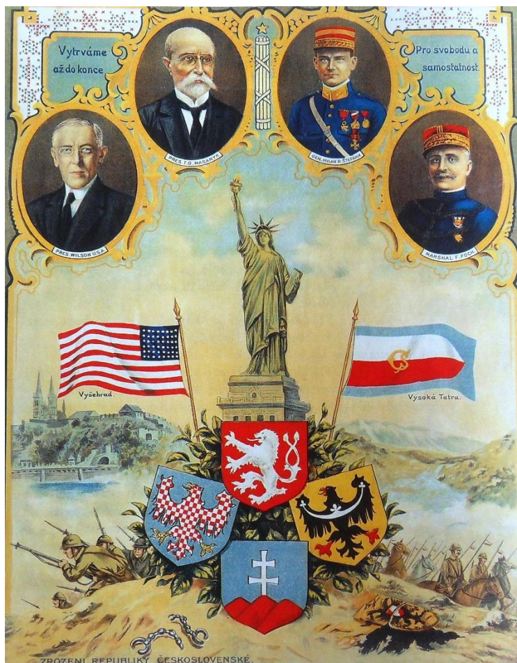
Plakát Csehszlovákia létrejötte alkalmából

Az oroszországi bolsevik forradalom Csehszlovákia megalakulására kifejtett közvetlen hatását nem lehet kimutatni levéltári dokumentumok vagy más igazolható tények alapján, és az ötvenes években is csupán egy bizonyíthatatlan hipotézisről volt szó. Az ötvenes évek történészei ezért a gyakorlatban – többé-kevésbé kényszerűen – az Osztrák–Magyar Monarchiában lezajlott