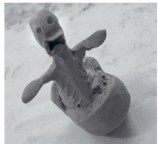
Szörny-projekt (Belvárosi Tanoda, 2003)