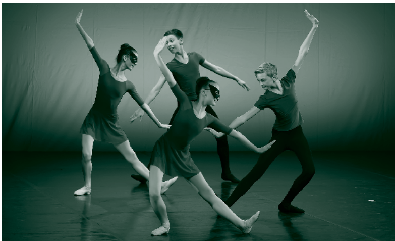
Művészképzés a Magyar Táncművészeti Egyetemen

A tanulmány a tankönyvfejlesztő program szakmai vezetőinek beszámolója. Készséggel adunk teret az elkészült tankönyvek felhasználóinak, a tankönyvek szakmai értékelésére. (A szerk.)