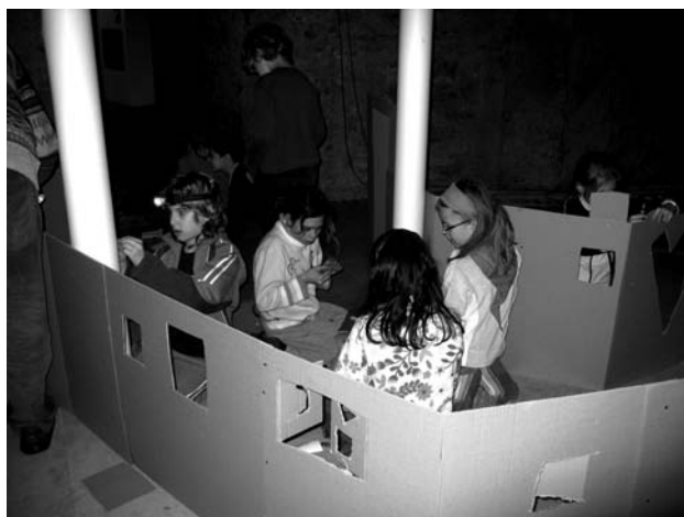
Templommakett építése a Kiscelli Múzeum templomterében (Gárdonyi Géza Általános Iskola, Budapest, XIII. kerület – 3b osztály)