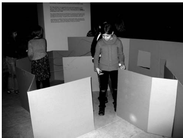
Labirintuskészítés kartonokból, zseblámpafényben (Váci Utcai Ének-Zenei Általános Iskola, Budapest, V. kerület – 3b osztály)