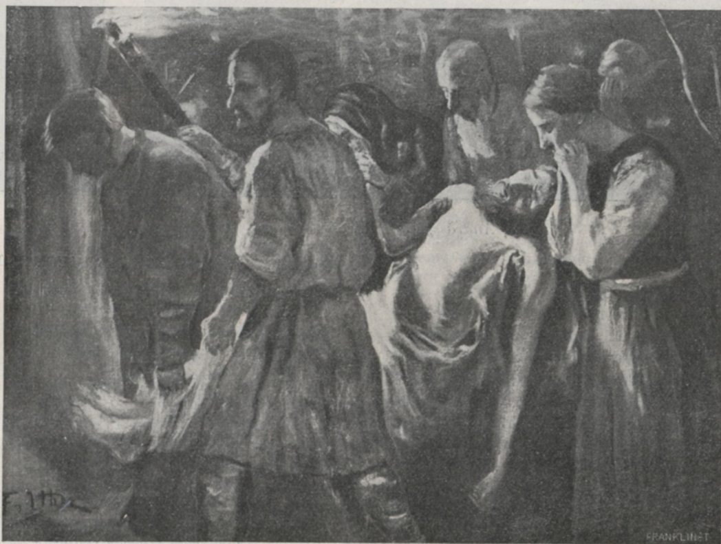
Uhde: Krisztus sírbátétele.

— Az úgy is van. Mert a szeretetnek vannak olyan csodái. A mi te neked fájna, édes fiam, az előbb az én szivemen szalad át. Ha már most én azt mondom, hogy Rozália ártatlan,