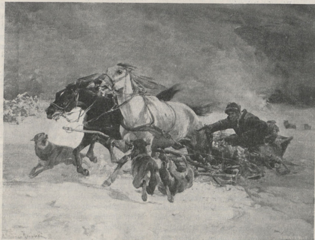
Kowalski Vierusz: Farkasoktól megtámadott postakocsi.