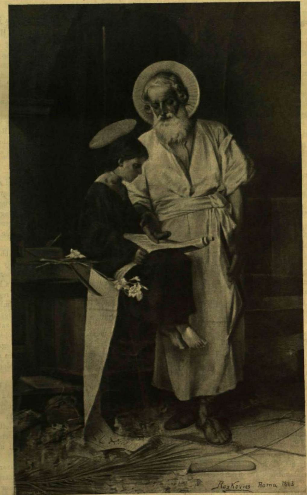
JÉZUS SZENT JÓZSEFFEL. — Roskovics Ignác oltárképe a kegyesrendiek lévai templomában.