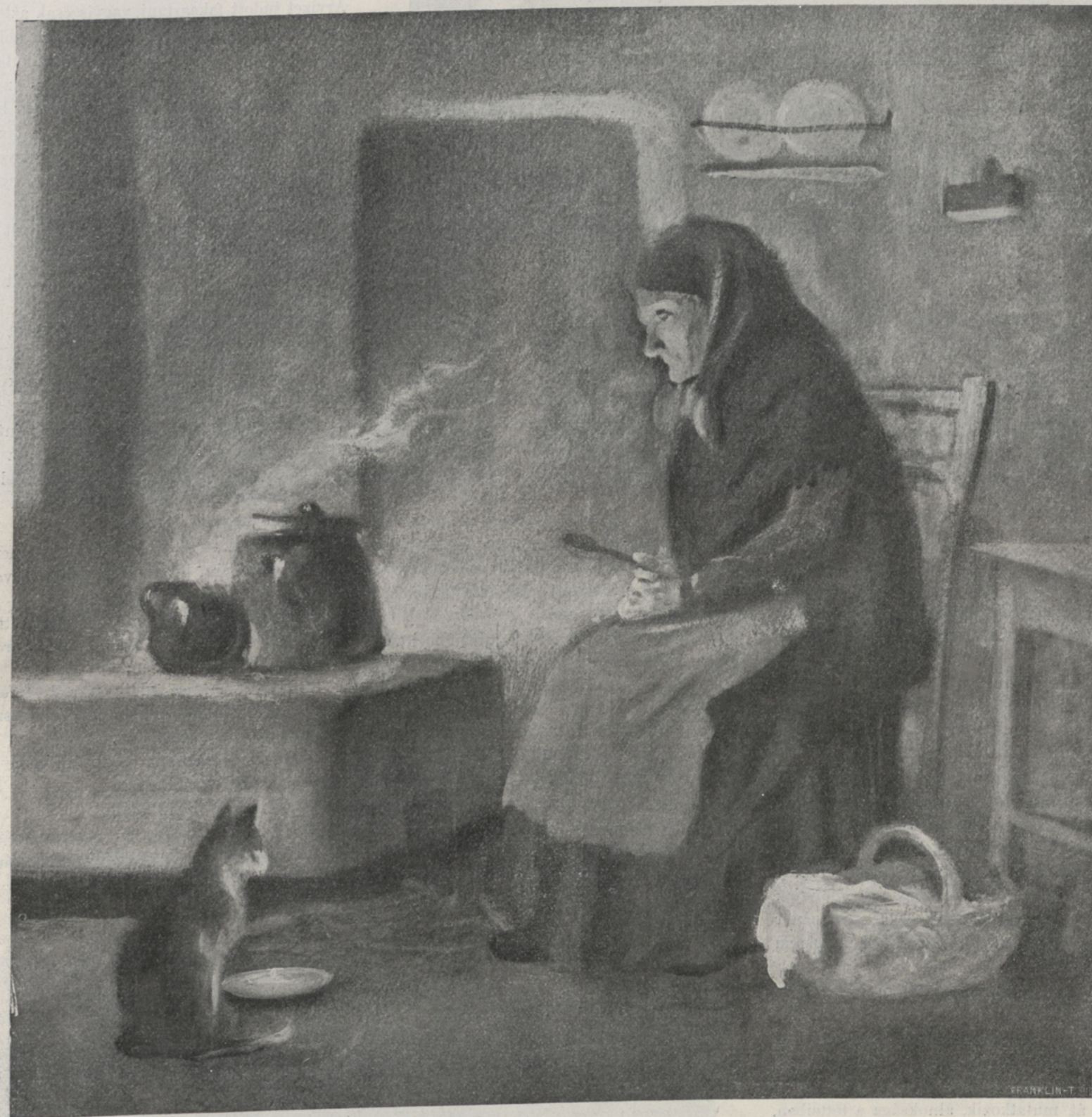
TŰZHELY MELLETT. — Gál István rajza.

— Köszönöm, édes anyám. Teljesen meg vagyok nyugtatva. A többi már engem nem is érdekel.