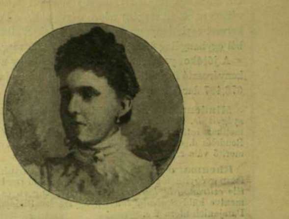
MARIA DE LAS MERCEDES ASZTURIAI HERCEGNŐ.

forrongás uralkodik. Pártok képződnek, melyek külön egyesületek alakítására vezettek. A Nemzeti Szalon lett az egyik táborhely, a másik a Képzömművészek Egyesülete, legutóbb az Országos Képzömművészeti Társulatnak is éreznie kellett a villongást.