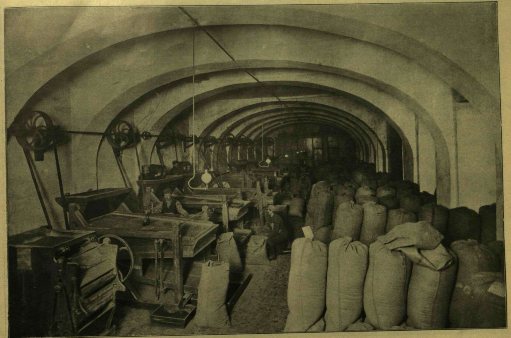
Gépcsarnok, hol a heremagvakat arankamentesítik és osztályozzák.