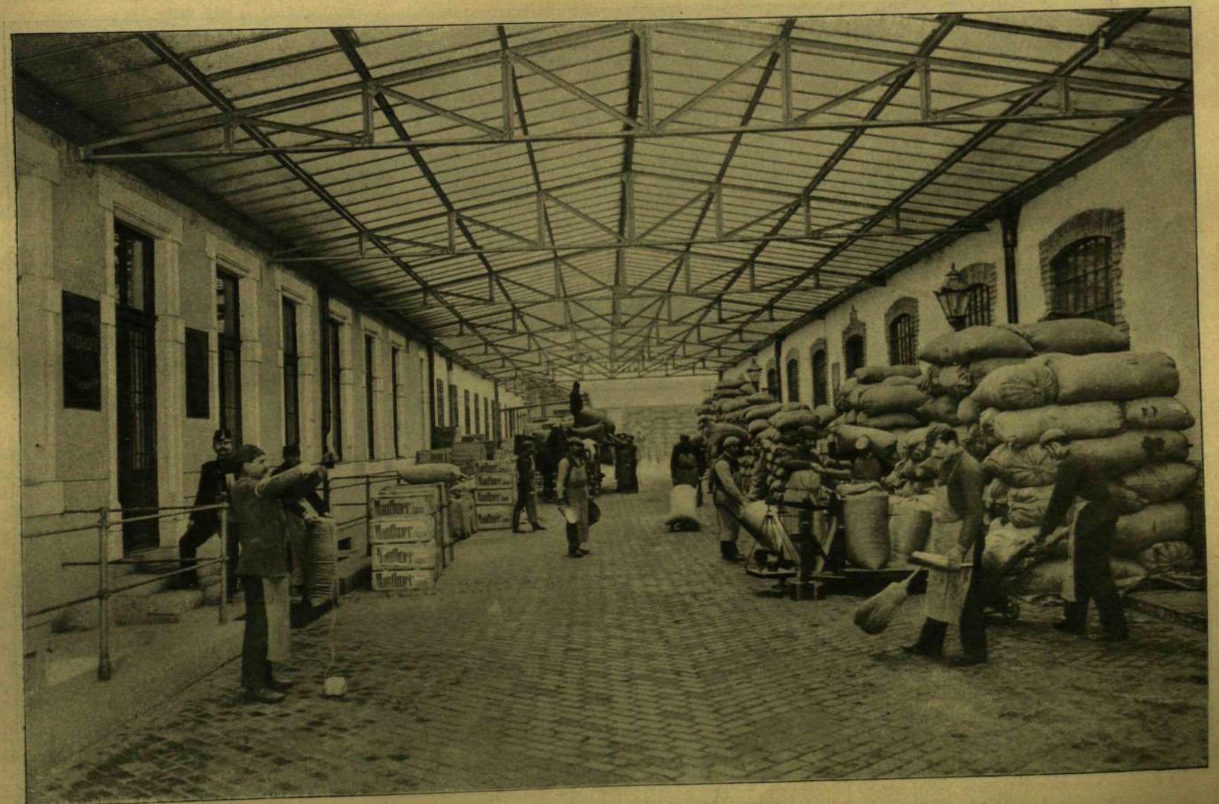
Fedett csarnok, honnan a gazdasági magvak elszállítatnak. Jobbról és balról a gazdasági magvak raktárai.