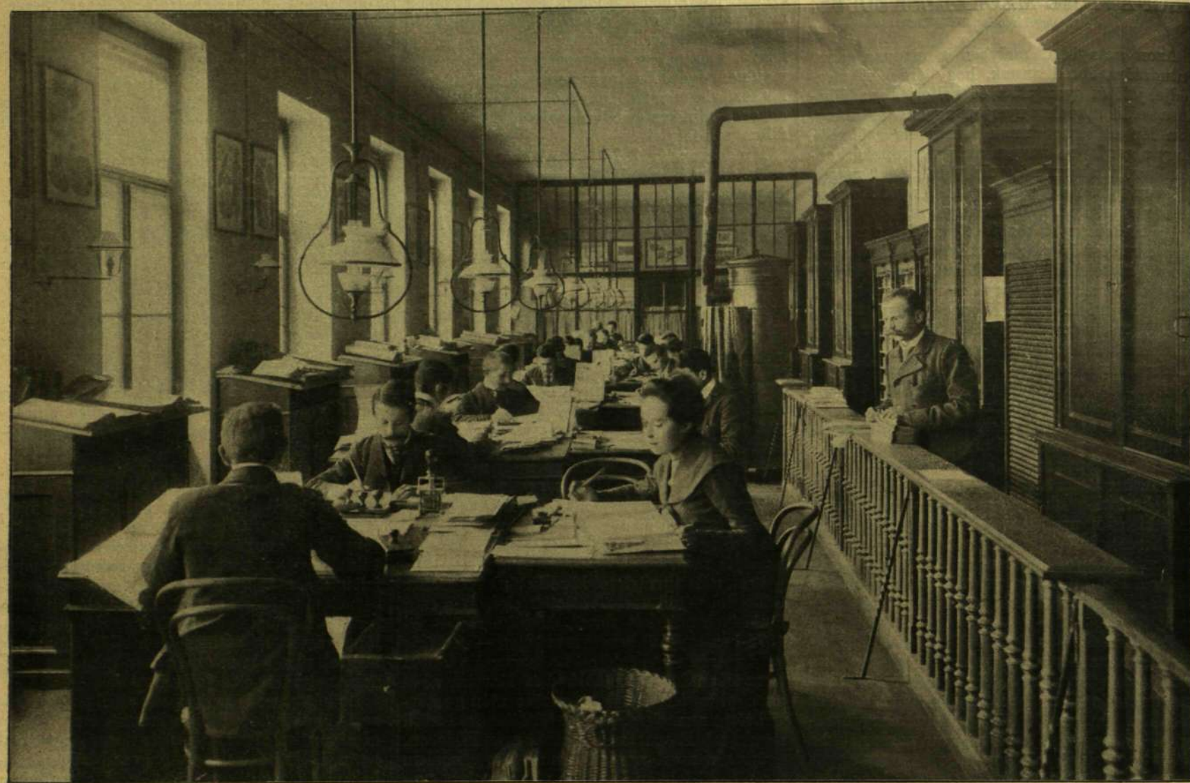
I. Központi iroda. Könyvelés és levelezés.