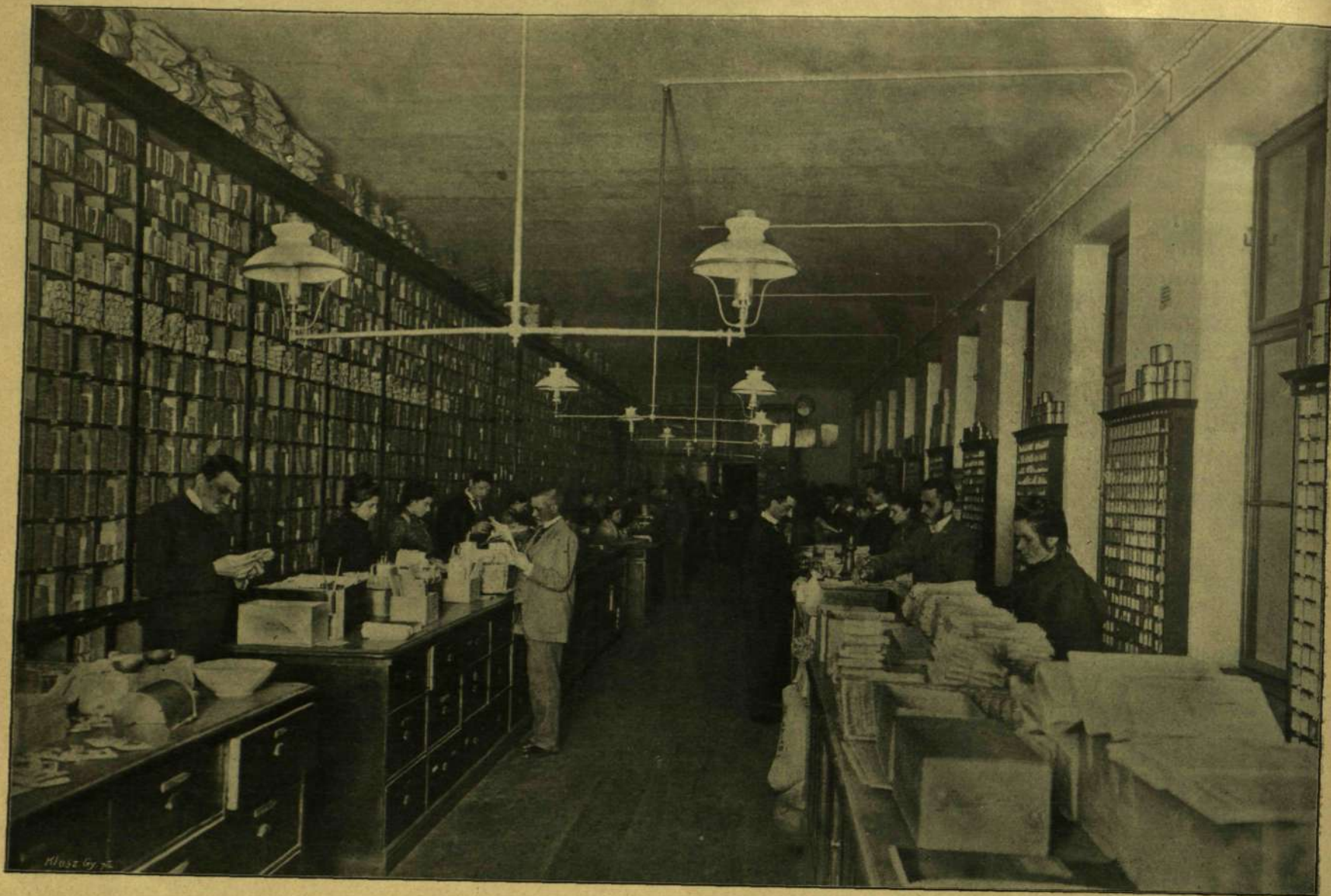
A beérkezett konyhakerti- és virágmag-rendelések összeállítása.