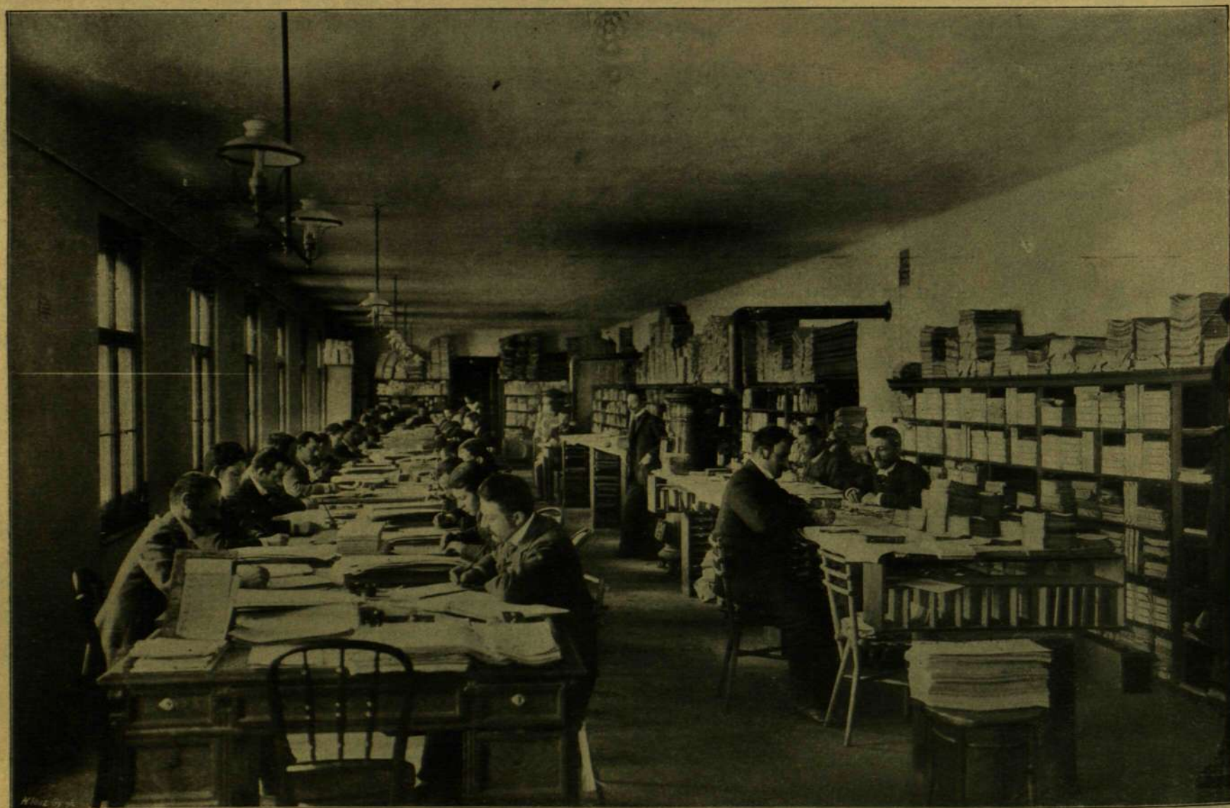
II. Iroda. A beérkező rendelések írásbeli elintézése, u. m. számlázás, címzés, irányítás, stb.