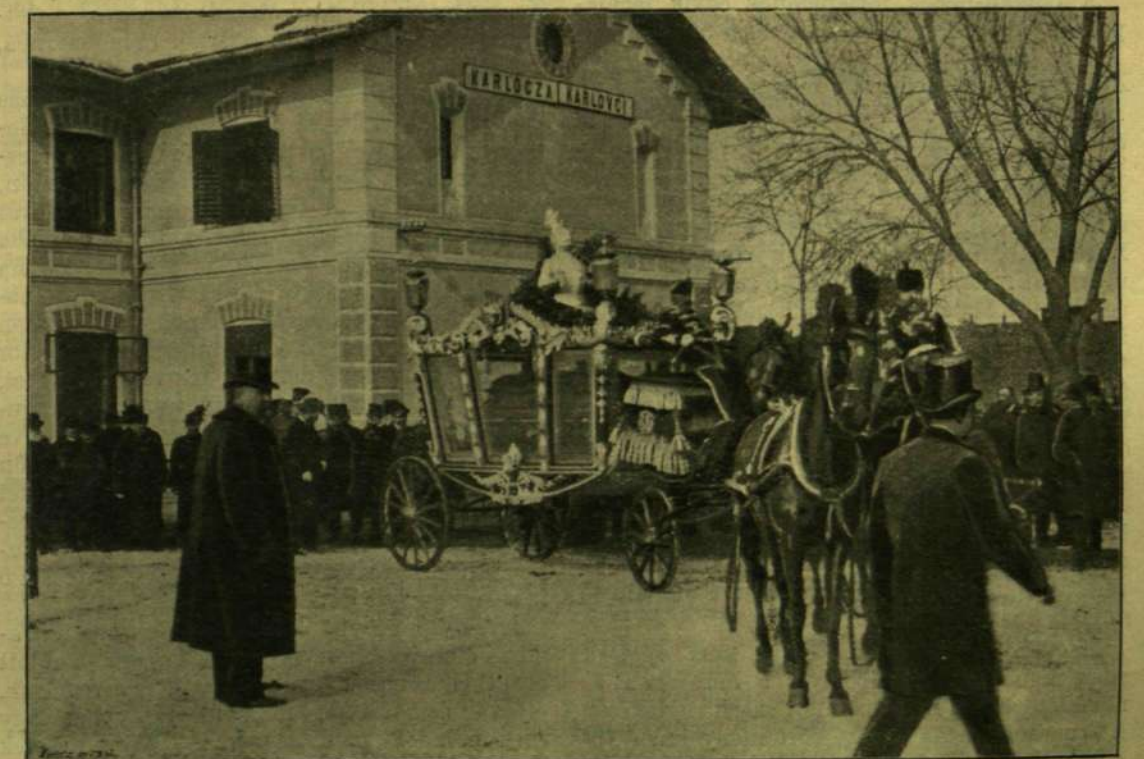
A GYÁSZKOCSI ELINDULÁSA A KARLOCCZAI VASUTI ÁLLOMÁSTÓL.