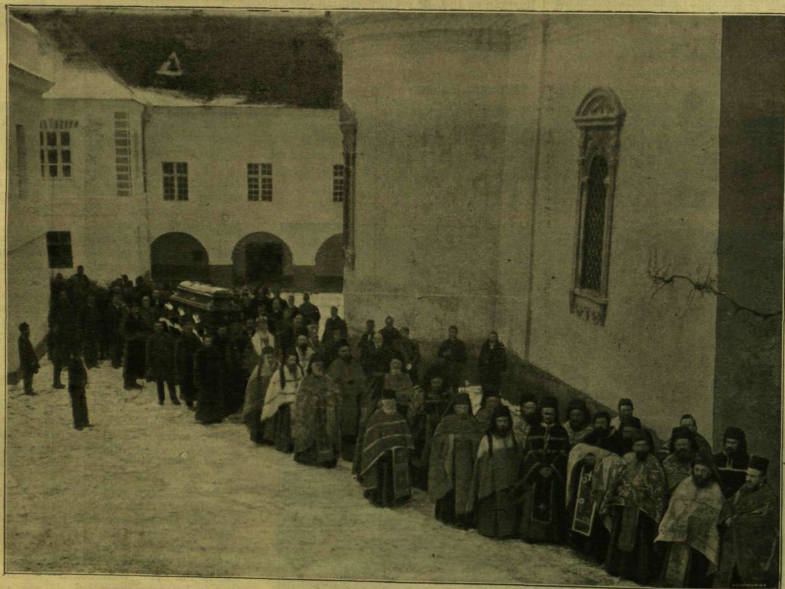
A KOPORSÓ ÁTSZÁLLÍTÁSA A KRUSEDOLI SÍRBOLTBÁ.

A világhírű tengeri fürdő és nemzetközi mulatóhely tarka közönsége elég szórakozást nyújtott; franczia ember aránylag kevés volt,