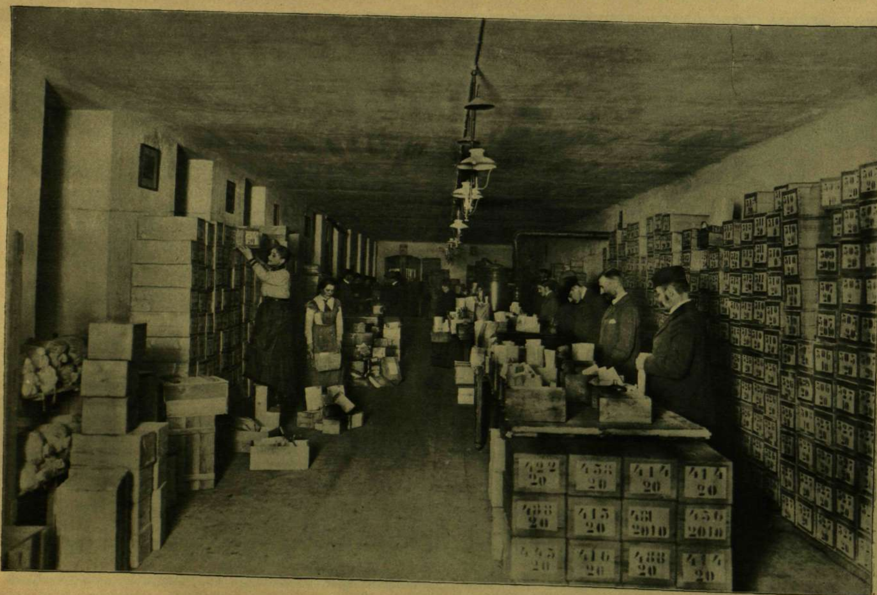
Konyhakerti- és virágmagvak csomagolása, postai elszállításra.