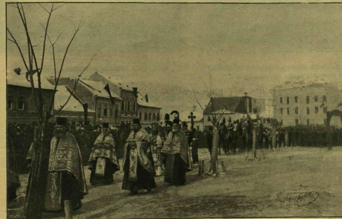
MEGÉRKEZÉS A SZÉKESEGYHÁZHOZ.