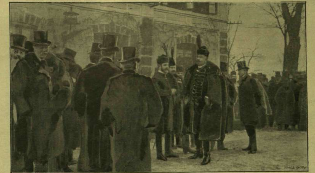
A MILÁN HOLTTESTÉT SZÁLLÍTÓ VONATRA VÁRAKOZÓK A KARLOCCZAI PÁLYAUDVARON.