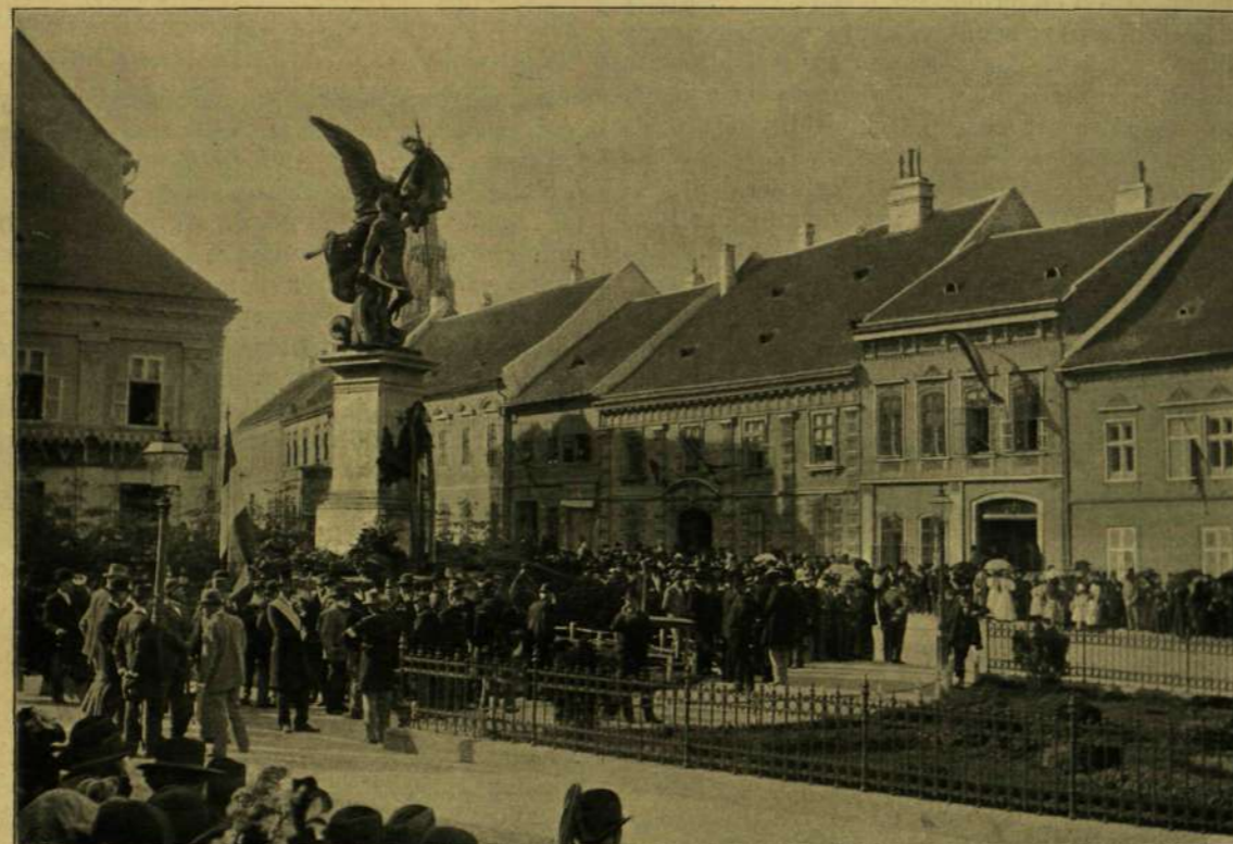
BUDAVÁR VISSZAFoglalásának EMLÉKÜNNEPE MÁJUS 21-ÉN. — Gyülekezés a honvédszobor előtt.

Ime az «indelta» áldásos munkája, mely szó