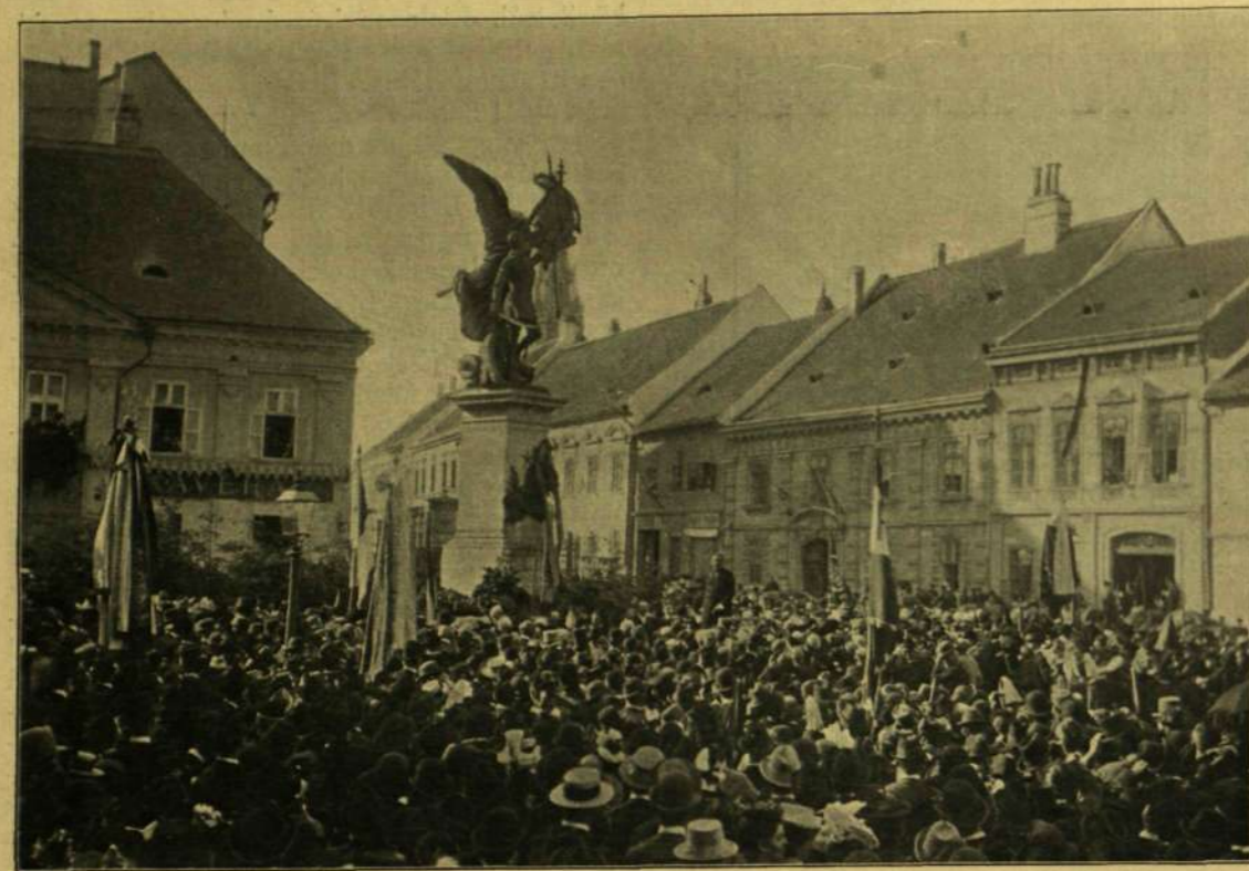
AZ EMLÉKÜNNEP A HONVÉDSZOBOR ELŐTT.

ellen»-nek nevezett hűbéreket kaptak, melyeknek terjedelme rangjokkal állott arányban. A katonák «torp» ezímen házat és telket kaptak, mely a birtokos halála után visszaszállt a kincstárra, vagy is újabban adományoztatott.