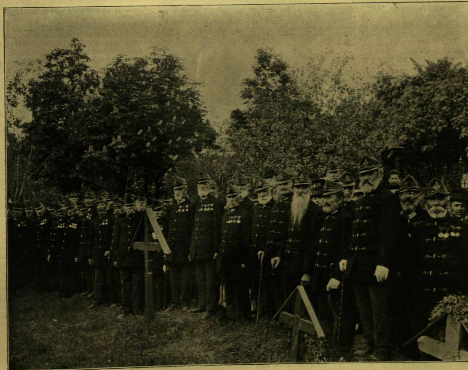
Öreg honvédek a budai honvédsírnál.