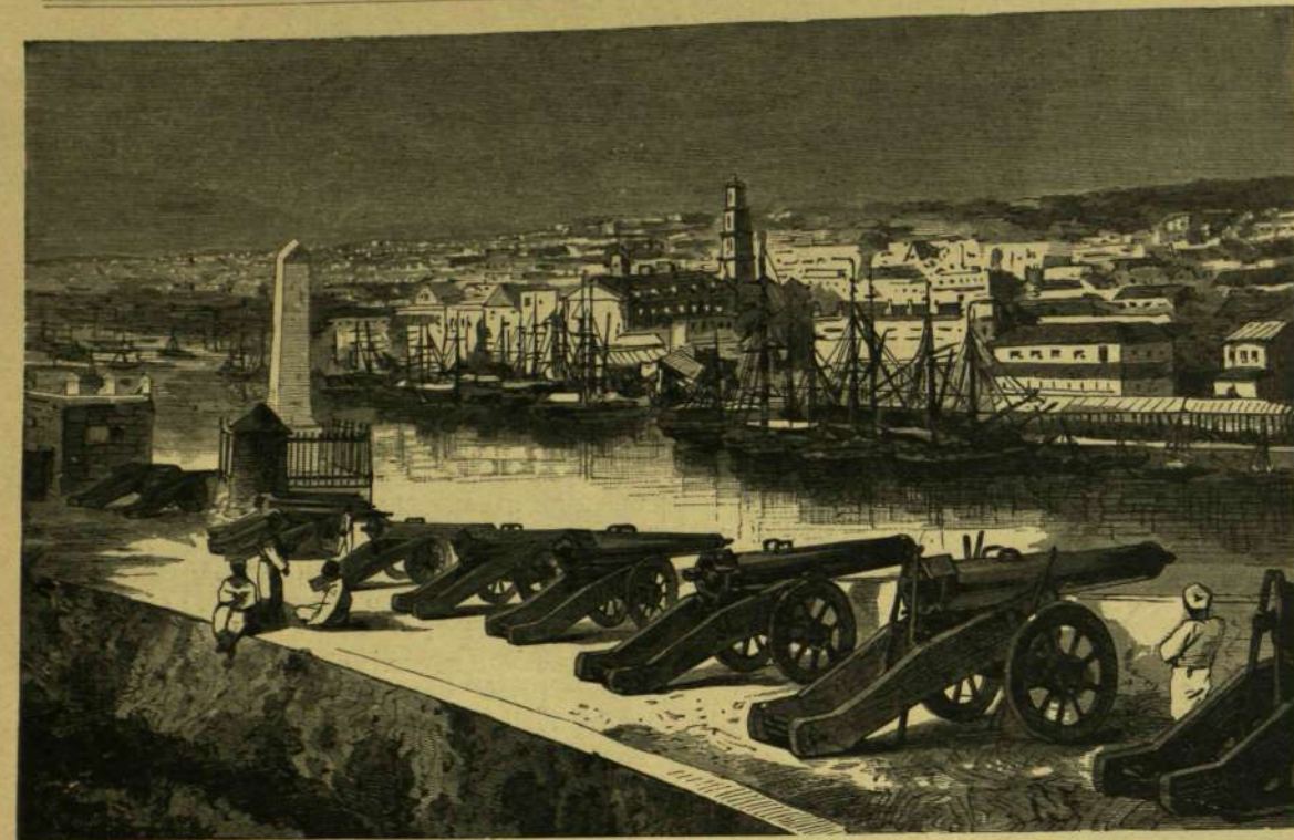
HAVANNA, KUBA SZIGET FŐVÁROSA.

mélto a Réz-hegységben eredő s délnyugati irányban a Bayamo-völgyön át futó Río Cauto , mely torkolatától 82 km. távolsáig hajózható s Julcaronául ömlik az Esperansa-öbölbe ; továbbá éjszakra a Sagua folyó . A többi, körülbelül 150 folyó hajózásra alkalmatlan, de annál fontosabb a talaj öntözésére való tekintetből. E vizek teszik Kuba szigetét termékenyebbé. Némelyek közülök a száraz évszakban kiszáradnak, mások a föld alá bújnak, majd ismét előtűnnek; ismét mások elszikkadnak, mielőtt a tengert elérnék. Az esős évszakban mindezen folyók általában megáradnak, gyakran kiöntenek, a szomszédos területeket elborítják s az utakat elmosás.