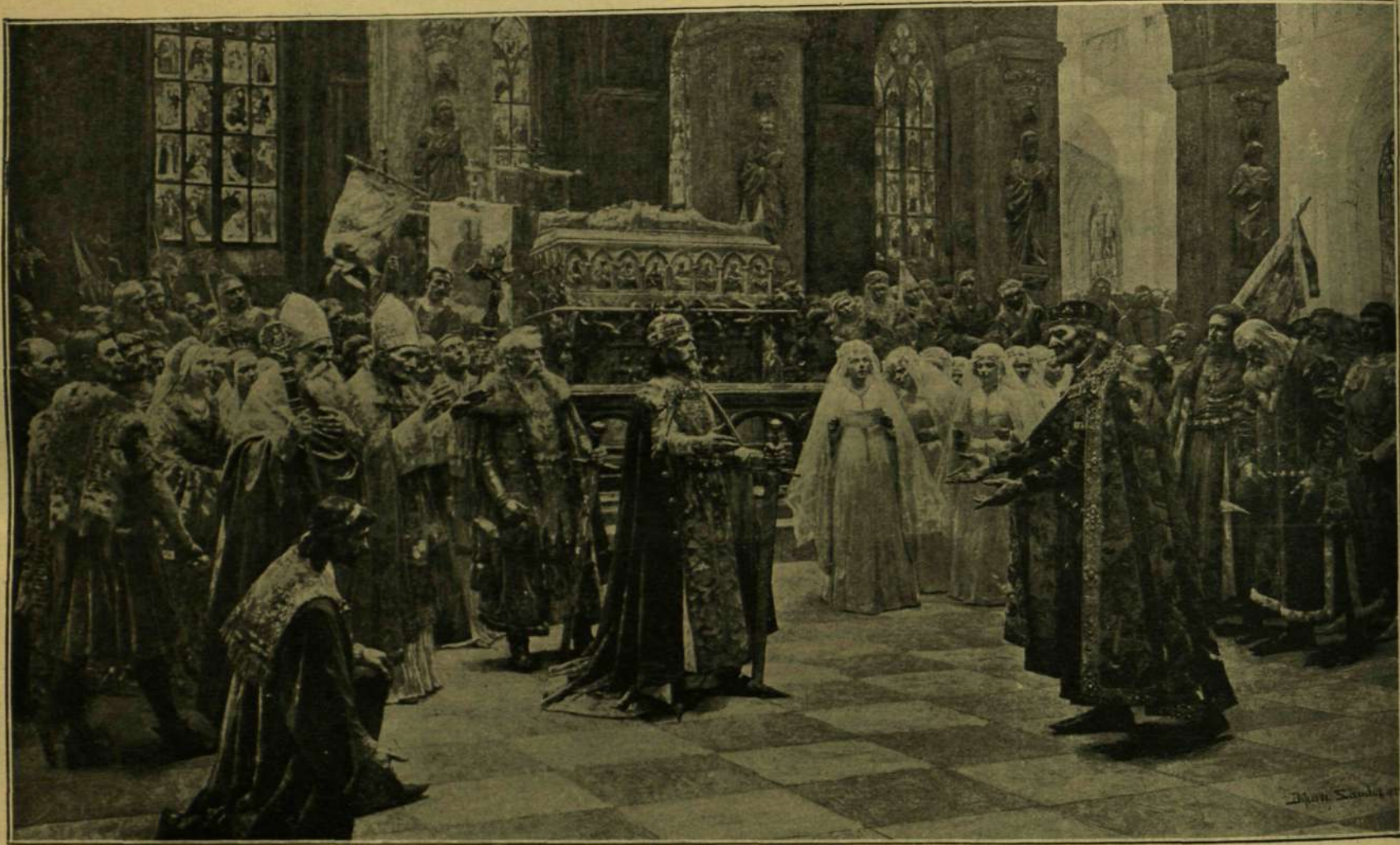
ZSIGMOND KIRÁLY FOGADJA ULÁSZLÓ KIRÁLYT. — Bihar Sándor festménye.

* Mikroszkopikus íráskor. Régebben sok helyen gondosan őrizték egy-egy ritkaságot, mely igen kis területen, például egy eszernyemagyon vagy egy levelezőlapon könnyen olvashatólag egész verseket vagy hosszabb iratokat tartalmazott. Ma e csodának már jóformán vége van, mióta egy angol tehnikus oly irógépet talált ki, melynek segítségével egy angol négyzetű hüvelyk nagyságu üvegre az egész angol bibliát 22-szer le lehet írni oly módon, hogy azt nagyító üveg segítségével könnyen lehet olvasni. A hihetetlennek látszó dolog valósággal tény. A precizia segítségével ugyanis lehetséges egy milliméter hosszúságot ezer részre osztani, úgy hogy a bakteriumokat, melyeknek hossza és szélessége néha \frac{1}{1000} milliméternél is kisebb, igen jól meg lehet különböztetni. Ezzel a géppel tehát egy milliméter átmérőjű négyzetet eszser ezer, azaz egy millió kis négyzetre lehet felosztani. Mivel pedig egy angol hüvelyk 25 mm. hosszú, a négyzetű hüvelyken