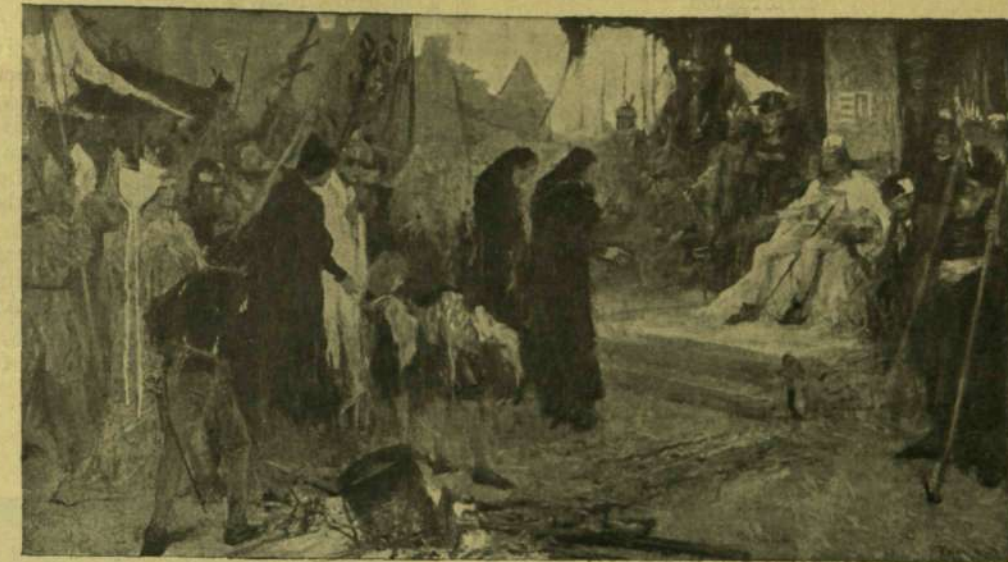
A BOROSZLÓI BÉKEKÖTÉS. — Kriesch Aladár vázlata.