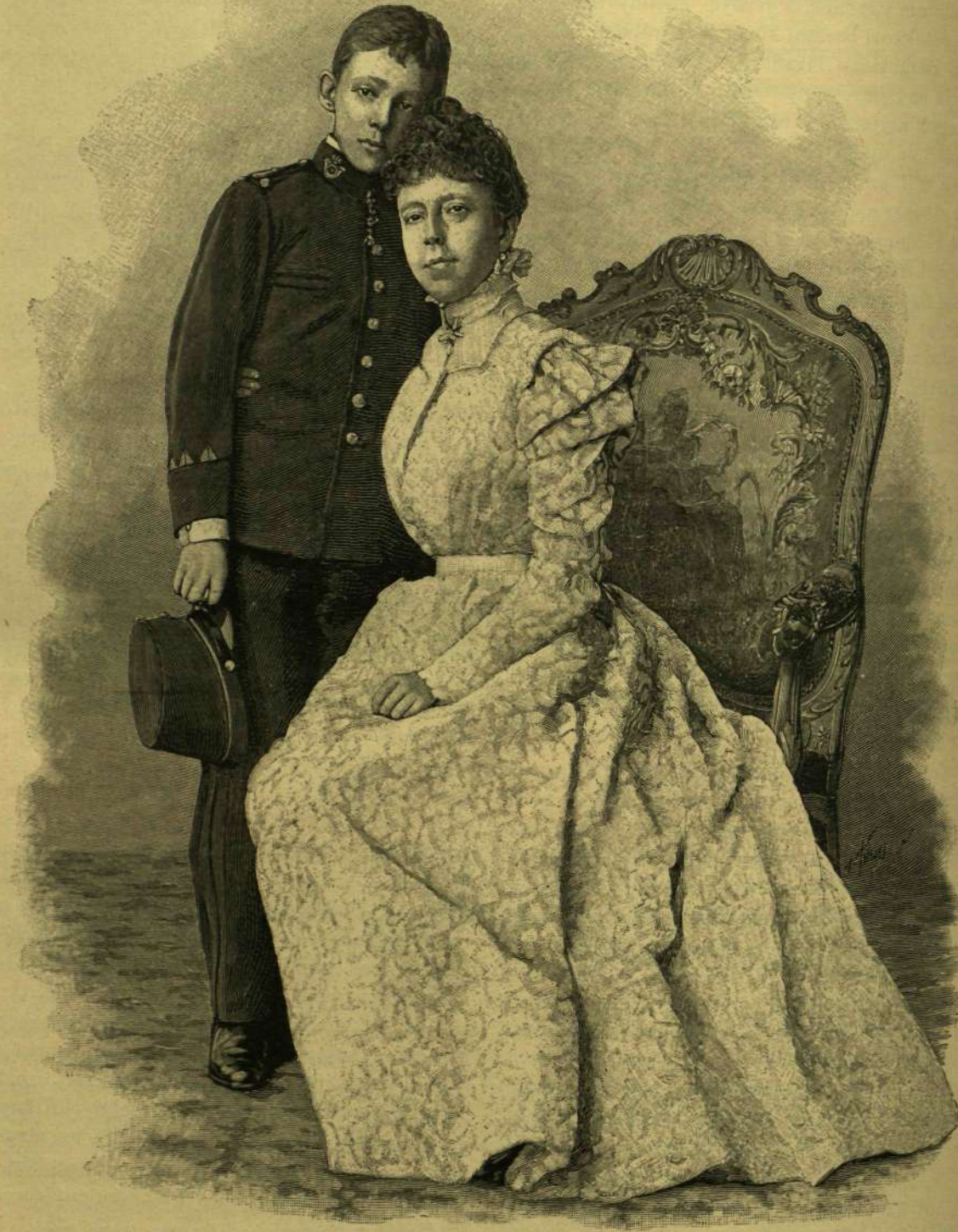
XIII. ALFONZO SPANYOL KIRÁLY ÉS ANYJA, MÁRIA KRISZTINA REGENS KIRÁLYNŐ.

Az amerikai Egyesült-Államokkal háborúba keveredett Spanyolország regens-királynője, Mária Krisztina osztrák főhercegnő, 1879 nov.