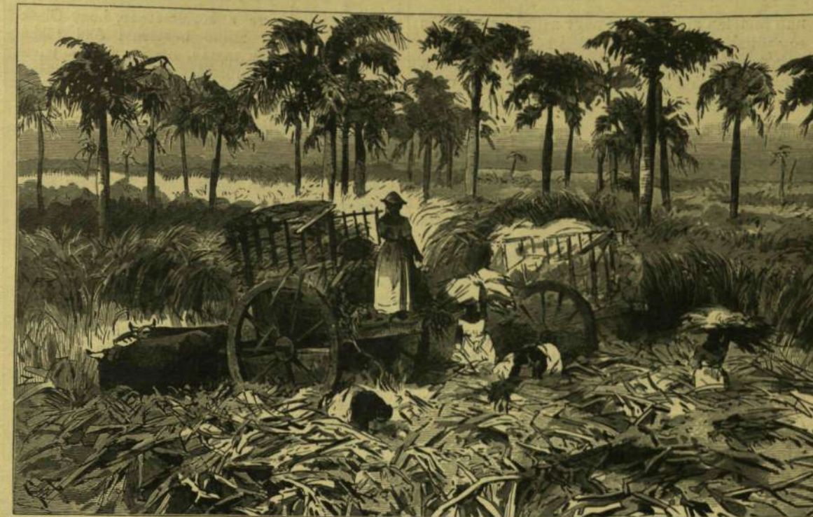
CZUKORNÁD-ÜLTETVÉNY KUBA SZIGETÉN.

fel őket, biztosítva életük megkímélését. Prágya azt üzenete vissza: «Meghalunk, de nem adjuk meg magunkat. Magyarok vagyunk. » Akkor már a majorság födelének ablakaiból lövöldöztek, s a parancsnok nem tudott más mit tenni ellenük, mint hogy felgyújtatta fölöttük a tetőt. Így vesztet el, — élve egy sem került a spanyolok kezére, kik aztán nem sokára eltiporták a kubaik függetlenségi harcát.