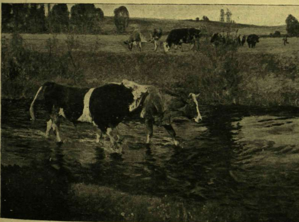
Frenzel Oszkar: Udvartás.

A KÉPZŐMŰVÉSZETI TÁRSULAT TAVASZI KIÁLLÍTÁSÁBÓL.