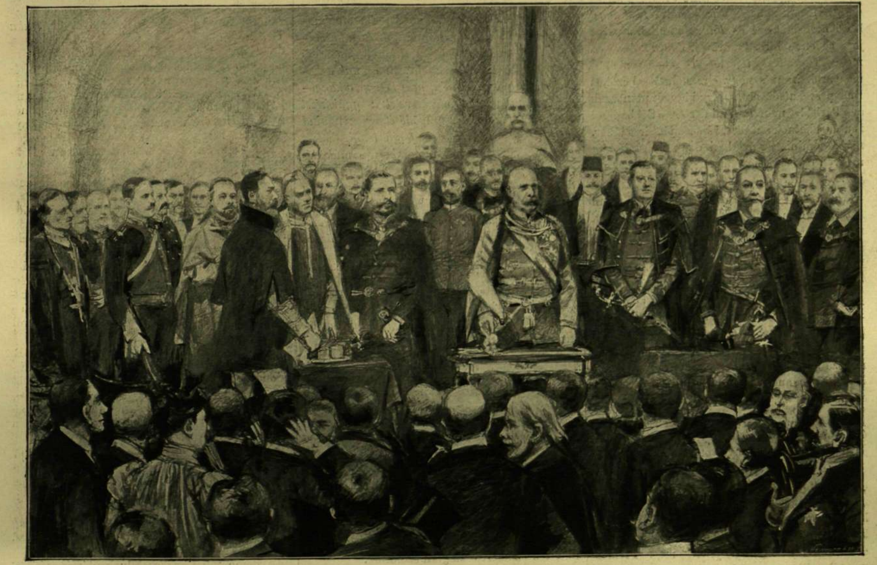
A KÖZEGÉSZSÉGI ÉS DEMOGRAFIAI KONGRESSZUS. — Károly Lajos főherceg védnökhelyettes megnyitja a kongresszust. Jantyik Mátyás rajza.

lobogózták, s a mozgalmal élet elvénésége terjedt el a fővárosban. A pályaházakba roborog vonatok csupa kongresszusi tagokat hoztak, a kiket előzékeny bizottságok fogadtak. Éjszaka szöke fia mellett ide jöttek kelet és dél napbarnította tudósai festői nemzeti viseletben. Valamennyit egy közös cél, egy nagy eszmény hozta ide, hogy előbbre vigyék az emberiség ügyét a tudomány, a civilizáció és a közegészségügy terén. A vendégek egyenesen a műgyetemre siettek, a kongresszus főtelepére, melynek fényes és czélszerű berendezése meglepte a világlátott külföldieket is. Az első emeleten rendezték be a nagy kényelmet nyújtó társalgót és e mellett a postatermet, a hol naphosszat fiatal fővárosi tisztviselők egész serege adogatta kézhez a kon-