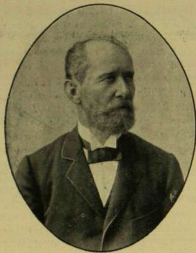
Dr. Than Károly.