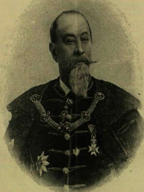
Ráth Károly, főpolgármester