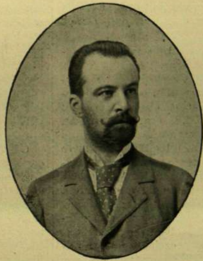
Dr. Bókai János.