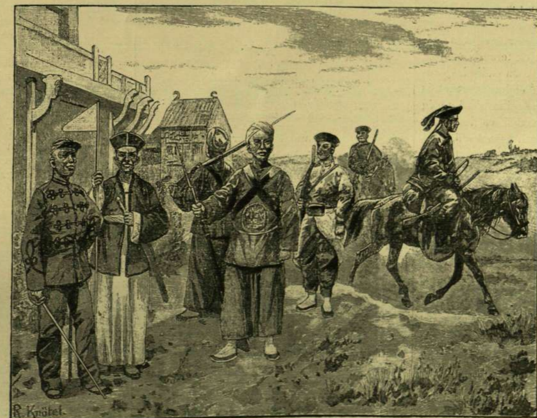
Gyalogsági tisz. Gyalogsági tisz mandarin öltözében. Gyalog katonák. Tatár lovas.

Japánból bemutatjuk a császári pár arcképét. A jelenlegi császár Mutsuhito, ki 1852-ben született, Japán legnevezetesebb mikádója lesz örök időköz, mivel ő egyesítette a shagunok uralkodása alatt annyira szanaszét bomlott birodalmat, megtörte a shagunok és más arisztokraták hatalmát, megnyitotta országát az európai művelődésnek, s pár évtized alatt egészen új világot teremtett Japánban. A kiváló mikádóról azonban nem akarunk most mellékesen szólni, röviden alig is lehetne, s csak arcképét mutatjuk be, s egyúttal nejeét, az 1850-ben született, tehát férjénél másfél évvel idősebb Haruko császárnét, kinek szintén nagy érdemei vannak abban, hogy Japán európaias művelt állam lett. A császárnak közel rokona, Arishagava herceg (sz. 1835-ben), van