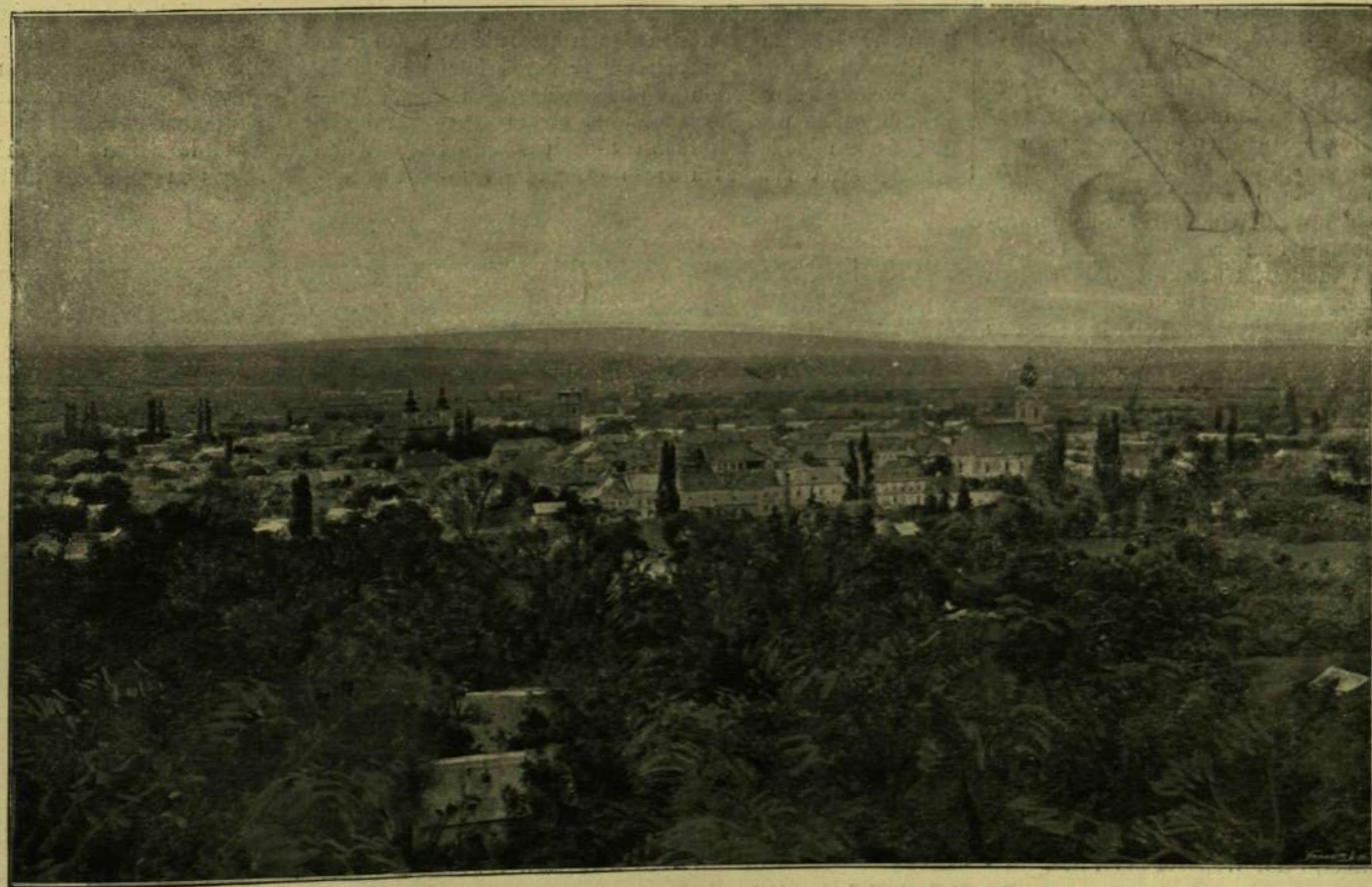
NAGYBÁNYA ÉJSZAK FELŐL.