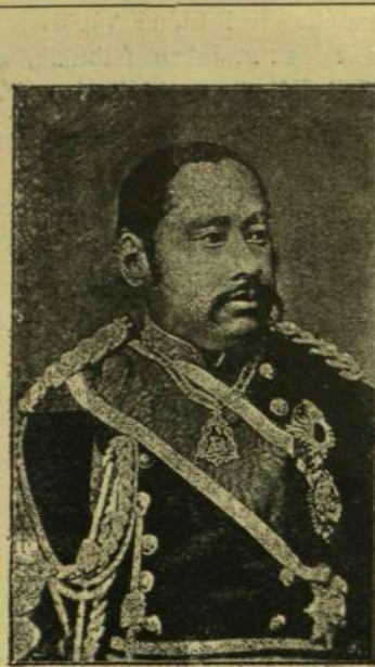
ARISHAGAVA HERCEG, JAPÁNI HADVEZÉR.

Hosszas előkészületek után csakugyan kitört a háború Korea miatt Kelet-Ázsia két leghatalmasabb országa, Khina és Japán között. Tulajdonképp már pár hete tart, bár a valószínű hadüzenet csak a napokban történt meg. Mindkét állam, — miként a háborúk keletkezésénél Európában is divatos, — a másikra igyekeznek tolni a felelősséget a béke megrontása miatt, a politikai közvélemény ez alkalommal Japánt tartja a támadónak. De az is igaz, hogy a háború oka lényegileg az, melyeknek legyen a két állam közül nagyobb hatalma a mindkettőhöz közel fekvő Korea felett, mely belzavarok és anyagi bajok következtében már annyira jutott, hogy lehúllásra érett gyümölcsnek lehet tekinteni. A helyzetet megnehezíti még az is, hogy a két kelet-ázsiai hatalmon kívül szomszédja ez az érett gyümölcs a nagy Oroszországnak is, mely nyilván kész lenne ezt a tartományt rengeteg birtokába beolvasztani; mert bár Korea neki csak kicsiny falat (csak félakkora mint Magyarország), de fevése igen kedvező, mivel a muszkák ez által a Csendes-óceánon is úrrá lehetnének; holott most hosszú csendes-óceáni partvidékükön egyetlen alkalmas kikötőjük sincs. A két háborús