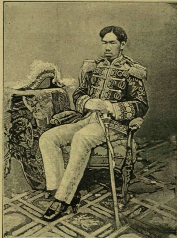
MUTSUHITO JAPÁNI CSÁSZÁR.

mondá meleg hangon. — Engedje meg, hogy ápolói helyét a Jakab ágya mellett én foglaljam el. Úgy is, ha valaki, én tartozom neki ezzel... Sára hálásan nyújtotta a kezét. — «Köszönöm, nagyon köszönöm ezt az áldozatot, mérnök úr! Nagy gondot vett le a lelkemről...» Mosolyogva hozzá tette: — «Átengedem ezt a helyet, de azzal a feltétellel, hogy olykor megint visszaengedi.» — «Áll az alku! — helyeselte a mérnök és megszorította a leány kezét. — Becsületesen megosztozunk ebben a gondban.» (Folytatása következik.)