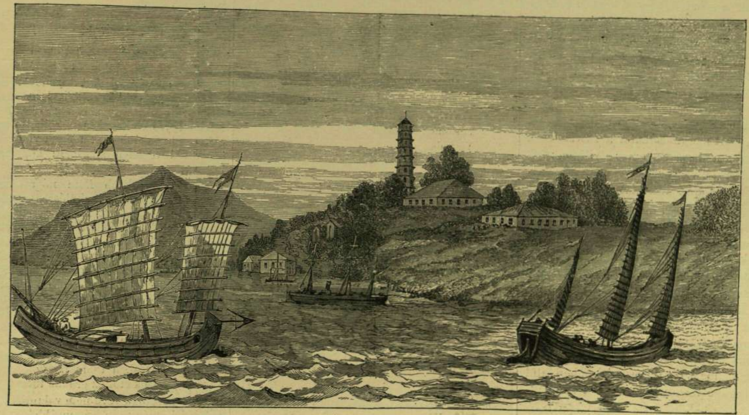
KHINAI HAJÓK A FU-SEUI ARZENÁLNAI.

kiszemelve arra, hogy a jelen háborúban a hadsereget vezesse. Ennek arcképét is bemutatjuk. Igen érdekes a japáni hadsereg. Mint sok más japáni intézmény, annyira európaias, hogy csaknem a miennkel egyenlő. Japánban is megvan az általános hadkötelezettség. A 20-ik életévtől fogva 3 évig szolgál mindenki az állandó hadseregben, mások a tengerészetnél 4 évig; esetleg 5 évig a helyi csapatoknál. Ezenkívül minden hadköteles egész 40 éves koráig a népfelkelő csoportjába tartozik. A hadsereg fegyverzete igen kitűnő, s a gyalogság Maratta-féle hátultöltőkkel van fölfegyverezve, fél méteres szuronyokkal. A hadsereg békében 40.398 katonából áll 80 zászlóaljból, a kiegészítő csapatokkal és a zsendársággal együtt pedig 71.177 emberből. A hadilétszám mintegy 200.000 fő. Ágyuk Krupp-félék. A japáni katonákat nagyon dicsérik, mint értelmes és lelkiismeretes embereket. Egyenruhájuk európaias, leginkább hasonlít a franciaikéhoz. Ruházatuk alapszíne kékesfekete s a mellén vannak az egyes ezredek, s fegyvernemek megkülönböztető jelvényei: a gyalogságé piros, a tüzérségé zöld, a műszaki karba tartozóké fehér, a lovasságé világoszöld és a szekereseké élénk kék. A tisztetek a legénységtől első pillanatra megkülönbözteti, hogy mellidiszek