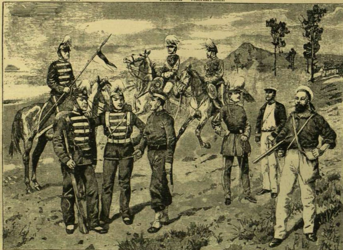
Gyalogos katona. Testőr tisz. Utász. Testőr gyalogsági tisz. Hajóhadí tisz. Tengervész.

mondá meleg hangon. — Engedje meg, hogy ápolói helyét a Jakab ágya mellett én foglaljam el. Úgy is, ha valaki, én tartozom neki ezzel... Sára hálásan nyújtotta a kezét. — «Köszönöm, nagyon köszönöm ezt az áldozatot, mérnök úr! Nagy gondot vett le a lelkemről...» Mosolyogva hozzá tette: — «Átengedem ezt a helyet, de azzal a feltétellel, hogy olykor megint visszaengedi.» — «Áll az alku! — helyeselte a mérnök és megszorította a leány kezét. — Becsületesen megosztozunk ebben a gondban.» (Folytatása következik.)