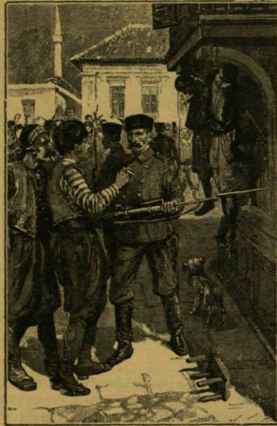
AZ ORGYILKOSOK KIVÉGZÉSE SZÓFIÁBAN.

után a szomszéd városok és falvak előljáróinak táviratilag meghagyta, hogy minden embert tartóztassanak le, ki estig házától távol volt. Ez leginkább azért történt, mivel a katonaság kivonulásáig a gyanús emberek könnyen megszökhettek a városból. A mi-