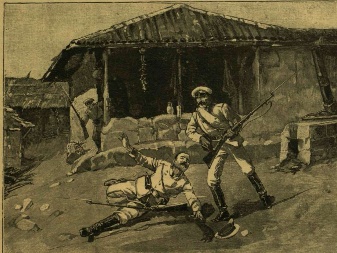
ELŐŐRSI ÖSSZEÜTKÖZÉS: AZ ELSŐ LÖVÉS A SZERB-BOLGÁR HADJÁRATBAN.