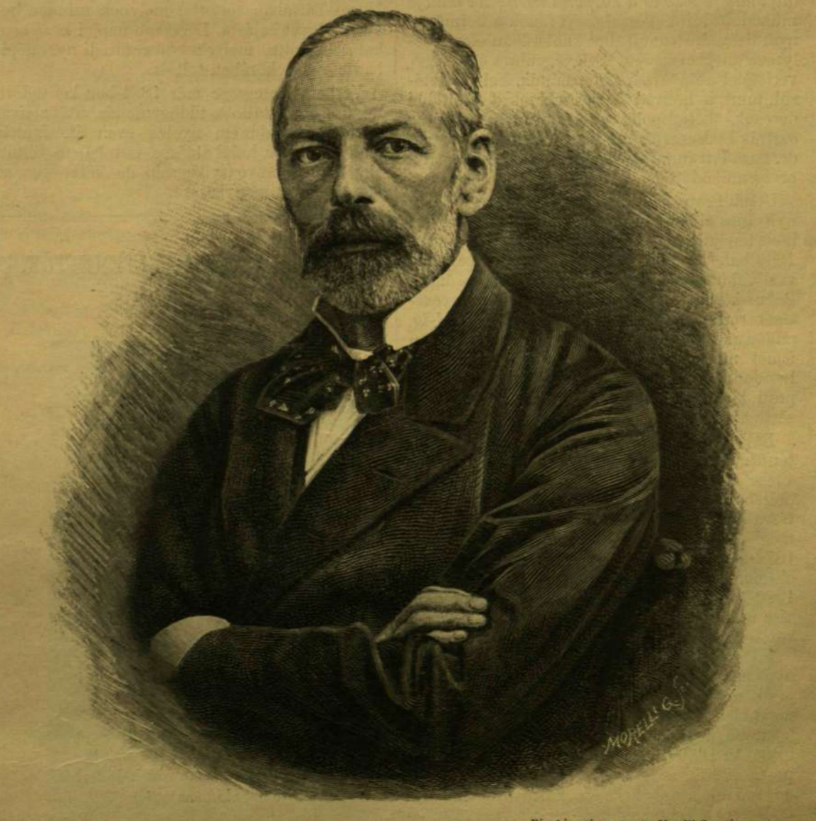
Dr. LUMNICZER SÁNDOR.

Dr. Lumniczer Sándor, a magyar orvosi kar-nak ez egyik legelőkelőbb alakja, a kitűnő egye-temi tanár, nálunk a modern sebészet első meghonosítói közé tartozott. Már a szabadság-harez idejében, mint egész ifjú emberét, szár-nyaira vette a hir nevét. De sebészi jelentősége akkor lön szélesebb körben is nyilvánvalóvá, midőn a Rókus-kórház egyik sebészi osztályá-nak vezetését átvevén, ott hivatásának meg-felelő munkatér nyílt számára. Szakirodalmi jelentésekben adta közre itt gyűjtött tapasz-talatai eredményét s csakhamar el lön ismervé legképzettebb szaktekintélyeink egyikének s ott találta magát legfirésőbb, legkeresettebb orvo-saink között. Kartársai, kiknek mindig előző-kény kollégájok volt, szivesen kérték tanácsát, mert becsülni tanulták tapasztalatokon nyugvó alapos tudományát, éles ítélését, lelkiismeretes-ségét és igazságszeretetét. Betegei nagy bizalom-mal csüggték rajta, látván meleg érdeklődését, igazi emberszeretetét, melyet finom modor és öntudatos nyugalom tett még inkább bizalmat keltőbbé. Mint tanár, mint orvos egyaránt jeles volt s mint köz- és magánéleti ember is a leg-tiszteletreméltóbbak közül való. Meleg elismerő sorok kíséretében ismerteti életének pályáját az «Orvosi Hetilap», melynek adatait az alábbiakban mi is fölhasználjuk.