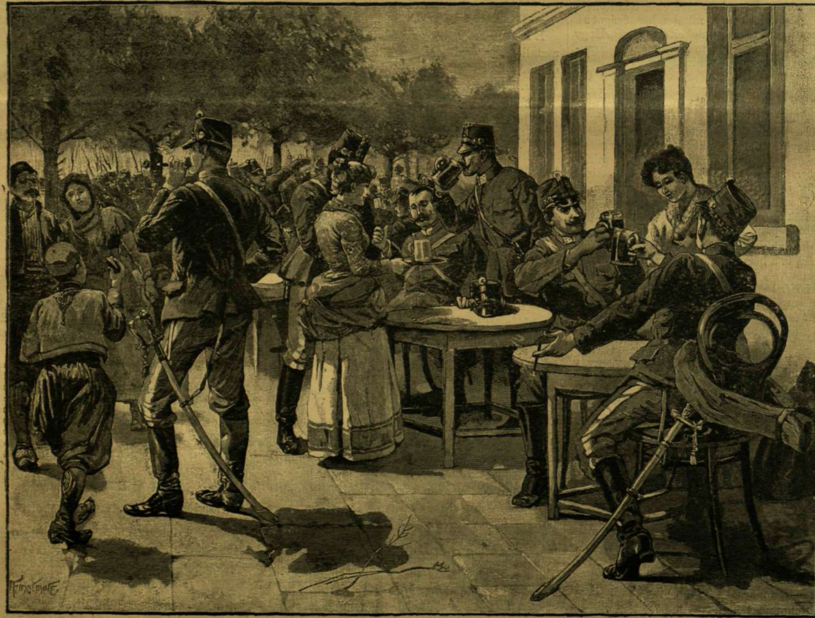
AZ 1892-KI NAGY HÁBORÚBÓL. — BELGRÁD MEGSZÁLLÁSA AZ OSZTRÁK-MAGYAR CSAPATOK ÁLTAL. «VÉGRE VALAHÁRA!»

előtte való napon több konzulátusi kavasz (bensülött szolgálk) társaságában láttam. Abban a pillanatban, midőn a fejedelem a hintóból kilépni készült, a montenegrói suhanc jelére az imént a kocsit előtt haladó ál-török egy szurony alakú nagy késsel megszurta a fejedelemet. Mindez egy pillanat alatt tör-