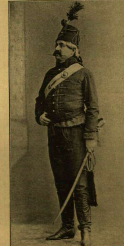
HETÉNYI MINT KÖPPECNS (»IGAZHÁZI»-BÓL).