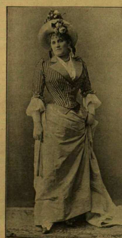
HELVEY LAURA MINT FILOFROZŰNE GRÓFNŐ.