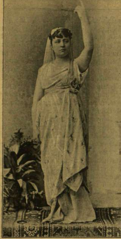
JÁSZAI MARI MINT MÚZSA.