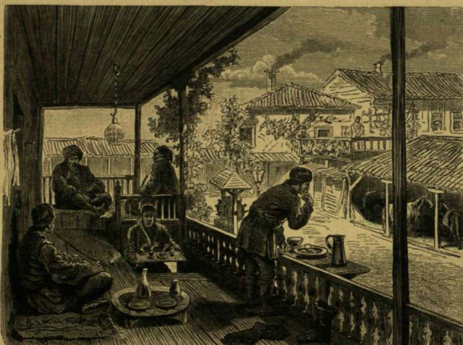
CZRVENI GYORGYE VENDÉGLŐJE ESZKI-DSUMÁBAN.