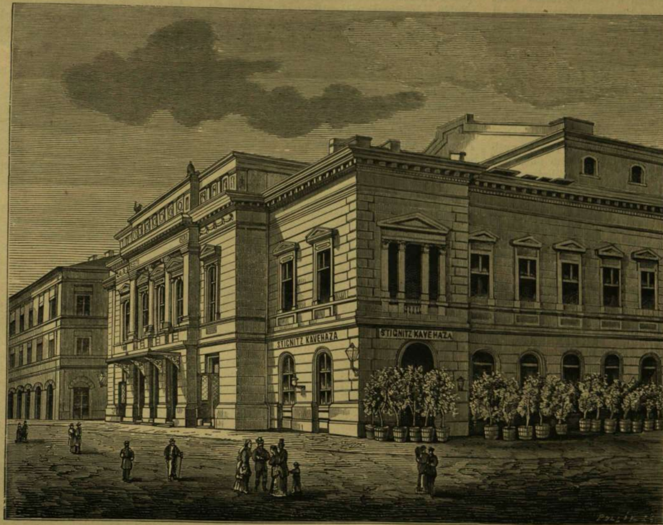
SZÉKES-FEHÉRVÁRI SZÍNHÁZ.