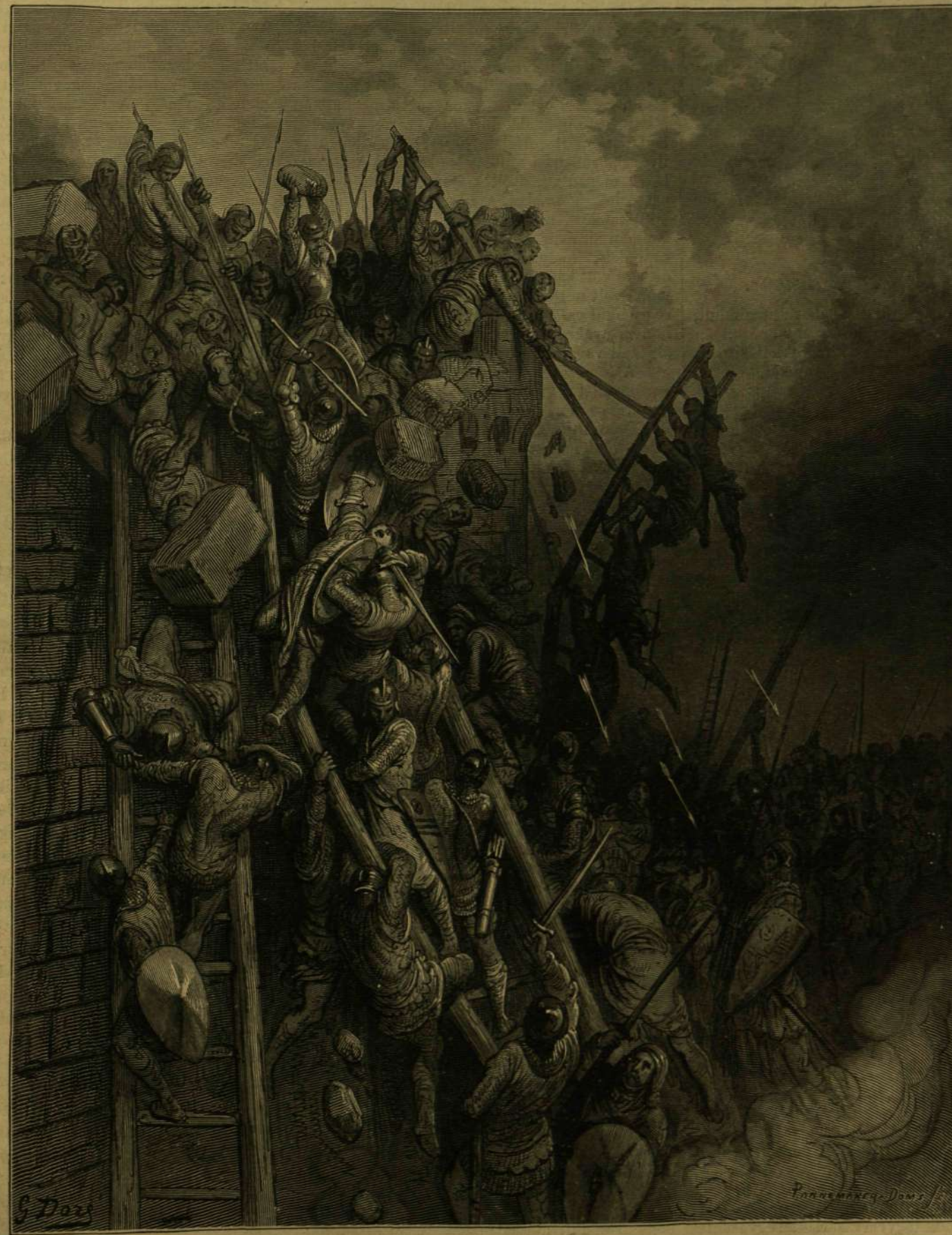
A KERESZTES HÁBORUKBÓL: MOSONY-VÁR OSTROMA EMICO KERESZTESEI ÁLTAL.

Olyan keresztes hadjáratot, minő a hét-nyolezszáz előtti volt, ma többé indítani nem