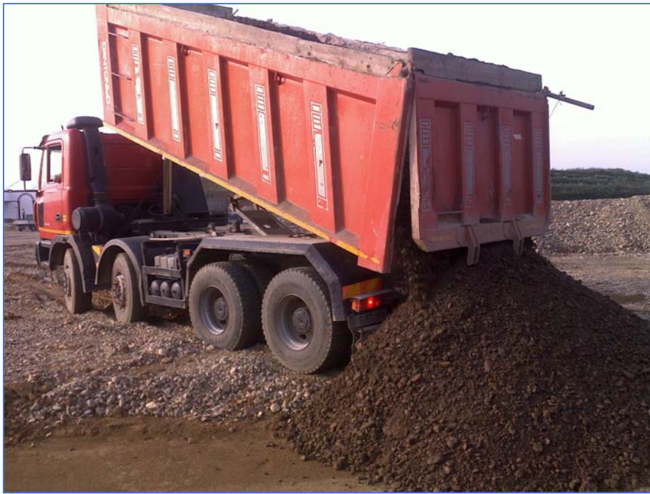
10. ábra Homokos kavics útalap, E60

Meglátásaim szerint, sikerül bizonyítani, hogy a stabilizált talaj úgy a laboratóriumi körülmények között mért mechanikai jellemzőiben, mint a terepen elvárt teherbírásában hasonló vagy jobb eredményeket képes teremteni az elfogadott építőanyagokhoz viszonyítva. Ezen esetben igen javasolt volna gazdasági és ökológiai okokból bevezetni az útalapban használható építőanyagok listájába.