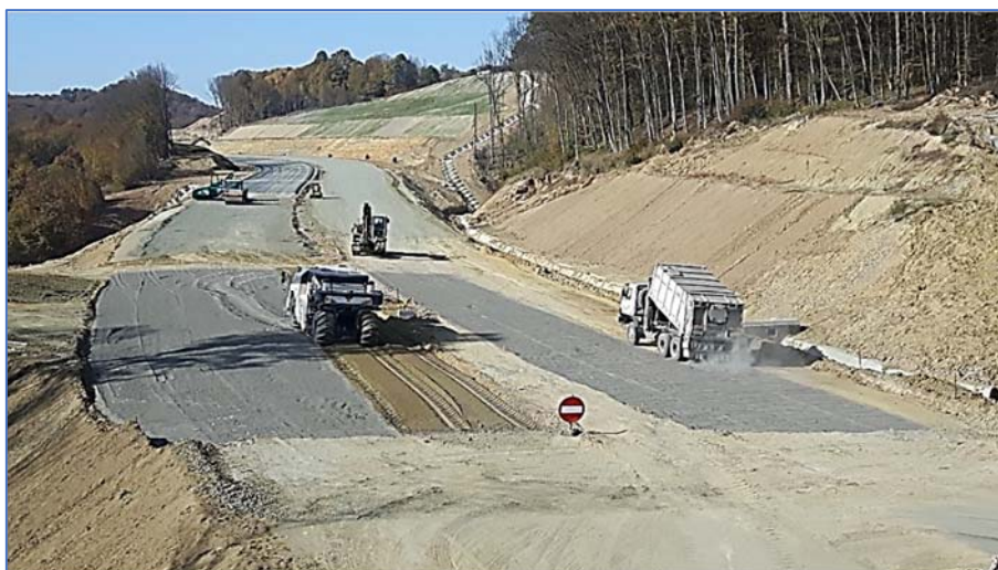
4. ábra Talajstabilizálás: A10-es autópálya Lot4