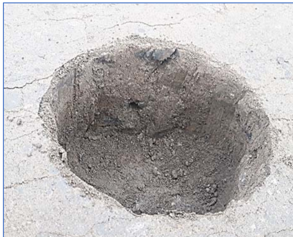
1. ábra Tömörség mérés talajjavítás után: Aeroport Transilvania Târgu Mureș / Hala NTN Sibiu