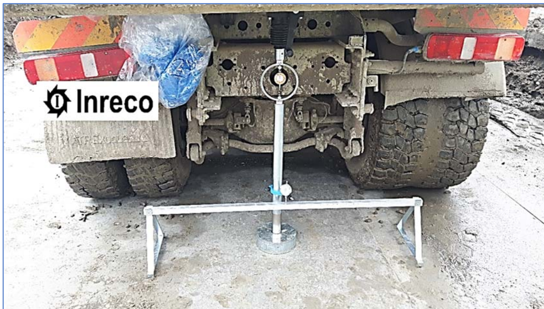
2. ábra Helyszíni CBR vizsgálat stabilizált talajon: Aeroport Transilvania Târgu Mureș

Talaj stabilizációról akkor beszélhetünk, amikor a talaj és kötőanyag homogén keverékéből (szükség esetén hozzáadott vízzel), megfelelően tömörítve, egy minőségileg messzemenően magasabb mechanikai jellemzőkkel bíró anyagot kapunk. Ezen jellemzők hosszú időtartamra megmaradnak, az így létrejött anyag stabil marad még víz vagy fagy hatására is. Ezen anyagok megváltozott mechanikai tulajdonságai mérhetőek úgy laboratóriumban, mint munkaterületen.