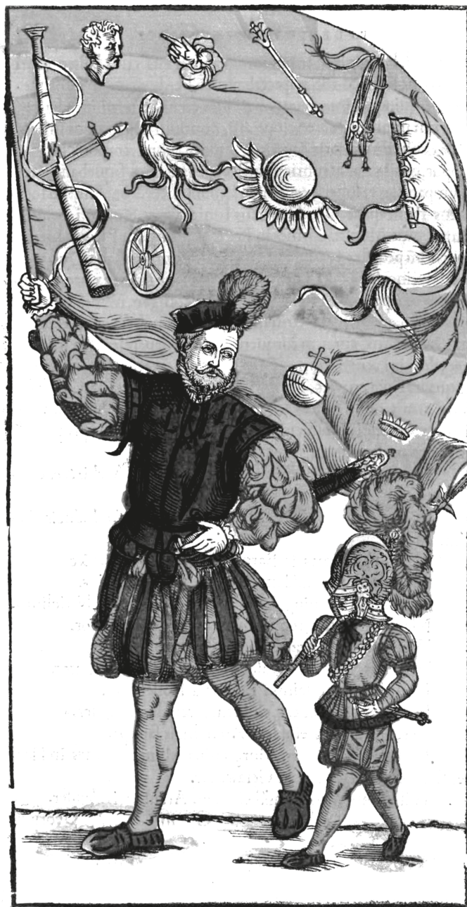
5. ábra. Könyvillusztráció, FRANCOLIN, Hans von, Rervm praeclare gestarvm, intra, et extra moenia mvnitissimae ciuitatis Viennensis... explicatio, Vienna, Raphael Hofhalter [1561?], XLv