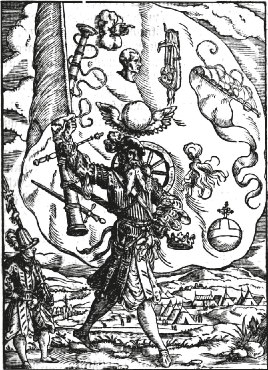
6. ábra. Könyvillusztáció, [FRANCOLIN, Hans von], Thurnier Buch, Warhafftige Beschreibunge aller kurzweil und Ritterspil..., Frankfurt, Feyerabend, 1566, IXr