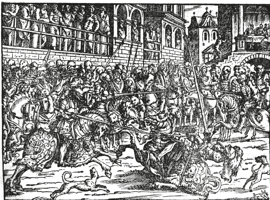
2. ábra. Könyvillusztáció, [RÜXNER, Georg], Thurnier Buch, Von Anfang, Vrsachen, Vrsprung vnd Herkommen der Thurnier..., Frankfurt, Feyerabend, 1566, XXIr

kiadták. Francolin, akit 1560-ban a bécsi udvar magyar királyi heroldjának neveztek ki, egy évvel később latin és német nyelven jelentette meg fametszetekkel és rézkarcokkal illusztrált könyvét. 23 Ebben az I. Ferdinánd (1503–1564) és veje, V. Albert (1528–1579) bajor választófejedelem, illetve a felesége tiszteletére 1560. május 24. és június 24. között rendezett nagyszabású bécsi ünnepségsorozatról – köztük a lovagi tornákról – közölt részletes beszámolót. Bár mind Rűxner, mind Francolin kiadványában voltak illusztrációk, Feyerabend Amman által készített új képekkel díszítette az 1566-os kiadást. Az új fametszetek némelyikén ugyanakkor a részletek kisebb-nagyobb megváltoztatása ellenére egyértelműen ráismerhetünk a Francolin 1561-es könyveiben megjelent, utólag beillesztett, nagy méretű (381×497 mm) illusztrációk többségére. A különböző mesterek által