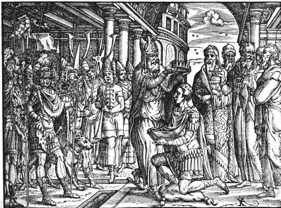
15. ábra. Könyvillusztráció, [ Livius, Titus ], Titus Liuius, Vnd Lucius Florus, Von Ankunfft vnd Vrsprung deß Römischen Reichs..., Frankfurt, Feyerabend, 1568, Das XIX. Buch , 10

Találkozunk vele (néha kötetenként többször) – többek között – Fronsperger 1573-as Kriegßbuch ­jában, Siegmund von Herberstein oroszországi útleírásának 1576-os frankfurti kiadásában, két 1577-es német nyelvű kiadványban, illetve Lonicer török krónikájának harmadik kötetében. 76 A csatajelenet, melynek egyik fő alakja strucctollas turbánt visel, s melyen feltűnik egy török félholdas pajzs is, sajátos módon szerepel két 1580-as Plutarchos-kötet Marcus Antoniusról (Kr. e. 83 – Kr. e. 30) szóló fejezetében is. 77