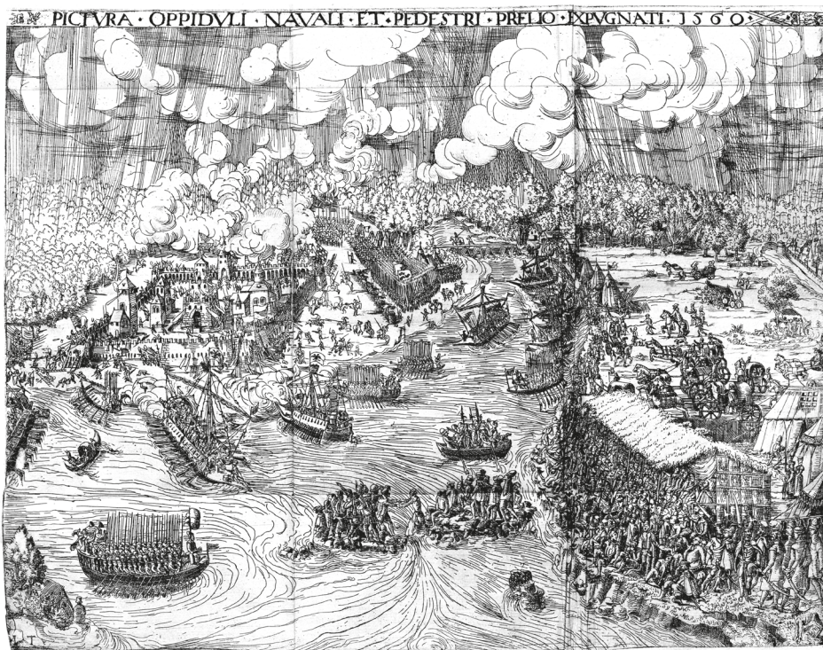
3. ábra. Könyvillusztráció, Thurnier Buech Warhafftiger Ritterlicher Thate[n]... / durch Hanssen von FRANCOLIN Burgunder... beschriben, Wien, Raphael Hofhalter; [1561?], LXXVIv utáni kép

készített rézkarcok 24 az udvari ünnepeket (bál, ünnepi vacsora), illetve a gyalogos, lovas és vízi (3. ábra) tornajátékokat mutatták be.