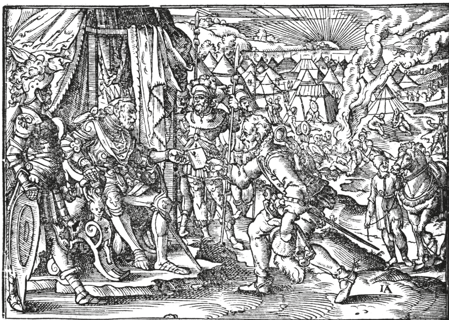
22. ábra. Könyvillusztráció, [BONFINI, Antonio], Ungerische Chronica... , Frankfurt, Feyerabend, 1581, 240r

Magdolna nevű leányának (1443–1495) személyében, vita alakult ki azonban az esküvő helyét illetően. A Habsburg származású fiatal király egy ideig habozott a szoba jöhető helyszínek, Bécs, Buda és Prága között, végül azonban a cseh kormányzó (a későbbi király), Podjebrád György (1420–1471) erőszakos fellépése hatására „bejelentették, hogy a menyegzőt Prágában fogják megtartani”. 112 A király kíséretével maga is Prágába érkezett, ahol külön bizottságot neveztek ki a menyegzői ünnepség megszervezésére, illetve egy roppant előkelő és nagyszámú – 170 lovagból, valamint 40 szüzből és matrónából álló – küldöttséget állítottak össze a menyasszony elhozatalára. Bár a „királyi esküvőt mértéktelen költséggel előkészítették”, s számos környékbeli fejedelem jelezte részvételét az eseményen, a király „a nagy várakozás és készülődés kellős közepén” 113 váratlanul meghalt. A fametszettel Feyerabend több korábbi kiadványában is találkozunk: az 1566-os Thurnierbuch ban és későbbi kiadásaiban (1578, 1579) többször szerepelt a lovagi tornák után rendezett bálók, táncmulatságok ( Der erst Thurnier / Wie man den Abendtanz anfieng / und die Danck außgab ) illusztrációjaként. 114