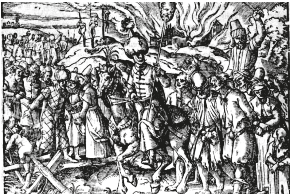
18. ábra. Könyvillusztráció, [BONFINI, Antonio], Ungerische Chronica... , Frankfurt, Feyerabend, 1581, 48v

Az 1581-es Bonfini-kiadás illusztrációinak a Feyerabend-kiadványok metszeteivel való rokonságát a Történelem – kép kiállítás katalógustételének szerzője is megemlíti: „Valamennyi fejezetet egy tömör tartalmi összefoglalás vezet be, s az 1545-ös berni kiadáshoz... hasonlóan ebben a kötetben is a fejezetek élén különböző művészekről származó, a témához igazodó fametszetek találhatók. Közülük némelyik a magyar viselettörténet szempontjából különösen becses, mások pedig a Feyerabend-nyomda és -kiadó más metszetes kiadványainak illusztrációira emlékeztetnek. Számos metszeten Jost Amman szignatúrája látható.” 90