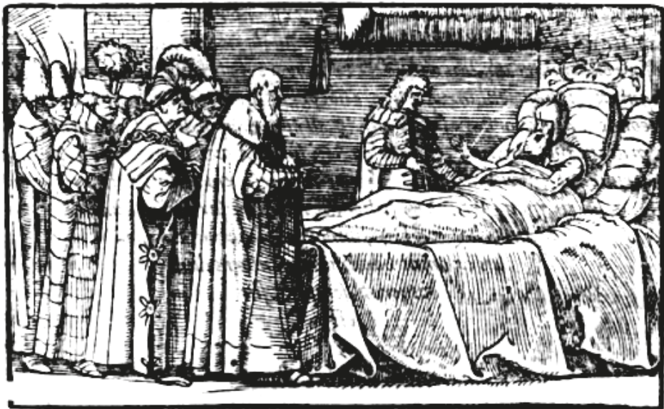
16. ábra. Könyvillusztráció, [BARLETIUS, Marinus], Scanderbeg..., Frankfurt, Feyerabend, 1577, 155r