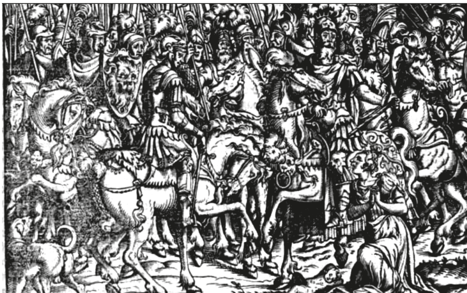
23. ábra. Könyvillusztáció, [BONFINI, Antonio], Ungerische Chronica... , Frankfurt, Feyerabend, 1581, 298r

Az eredetileg Titus Livius ókori történetéhez készült antikizáló fametszettel, 115 melyen egy folyó- vagy tengerparti városhoz érkező, díszes ruhájú lovasokból és gyalogosokból álló menetet látunk, a Mátyást királlyá választó rákosmezei országgyűlés leírásában (268r) találkozunk: „Mivel pedig a diétát a Rákos mezőn, Pest külvárosánál szokás tartani, a királyválasztó országgyűlésre elsőként [Szi-lági] Mihály érkezett meg számos csapattal, előkelők és nemesek pazar seregével.” 116 Ugyanígy tartalmi egyezést találunk a szövegkörnyezetével annak az illusztrációnak az esetében is, amelyiken egy népes társaságtól körülvevett, trónon ülő királyt látunk (290v). A kép alatt olvashatjuk Mátyás királynak az országgyűlésen, trónján ülve elmondott beszédét, melyben a csehekkel folytatandó háború szükségességét indokolta. „A király lenyűgöző szónoklata után kivétel nélkül mindenki az ő véleményére állt.” 117 Az antikizáló kép eredetileg az 1568-as Titus Livius-kötetben tűnt fel Romulus macht Ordnungen cím alatt. 118