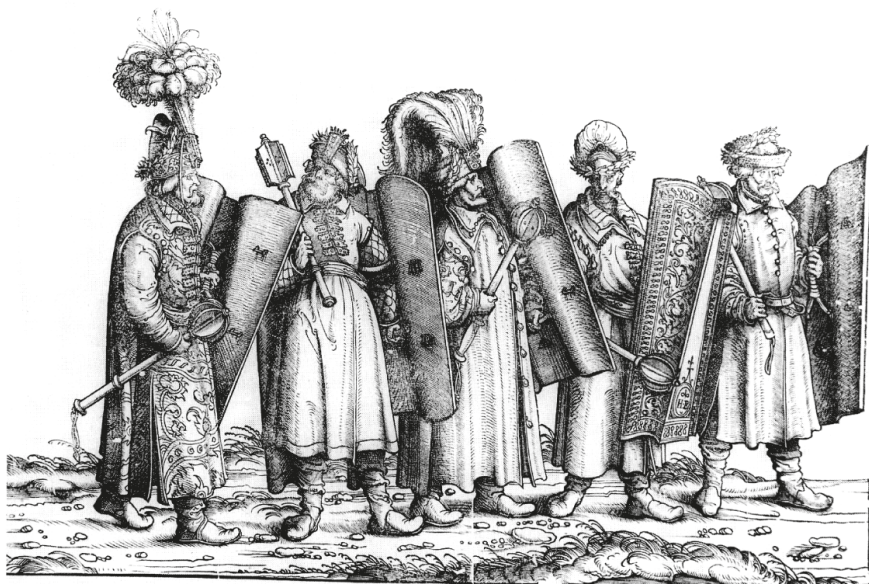
10. ábra. Hans BURGKMAIR, Fegyveresek I. Miksa Diadalmenetén, 1516–1518 (ENDRŐDI 2000, i. m. 201.)