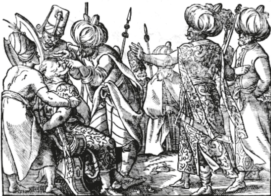
17. ábra. Könyvillusztáció, [TANCO, Vasco Diaz], Türckische Chronica... , Frankfurt, Feyerabend, 1577, 1r

ján „levő metszet egy előkelő magyar úr lovas képét ábrázolja, különösen érdekes a nemzeti viselet hiteles visszaadása”. 89 (13. ábra) A kép azonban, mely a Bonfini-kötet elején, a Szkítiát ismertető részben még egyszer feltűnik (1v), már a Szkander bég életét ismertető, 1577-es német nyelvű kiadványban (151r) is megtalálható, mégpedig Krujë (Croia) 1466. évi, Ballaban Badera pasa által vezetett, sikertelen török ostromának – melyben Ballaban is életét veszítette – leírásában. Mivel a fametszeten ábrázolt lovas alak valóban a korábban említett, sztereotipikus magyar ruhát – köntöst és strucctollas süveget – visel, nem zárható ki, hogy már az 1577-es kiadvány előtt is közzétették egy magyar témájú szövegben, ez azonban további kutatást igényel. Az mindenesetre bizonyos, hogy az 1581-es Bonfini-kötetben van egy stílusában, formátumában nagyon hasonló illusztráció, melynek főszereplőjeként szintén egy magyaros öltözetű – övvel összefogott köntöst és strucctollas süveget viselő – személyt látunk (16r). Bár a fametszet előképét nem sikerült megtalálnom, mivel a központi szereplő mögött magyaros ruhás urak, előtte pedig kaftános-turbános, térdelő törökök láthatók, s mivel a körülötte olvasható szöveg még mindig a szkíták és a hunok történetével foglalkozik, elképzelhető, hogy ez az illusztráció sem közvetlenül a szöveghez készült, hanem egy korábbi kiadványból való átvétel.