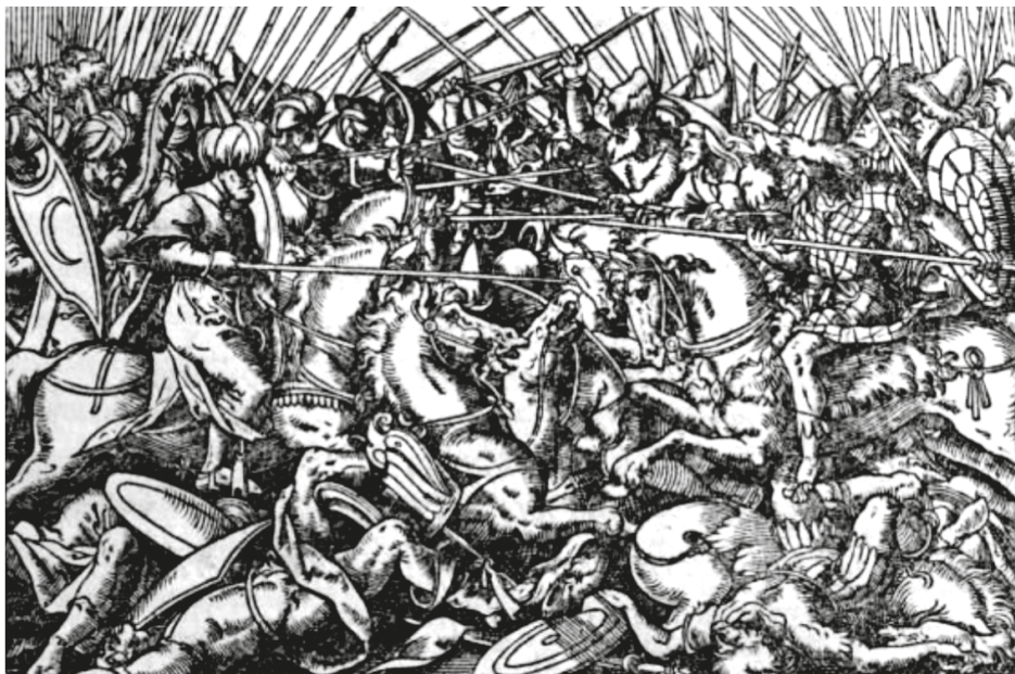
14. ábra. Könyvillusztráció, FRONSPERGER, Leonhard, Kriegßbuch... III , Frankfurt, Feyerabend, 1573, CXXXVv

vű kiadásában is. 73 A kiadó a címlapképen (13. ábra) és a Zrínyi Györgynek szóló ajánlás lovas vitézt ábrázoló fametszetén kívül mind a 45 könyv elejére elhelyezett egy-egy illusztrációt, némelyiket többször is közreadva. A képek többsége azonban nem ehhez a kötethez készült, hiszen már a Feyerabend által korábban kiadott