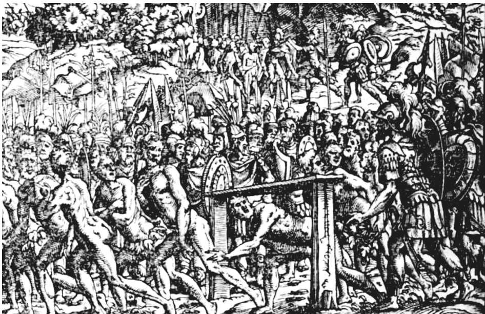
24. ábra. Könyvillusztráció, [BONFINI, Antonio], Ungerische Chronica..., Frankfurt, Feyerabend, 1581, 367v

hetjük meg a törökök óriási méretű hadi készülődéséről: 133 a török hódítások kegyetlenségére emlékeztethette az olvasókat.