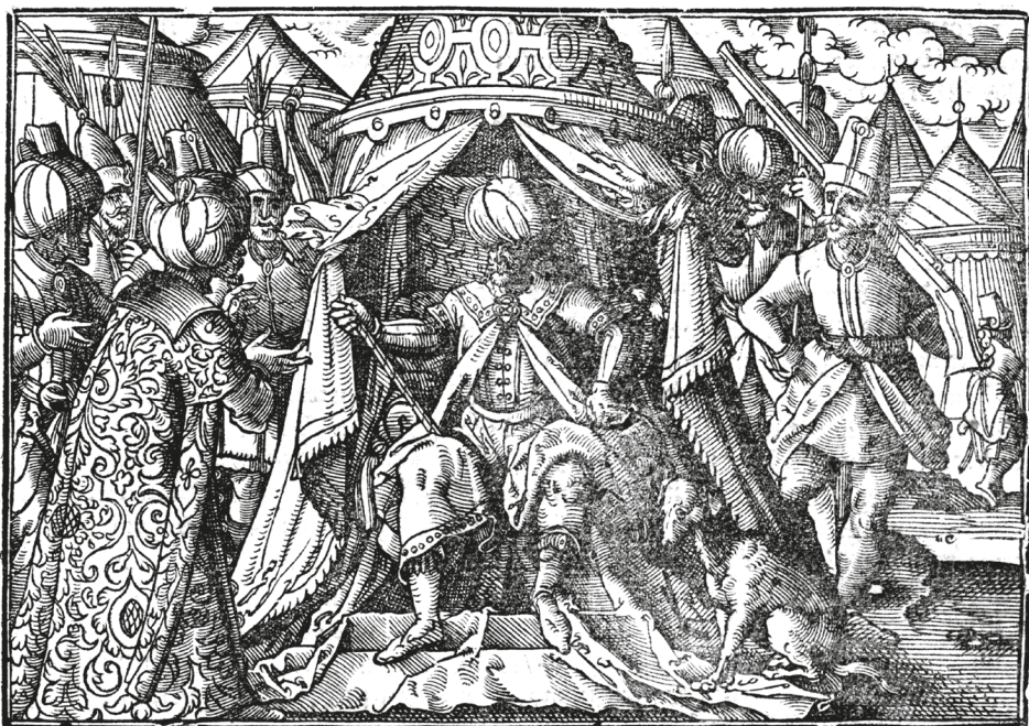
7. ábra. Könyvillusztráció, HERBERSTEIN, Sigmund, Die Moscouitische Chronica, Das ist Ein gründliche beschreibung oder Historia / deß mechtigen vnd gewaltigen Großfürsten in der Moscauw..., Frankfurt, Feyerabend, 1576, 123v

képei már antikizálók voltak, azaz sokkal „korhűbbek”, „hitelesebbek”, mint az 1505-ös kiadáséi. Az ilyenfajta hitelességre törekvéssel egyébként az európai könyvkiadásban már korábban is találkozunk: a fiatal korban fogolyként Drinápolyba került Georgius de Hungaria (1422 k.–1502), azaz Magyarországi György törökországi élményeit bemutató, Sebastian Franck által latinból németre fordított, 1530-as kiadványban például már hitelesnek tűnő törökábrázolások szerepelnek. 38