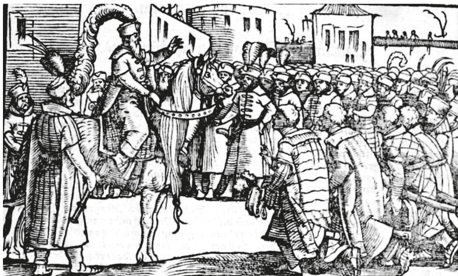
13. ábra. Könyvillusztráció, [BONFINI, Antonio], Ungerische Chronica..., Frankfurt, Feyerabend, 1581, címlapkép

„a szöveg tartalmához kapcsolódnak, és az ábrázolt személyek korhű viselete miatt az illusztrált kötet különösen jelentős történeti forrásnak számít”. 70 Valóban, az illusztrációkon a jóval régebbi korokban élt embereket is 16. századi öltözékben látjuk, gyakran a korábban említett, tipikusan magyar viseletben, övvel összefogott köntösben és strucc- vagy darutollas süvegben. Ezt figyelhetjük meg például a kötet első, az őshaza leírásához mellékelt illusztrációján (Ir) vagy az Attila és Buda harcát bemutató fametszeten (XXXVv). 71 (12. ábra) Zsámboky János 1558-ban Bécsben megjelentette Pietro Ranzano (1428–1492) Epithoma rerum Hungaricarum át, 1568-ban pedig Bázelen Bonfini magyar krónikájának teljes szövegét adta ki latin nyelven, mindkettőt illusztrációk nélkül. 72