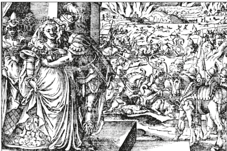
19. ábra. Könyvillusztráció, [BONFINI, Antonio], Ungerische Chronica..., Frankfurt, Feyerabend, 1581 150r

A II. András (1176 k.–1235) uralkodását ismertető rész előtti antikizáló fametszet (150r) egy díszes épület lépcsőjén álló nőt látunk, akit egy előkelő öltöztű férfi ölel át. (19. ábra) Bizonyára nem véletlen, hogy ebben a könyvben találjuk Bánk bán feleségének Gertrud királyné öccse általi elcsábítása történetét, 102 hiszen a férfi erőteljes mozdulata a szemlélő számára az erőszakos közeledést is érzékeltethette. A kép ugyanakkor eredeti kontextusában épp ennek ellenkezőjét ábrázolta, mivel a római polgárjogot kapott görög történetíró, Plutarchos (46/48–125/127) munkájának illusztrációjaként a Gracchusok anyja, az erényes római nő tökéletes megtestesítője, Cornelia Scipionis Africana (Kr. e. 190 k. – Kr. e. 100 k.) boldog házasságát szemléltette. 103