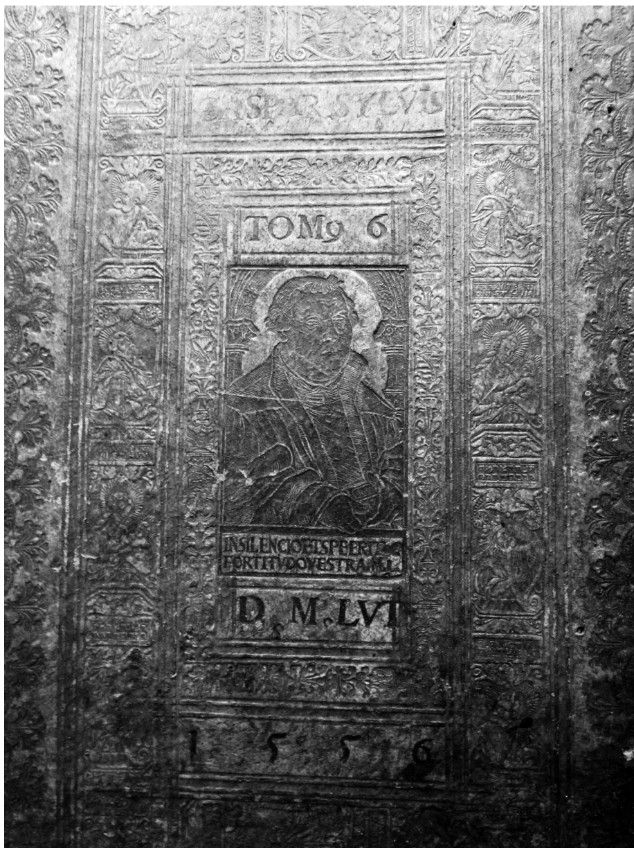
2. ábra: Kötéstábla