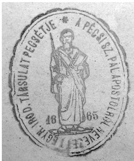
4. kép: A Szent Pál Társulat pecsétje

A forrás Pécsi Egyházmegyei Könyvtárbeli fellelhetősége arra enged következtetni, hogy mint az egyik előd-könyvgyűjtemény forrása maradt a gyűjteményben. Feltételezzük, hogy a Püspöki Szeminárium Könyvtárával egyetemben a növendékpapság könyvgyűjteménye is az 1968-ban Cserháti