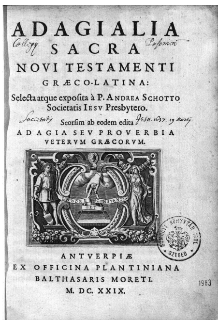
2. sz. melléklet