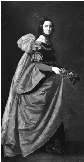
6. melléklet. Francisco de Zurbarán, 1635