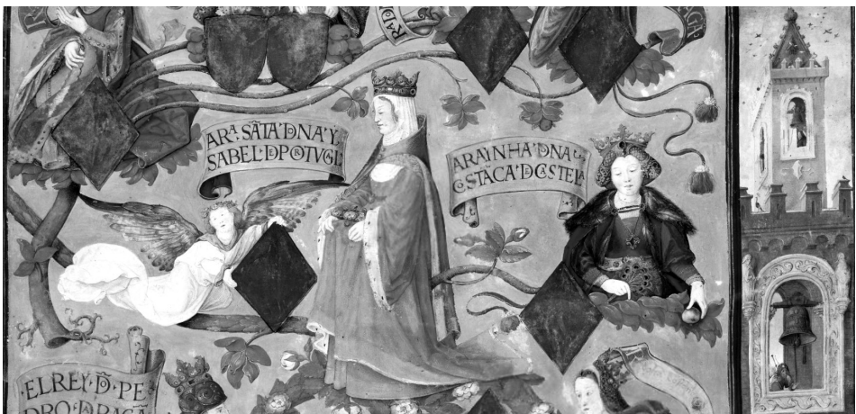
4. melléklet. Antonio de Holanda: Portugál királyi családja, 1530–34