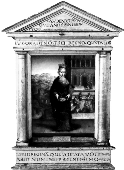
5. melléklet. Ismeretlen festő: Portugáliaiai Szent Erzsébet, 1538–55