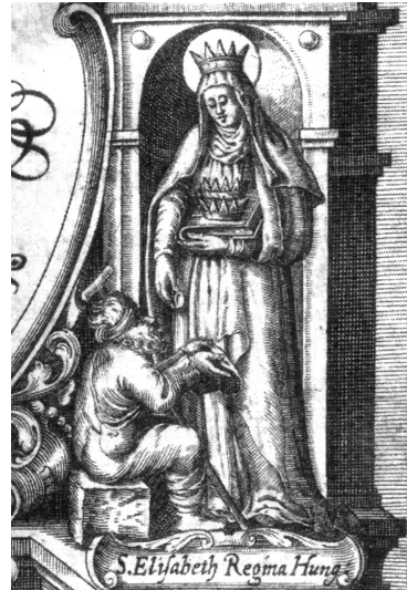
7. melléklet. Pázmány Péter: Isteni igazságra vezérlő kalauz (címlap részlet), 1613