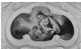
10. melléklet. Portugáliai Szent Erzsébet