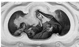
9. melléklet. Árpád-házi Szent Erzsébet