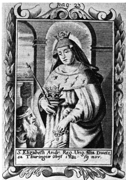
11. melléklet. Schott Hoffman: Árpád-házi Szent Erzsébet, 1689, (Régi Magyar Szentség, metszetek)