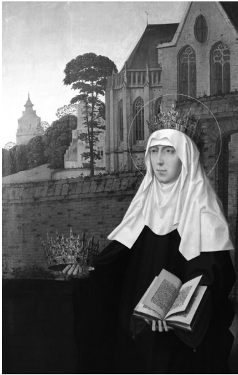
2. melléklet. Jan Provost (1565–1529): Árpád-házi Szent Erzsébet