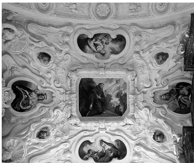
8. melléklet. Szent István kápolna boltozata