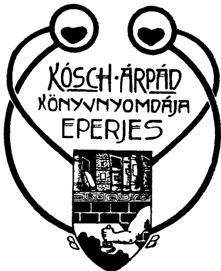
11. ábra. Kósch Árpád (Eperjes)