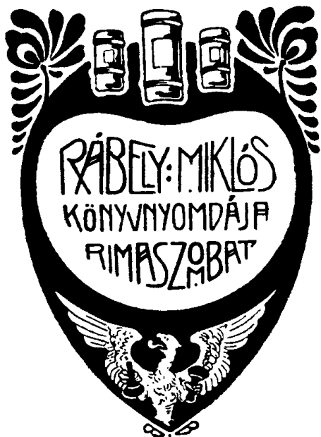
9. ábra. Rábely Miklós (Rimaszombat)