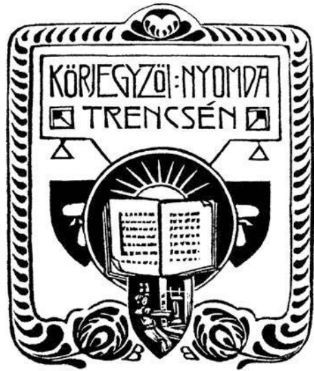
14. ábra. Körjegyzői nyomda (Trencsén, 1912)