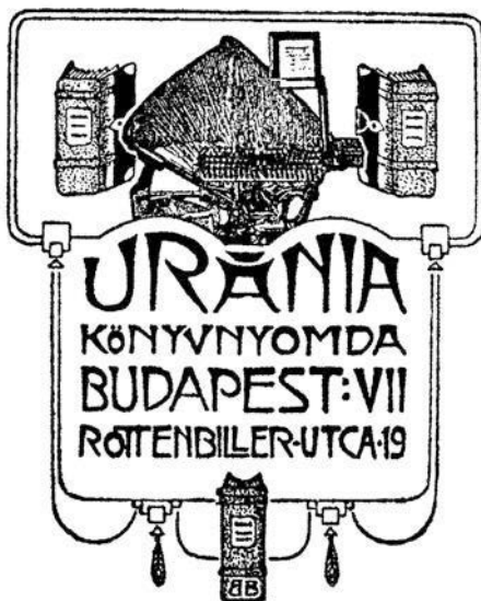
6. ábra. Uránia (Budapest, 1907–1909)