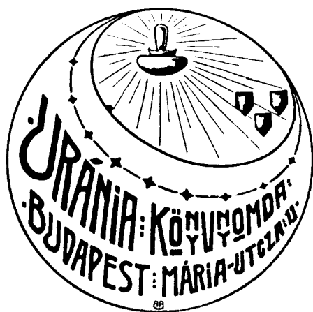
7. ábra. Uránia (Budapest, 1908 vagy azelőtt)