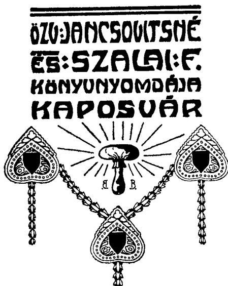
10. ábra. Özvegy Jancsovitsné és Szalai Ferenc (Kaposvár)