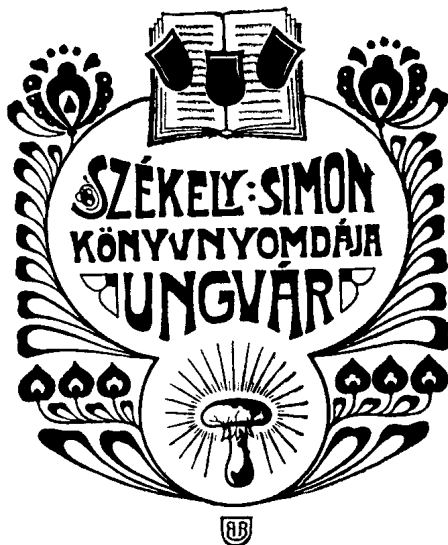
8. ábra. Székely Simon (Ungvár, 1908 vagy azelőtt)