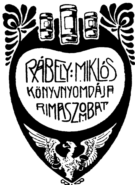
9. ábra. Rábely Miklós (Rimaszombat)