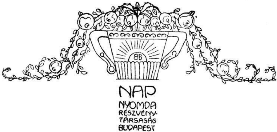
15. ábra. Nap Nyomda Rt. (Budapest, 1916)