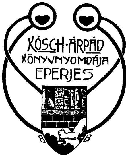
11. ábra. Kósch Árpád (Eperjes)