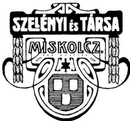
12. ábra. Szelényi és Társa (Miskolc, 1911–1913)