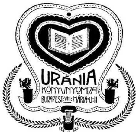
5. ábra. Uránia (Budapest, 1906)