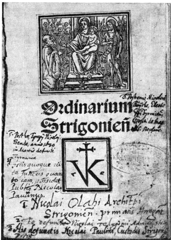
3. Az Ordinarium Strigoniense (Venetiis 1520) címlapja a tulajdonosok sorrendjét is megőrkíftette